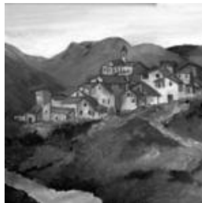
Herriak. Margo askotan ageri dira. I.GARCIA