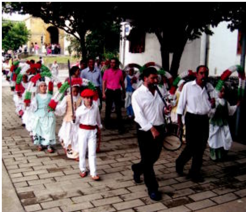
Udal korporazioa txistulari eta dantzariekin meza nagusia bukatuta Santio Egoitzara joaten. NOELIA LATABURU

JAIAK ▶ Musika, dantza, kirola eta jolasa izan zen atzo; gaur, Santa Ana eguneko ekitaldiak ▶ 4-5