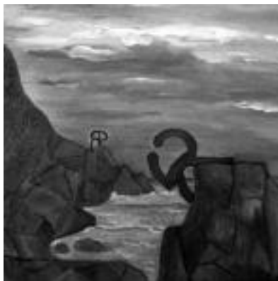
Donostia. Haizeen orrazia eskultura. I.GARCIA