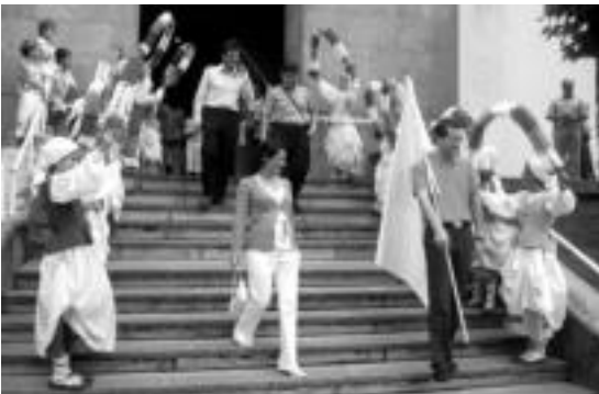
Udal korporazioak Santiago egotzara bisita egin zuen meza nagusiaren ostean, herriko dantzari eta txistulariek babestuta.

Atzo Santio Eguna izan zen musikarako, kirolerako eta jolaserako tartea izan zelarik; gaur, berriz, Santa Ana Eguneko ospakizunak egingo dituzte egun guztian zehar