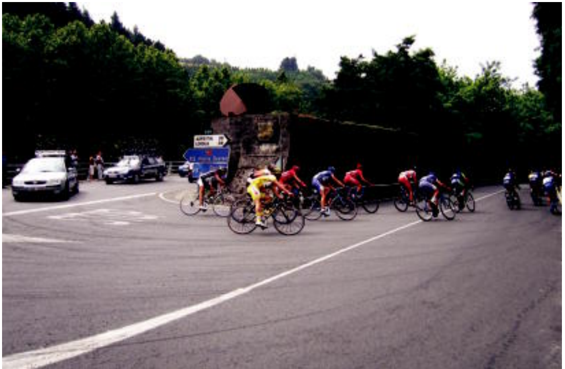
Txirrindulariak Olarraingo akueduktotik pasatzen, Goieritik etorri eta Bidania igotzeko bidean. INIGO ASENSIO

TOLOSALDEA ▶ Ordizako proba lau aldiz pasatu zen gure eskualdetik eta ikusle ugari bildu zituen; Garcia Quesada izan zen irabazlea eta Del Rio, 9.a