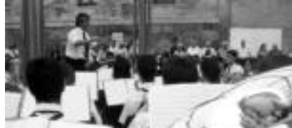
Kontzertua. Berdura plazan, Valtierako musika bandak eskaini zuen; jende ugari bildu zen bertan bandaren dionukei guzateko, bakalazurreko aperitibo ezin hobea.