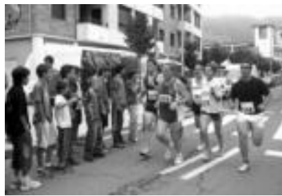
Herri krosa. Urtero bezala, Zumbeltz elkarrekin herri krosa antolatuta zuen herriko kaleetan barrena. Adin guztietako jendeak hartu zuen parte bertan, gizezko zain emakumezko. Atererak ere kaleetara irten ziren korrikalariari animas emateko, giroa ere berotu zutelarik. NEGLIA LATABURU

Gaur, berriz, Santa Ana Eguna izango da eta festak ez du etenik izango. Goizeko diastan ostean, haurrek izango dute zer gozatu txistularien plazan antolatuko duten haur parke handian. Arratsaldean ere bertara jolaserako josteko aukera izango dutelarik. Halaber, musika bandak jokatuko dute herriaren artean. Berdura plazan, kirolak ere presentatza izango du gaurkoan, plaza-ko pilotalekuan jokatu diren joko garbi pilota partidekin. Ondoren, sabelak ondo bete