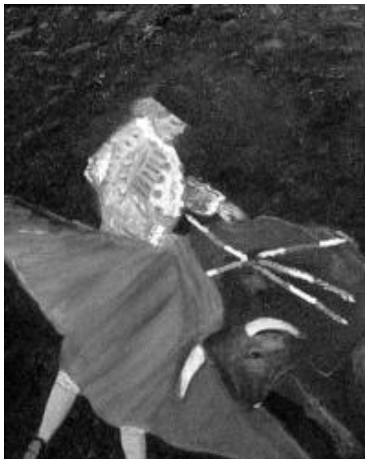
Zezenak. Erakusketa honetan zezen gaia ere agertzen da. I.GARCIA