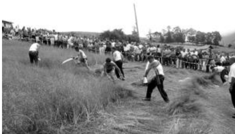
Bi segalariak, aurrekoa Kanflanka, beren laguntzaileekin, eginahaletan buru belarri aritu ziren. JAIONE ASTIBIA

Jon Kanflanka, kiloz 75,5 gutxiago ebakita, txapeldunak 1.060, 2. gelditu da