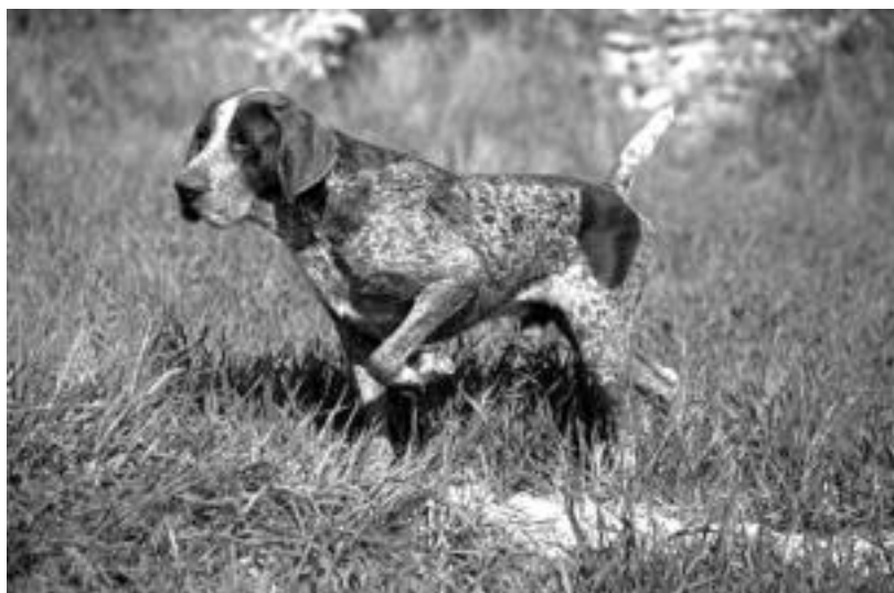
Hiru multzotan banatuko dituzte parte-hartzaileak; tentu handiz egin beharko dute lana guztiek. HITZA

I. Ehiza Zakur Lehiaketa Herritarra eta Probintziala antolatu du Tolosako Ehiztari Elkarteak; izen-ematea, egunean bertan