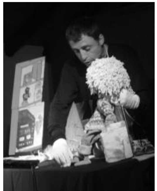
Atzoko antzerki saioko une bat.

Belauntzako, Leaburuko, Gazteluko eta Orexako ludotekako gaztetxoek ederki igaro zuten atzo goizean Belauntzako kultur etxean izan zen antzerki saioarekin. Hain zuzen ere, Irrintzi antzerki taldearen Bakartxoaren zapatilak antzezlanak ikusteko aukera izan zuten bildu ziren 30 inguru lagunek.