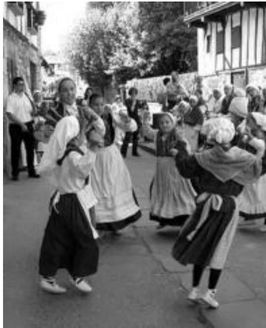
Alurr dantza taldekoen gaztetxoaren emanaldi bat. HITZA

Euskal Herriko ezezik nazioartetik ere joan dira, hain zuzen ere, 9 eta 15 urte artean dituzten gaztetxoak elkar topatzea eta kulturak ezagutaraztea izaten baita xede nagusia. Horrela, Moldabiako Fantazie taldearen, Armeniako Aravot Hayastan-en eta Mexikoko Tonalli Ambar-en dantza emaldiriez gozatu ahaliko dute jaialdia ikustera joaten direnek. Senegal eta Sri Lankako taldeek etortzerik izan ez dutenez egun bat atzeratu beharra izan dute jaialdia, eta horien ordez Errusiako Sayzanak eta Serbiako Abrasevic taldeak izango dira. Denera berrehun gaztetxo inguru jasoko dituzte Ezpeletan, eta, berrogeita hamar