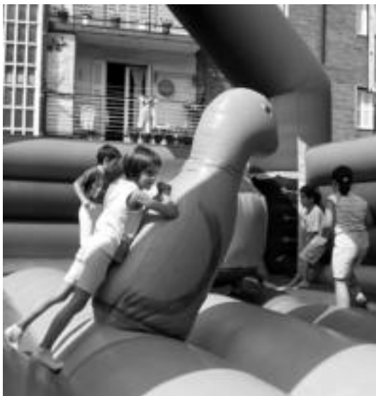
Jolas parkea izan zen Larraitz auzoan haurrek gozatzeko.