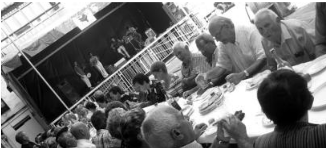
Mendi martxaren ondoren hamaiketakoia izan zuten atzo jubilatuek herriko plazan.