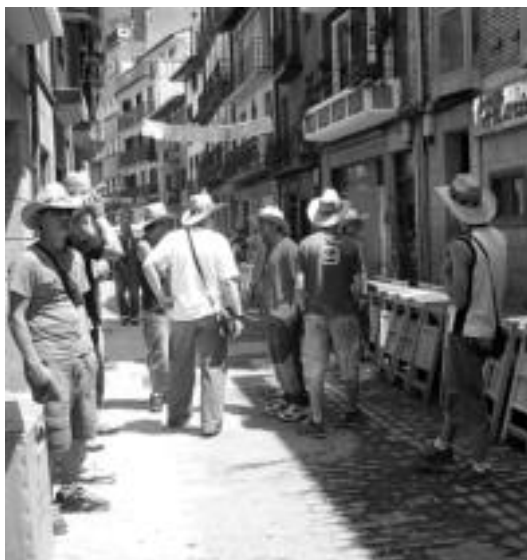
Eguzkiak babestu ziren herri bazkariko partaideak. N. LATABURU