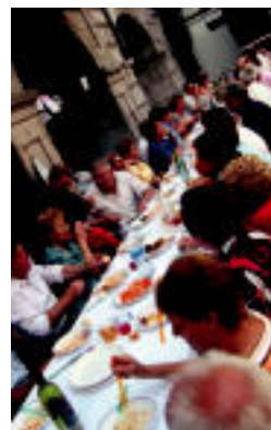
Atzoko hamaiketakoa.

JAIK ▶ Meza nagusia, arku tiraketa, dantzariak, bertsolariak, kontzertuak... ere izango dira ▶ 5