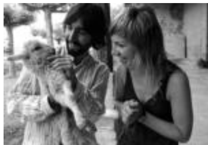
Ermuarra eta zizurkildarra zinemaren gubi aktore dira.

kin Euskal Herri osoko antzekietan jokatu du haren rola. «Baserrit gero herrietan edo eskualde berrien aurrean, publiko oso zabalearengana iritsi gara. Hasieran lehen eguneko emanaldia salbatzea zen asmoa, eta pikkanaka-pikkanaka konturatu ginen antzerki guztiak betetzen gertatuela eta jendeak maio egiten zuela txalo». Baina antzerkiko Ixabelek eta filmekoak desberdintasun upari izango dituzte. «Antzerki-