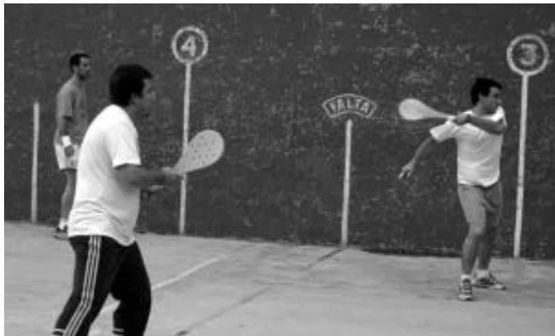
Ostiral arratsaldean ere jokatu zituzten hiru norgehiagoka Berazubiko pilotalekuan. N. LALATABURU

Partidak Berazubiko pilotalekuan jokatu dituzte; guztira hamabi bikotek eman dute izena txapelketan lehiatzeko