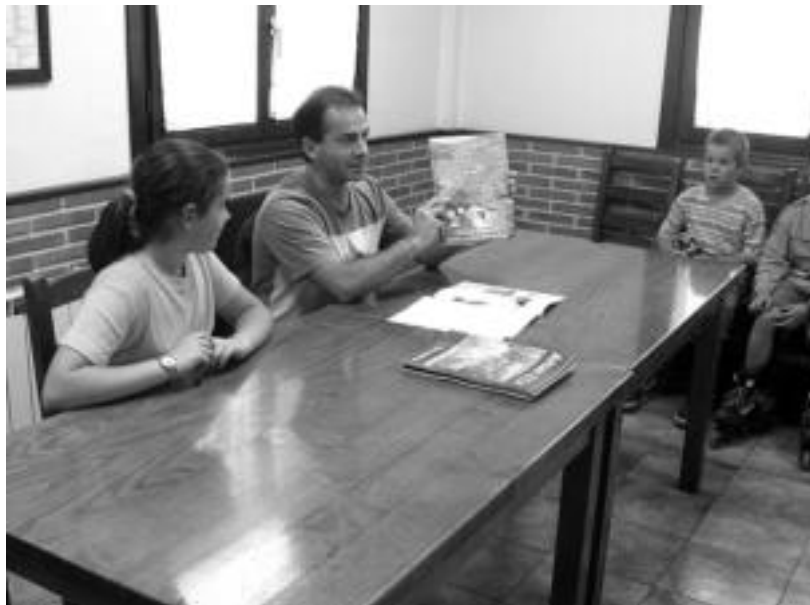
Herenegun egin zuten aurkezpen ekitaldia Elordi elkartearen, non jende andana bildu zen. NOELIA LATABURU

Aurkezpen ekitaldia herenegun burutu zuten Elordi kultur elkartearen; jende andana bildu zen bertan, ondoren merienda ere banatu zutelarik