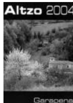
Urtekariaren azala.

Helburua betetzen ari dira beraz egileak, pixkanaka pixkanaka, kalitatezko zerbitzu