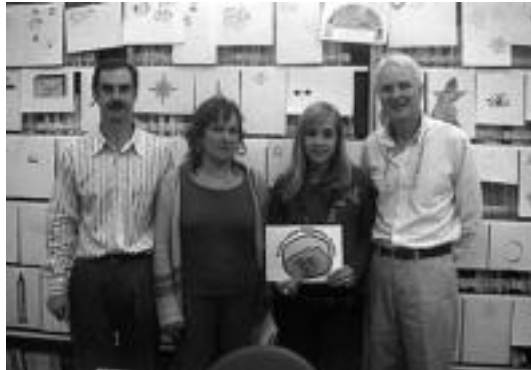
Irabazlea (eskuinetik bigarrena) eta zuzendariak, saria ematen.

Horretarako, hiru ikastetxeak identifikatuko zituen irudia bilatzeari ekin zioten. Samaniego, Orixe eta Tolosaldea Lanbide Heziketa Institutuak