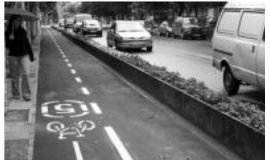
Bidegorria San Frantzisko pasealekuan. IRATXE ETXEBESTE

Hiriko txirindularien ikuspegitik Gorosabel kaleko bidegorria erabiltzaileentzat «ibilbide eroso eta funtzionala» dela dio Kalapie «erdigunean kokatuta eta herriko bide sarearekin ondo lotuta dagoelako». Errepidean kokatzea eta plastikozko pibote batzuen bidez bereiztea («egokia») iruditzen zaie. Beste herri askotan erabili den konponbidea dela eranstean dute. Bestalde, gaur egungo diseinuak oinezko, auto-gidari eta txirindularientzat istri-