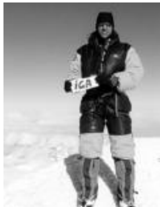
Aizpuru ibartarra McKinley gailurrean. HITZA