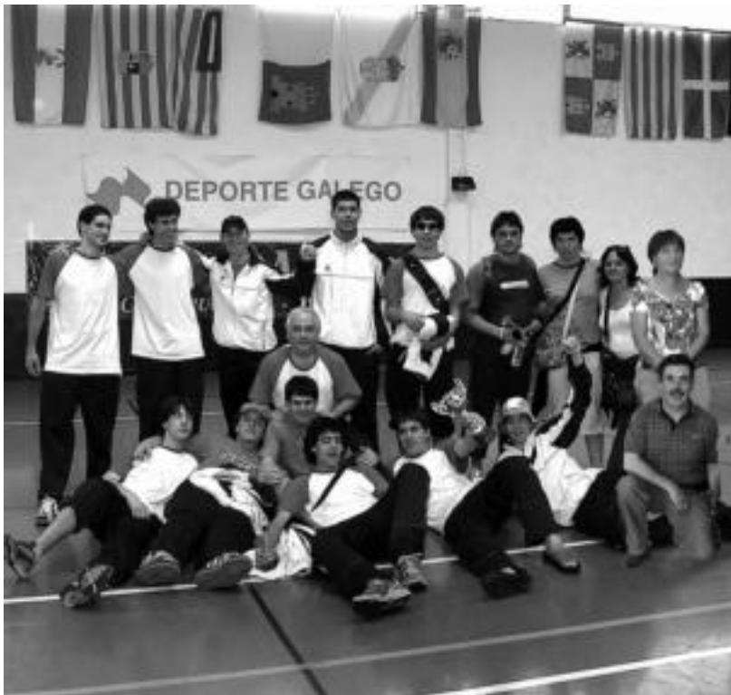
Tolargi-ko jokalariek, taldeko arduradunak eta senitartekoak, pozarren, Pontevedran, garaikurrarekin.

Izan ere, halaxe zioten: «Maila horretara osagarri hauekin bakarrik heldu daiteke: areto