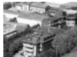
Asuncion klinika. L. MONTES

Guardien konpentsazioa ere arautu dute, ELA adierazi duenez, «eta hor ere lortu da Osakidetzarekin homologa-