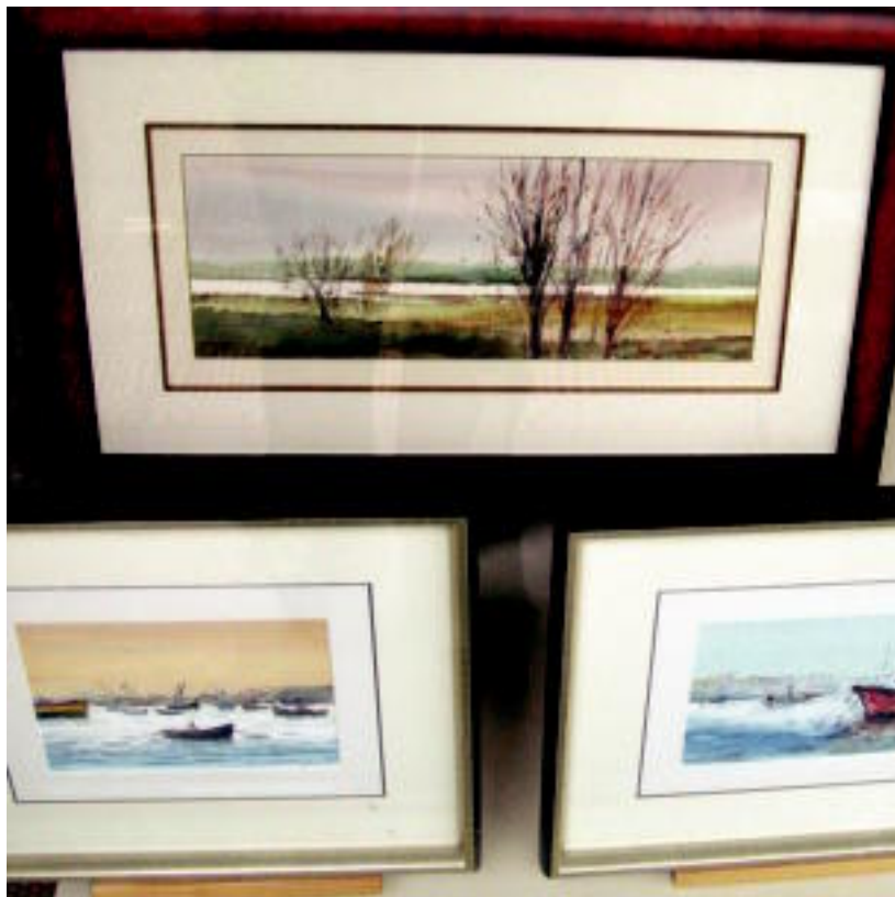
Itsasoko eta mendiko paisaiak ikus daitezke Galizaren erakusketan. IRATXE ETXEBESTE

TOLOSA ▶ Xabier Galiza artistaren akuarelak dira ikusgai Poxpolin dendako erakuslehoan; askotariko paisaiak margotu ditu galiziarrek