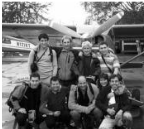
Taldeko kideak glaziarera aeroplanoz joan aurretik. HITZA