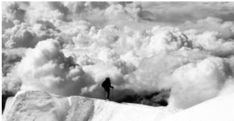
Temperatura ikaragarriez gain, gailurrean horrelako paisaiak gozatu ahal izan zuten. HITZA

Uste zutena baino gogorragoa izan da Alaskako gailurra eskualdeko lau mendizaleentzat; esperientzia polita izan da errepikatzeko gogoz itzuli dira