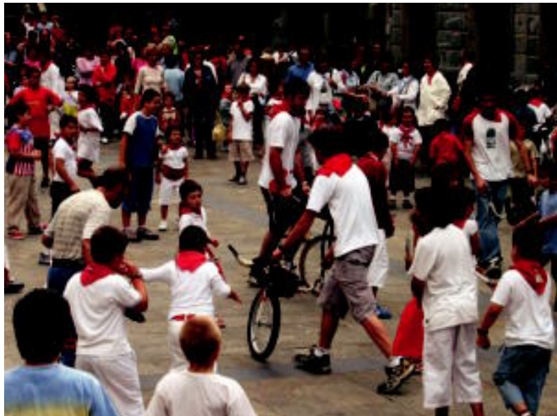
Jendetza bildu zen Plaza Berrira; jai giroan ospatu zuten guztiek San Fermin eguna. LEIRE MONTES

TOLOSA ▶ Herriko haur eta gaztetxo ausartenek entzierroa korritu zuten, atzo, Alde Zaharreko sanferminetan; txokolatada eta 'Probre de mi' ere izan ziren