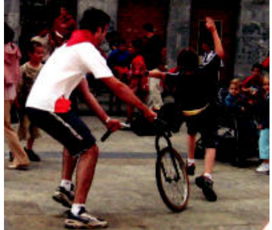
Zenentxoan aurrean trebetasun handia erakutsi zuten askok. L. MONTES