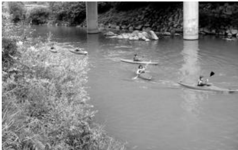
Lehen txandako gazteak piraguaren gainean aritzen dira goizean goizetik Alegiako ibaian. NOELIA LATABURU

Astelehenean hasi zen eta bi talde aritzen dira herrian; bihar amaituko dute ikastaroa Pasaiara txangoa eginez