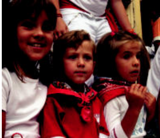
Kontent batzuk, beldur besteak, entzierroari begira. LEIRE MONTES

▶ HITZAK ez du bere gain hartzen egunkarian adierazitako esanetan eta iritzien erantzukizunik.