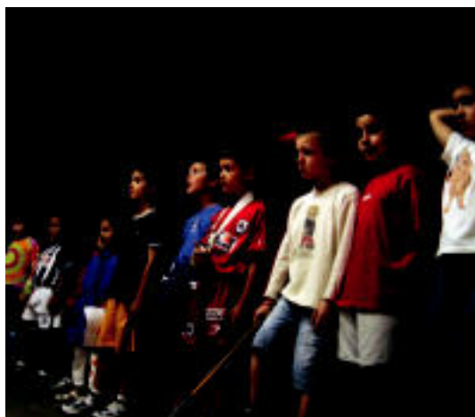
Antzerki taldeko gaztetxoak atzoko entseguan. NOELIA LATABURU

HELBURUA ▶ Antzerkiarekiko piztu zaien grina «bultzatzea» dute helburu gurasoek eta irakasleek ▶ 5