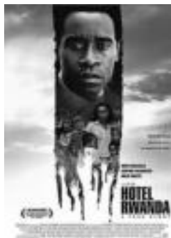
Hotel Rwanda gaur ikusgai.

▶ Zuzendaria: Nick Cassavetes. ▶ Sinopsia: John Q. lantegi batean lanean ari den gizon arrunta da. Bere semea