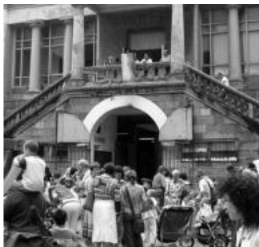
Jende ugari hurbildu zen atzo Plaza Berriko txupinazora.

Eguerditik aurrera ekintza ugari izango dira Plaza Berrian; iluntzean bukatuko da festa