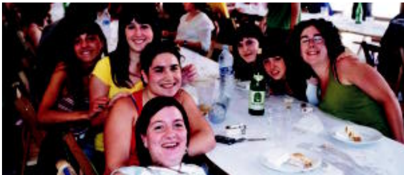
Giro ederrean elkartu ziren 83 ikasle eta 20 irakasle ikasturte bukaerako bazkarian. HITZA