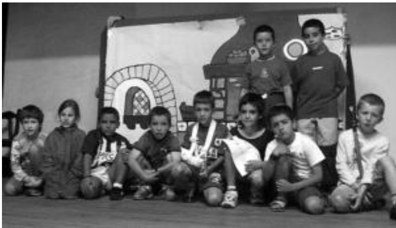
Antzerki taldeko gaztetxoak herriko zineman atzoko entseguren une batean.

Haurrak bi taldetan banatu dituzte, adinaren arabera. Txikiak, 7 eta 8 urte bitartekoak, Martxin txiki eta jentilak emanaldia eskainiko dute eta 12 urtekoak berriz, Ama begira zazu lan ezaguna. Felix Irazustabarrenak azaldu duenez, «gazteak ilusio handiarekin ari dira emanaldia prestatzen».