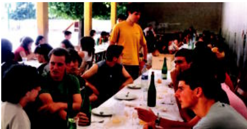
Urte luze hauetan elkarrekin bizitutako esperientziak izan zituzten hizpide bazkalderrek. HITZA

TOLOSA ▶ Lehen eta Bigarren hezkuntza osoa Laskorain Ikastolan burutu duten ikasleek bazkari ederra prestatu diete irakasleek agur gisa