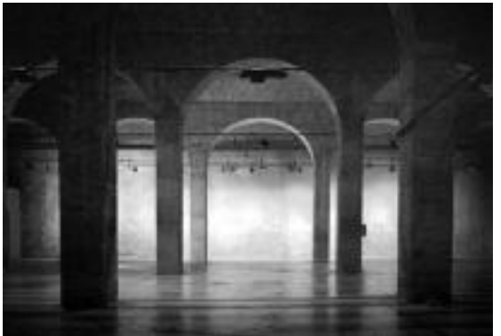
Montehermoso. Hutsik egonda ere, indar handia dute Kultur Zentro horretako aretoek, Montehermoso 1 argazkian.