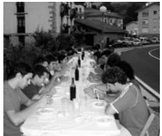
60 lagun inguru bildu ziren afarian. HITZA