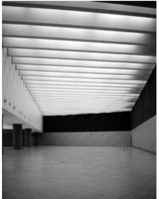
Kursaal. Kursaal 1 du izenburu argazki honek. Eskailerak, eta arteak utzitako oihartzunak, betetzen dute aretoa. J. SAIZAR