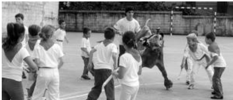
Alde Zaharreko bizilagunen elkarteak antolatu ditu sanferminak, bereziki, haurrentzat. HITZA