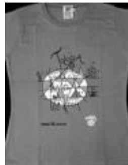
Tartalok egin du diseinua. HITZA

Tartalo diseinu eta serigrafia ziguiluarekin elkarlanean egin ditu; herriaren urteurreneko ospakizunetan erabiltzeko dira