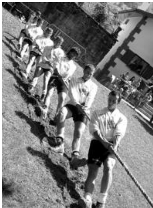
Eguzkiak bete-bete jotzen zuen plazako larratxean, beroa zen. J. ASTIBIA

Goiherri A-k, beste 6 puntu eskuratuta, indartsuena dela erakutsi du berriz