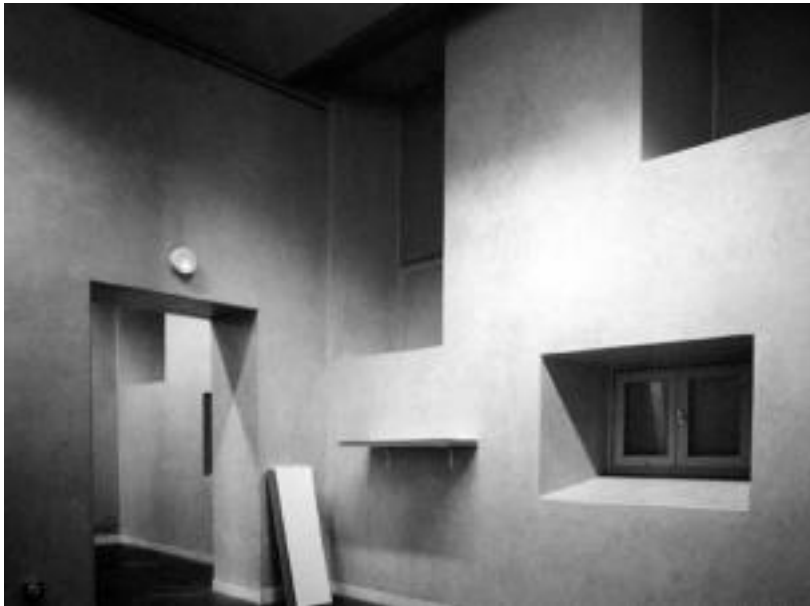
Aranburu Jauregia. Erakusketa amaitu berri da Aranburu Jauregian, eta dena jaso dute; argazki honetako aretoak bete dituzte, oraingo honetan, Dicky Rekalderen lanek. JOXEMI SAIZAR