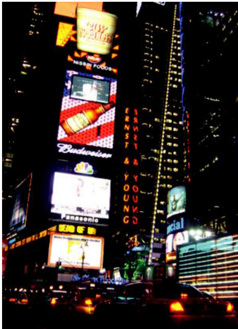
Aurreko lehiaketan parte hartu zuen argazki bat, New Yorkeko irudi bat. ALURIA GOROSTIAGA

TOLOSALDEA-LEITZALDEA ▶ Batzuk oporrak hasi dituzte jada eta kanpora joango dira; irailean oporrei buruzko HITZA Argazki Txapelketa izango da