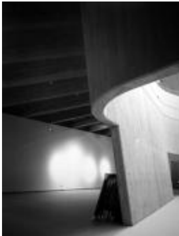
Hutsik? Erakusketa paratu duen aretoen argazkiak dira. Lanik gabe, bai ez hutsik. J. S.