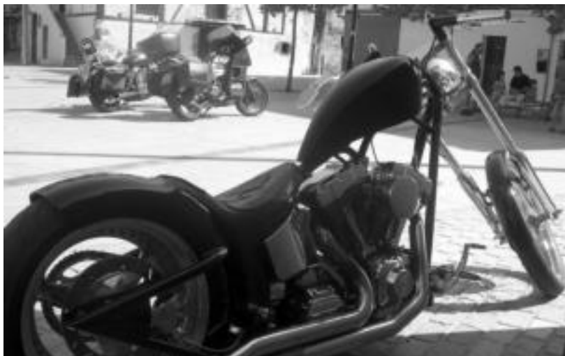
Moto ikusgarriak ikusteaz gain, hauek eginiko era guztietako akrobaziez gozatzeko aukera izan da. HITZA