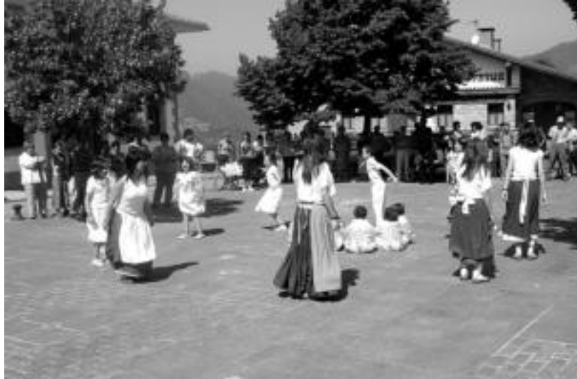
Meza nagusiaren ostean dantza emanaldia eskaini zuten herriko plazan. HITZA

Herenegun izan zuten festen azken eguna Urkizun, Areson, Larraitzen eta Leaburun; Asteasun bertan behera utzi dituzte