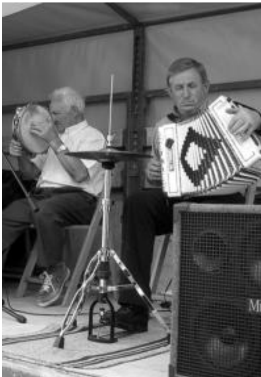
Larritzen trikitixa doinuek alaitu zuten arratsaldea.

Orohar, antolatzaileak oso gustura azaldu dira aurtengo Moto Festarekin. Jende asko elkartu dela azaldu dute, eta eskerrak eman nahi izan dizkie lagundu duten guztiei.