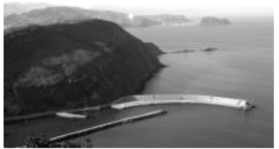
Kostako eta itsasoko ikuspegi ederrak izango dituzte ibiltariak. HITZA

dik Donostiako portura joango dira gero Santa Klara irlara itsasontziz joateko. Guztira 17 kilometro egingo dituzte eta 4,5 orduko ibilaldia izango da. Izena emateko gaur da azken eguna: 943 69 44 58 telefonora deitu edo Aizkardira azaldu.