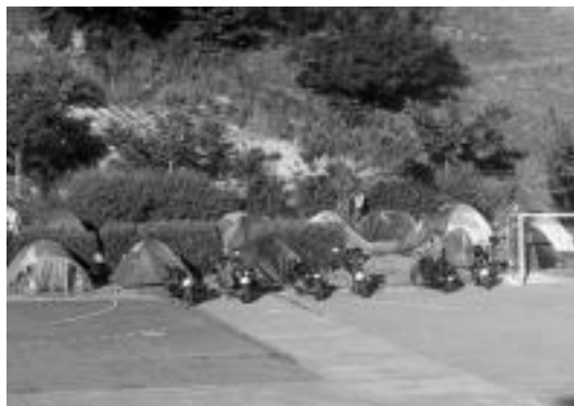
Uzturpe ikastolan izan dute akanpatzeko lekua motozaleek. HITZA

Larunbat arratsaldean hasi zen festa eta igandea bitarte izan da zer ikusi eta zertaz gozatu. Zezen mekanikoa, motorrean eginiko jolasak eta eraldaturiko motorren erakusketa izan ziren arratsaldean zehar herenegun. Gauean, rock musika izan zen entzungai plazan hiru talderen eskutik, eta taretan show erotikoa. Igandean, 100 kilometro inguruko bira egin zuten motozaleek eta ondoren bazkarian bildu ziren 210 parte-hartzaileak. Gosaldu, bazkaldu, afaldu eta lo egiteko leku izan dute bi egunetan Uzturpe ikastola. Eta bertan egin zituzten bazkaldu ostean sari banaketak. Batetik, moto gainean eginiko jokoetan ho-