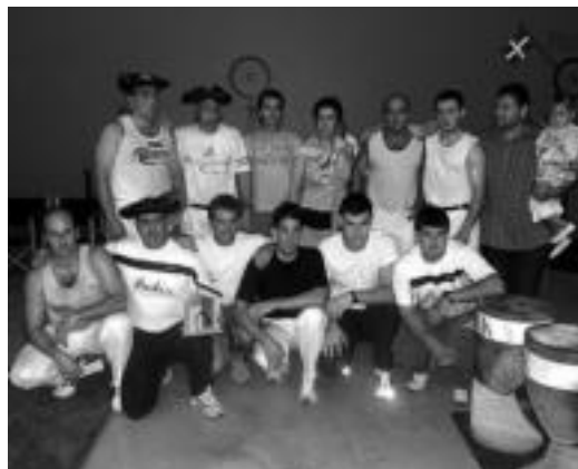
Igandean Leaburun parte hartu zuten kirolariak. HITZA

Jende ugari gerturatu zen Leaburuko Ttontorpe frontoira igandean, eta giro ederra izan zen. Ikuskizun falta ez zen