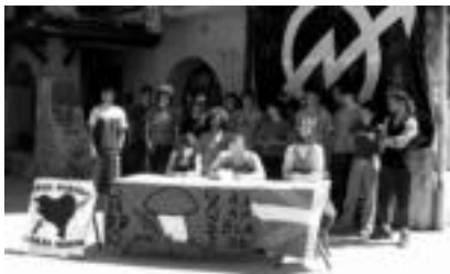
Onddo gazte asanbladako agerraldia egin zuten ostiralean okupatu duten Urdanpilleta etxean.

«Jada hilabete igaro da Gazte txarearen urteurrena ospatu geroztik; gazteek, guñe aske baten urteurrena ospatu geroztik, alegia. Maitasunik hona, argi erakutsi dugu inoiz baino indartsuago gaudela, eta urtebetez desajoino mehatxuen zama bizkarrean eraman ondoren, eta Udalak denbora luze erakutsialako jarrera in-mobilista dela eta, beharrezkotzat jo dugu Gazte txarearen biziraupena ziurtatuko duen bidea guk geuk garatzea. Hitz horiekin hasi ziren hizketan Joan den astean Villabonako Onddo gazte asanbladako kideak, jendeari baten egoeraren berri emateko helburuarekin antola-