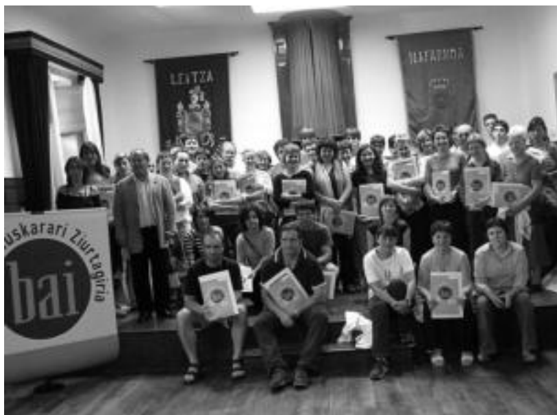
Aresoko eta Leitzako 52 saltoki, eragile eta enpresek jaso zuten beren Ziurtagiria ostiralean. JAIONE ASTIBIA

Ziurtagiriak erakusteko konpromisoa, aurtengo kanpainan Kontseiluak gehien nabarmendu nahi izan duena