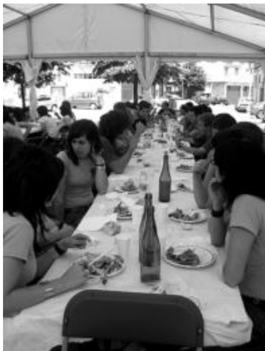
Giro bikaina sortu zuten herriko plazan bildutakoak.

Tolosaldean eta Leitzaldean badute, beraz, herritarrek festarako nora jo. Izan ere, ekitaldiz blai datoz bi egun hauek, aprobetxatzeko ezinhobeak.