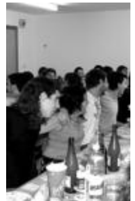
lazgo Gazte Eguna. HITZA

Lizartza Gaztetxeak antolatuta gaur IV. Gazte Eguna egingo dute herrian. Hasieran preso zegoen Gaztetxeako kide baten alde egindako ekitaldia izan zen eta orain Gaztetxeak herriko preso politiko guztiak eta beren sendeak omenend antolatutako eguna bihurtu da. 19:00etan hasiko dira ekitaldiak, herrian zehar egingo duten poteoarekin. Ondoren Gaztetxeak prestatutako afora egingo da, 21:00etan. Aurreko urtean 85 bat lagun bildu ziren aforan eta aurten ere hainbeste biltze espero dute antolatzaileek. Horregatik,