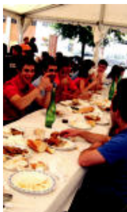
Atzoko bazkaria. N.LATABURU

Atzo Koadrilen Eguna izan zuten Asteasun; gaurko ere hamaika ekintza antolatu dituzte ▶ 5