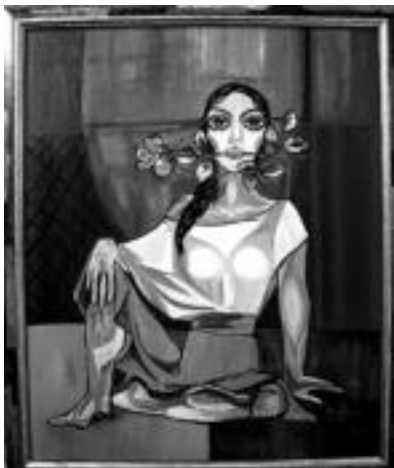
Pintura. Erretratoak, paisaiak, bodegoiak, abstraktoak... denetatik ikus daiteke ikasleen lanen artean. Gaur ere izango da erakusketa ikusteko aukera. J.SAIZAR