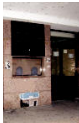
Leidor zinema aretoa. M.SOROA

LEIDOR ▶ Leidor zinemako pantailari agurra emateko saioak izango dira asteburu honetan ▶ 3