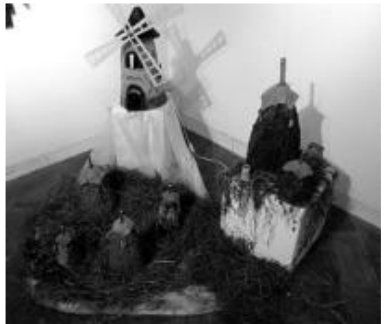
Zeramika. Ontziez gain, eskultura batzuk, plantzak, mahaiaik, belarritakoak, irudiak... ere egin dituzte zeramika ikasleek urtean zehar eta orain Aranburu Jauregian erakutsi, ikasturte bukaerako erakusketan. J.SAIZAR