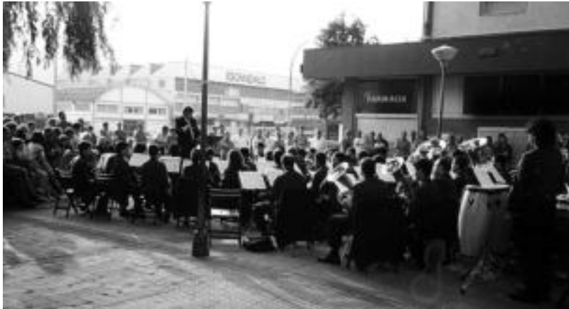
Tolosako Musika Bandak kontzertua eskainiko du larunbatean Abeslari Lagunak abesbatzarekin. HITZA

Antzerki Asteko azken antzezlanak eskainiko dute gaur haurrentzat: 'Ni arratoi'