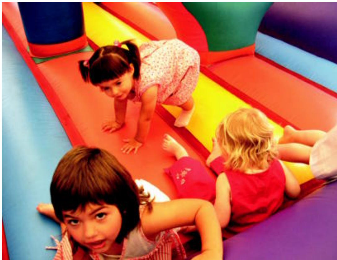
Txikienek ederki gozatu zuten atzo Asteasuko San Pedro Eguna: jolaserako eskaintza handia izan zuten. NOELIA LATABURU

Saharako 5 haur etorri dira uda pasatzera ▶ 7