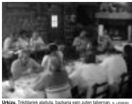
Urkizu. Trikilariek alaituta, bazkaria egin zuten tabernan.