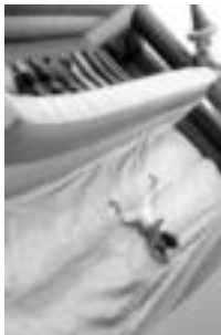
Asteasu. Umeeek primeran igaro zuten. K. LEBARU