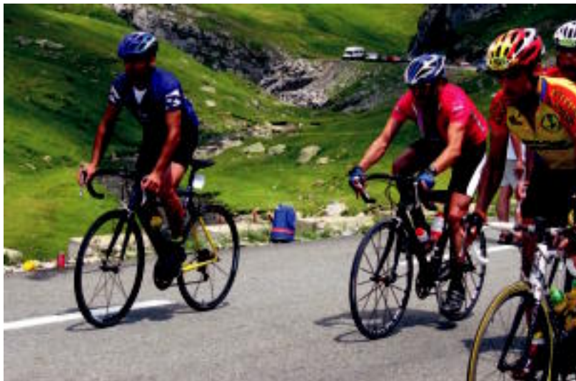
Ibartar askok ere (ezkerrean, mailot urdinarekin) hartu zuen parte proban; irudian, Portalet-en.