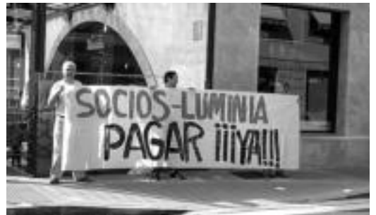
Luminiako langileek atzo egindako protestaldiaren une bat.