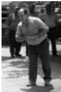
Leaburu. Toka bapeltzeko une bat. HITZA