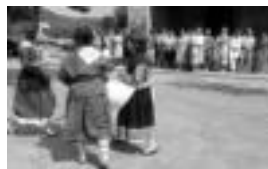
Leaburu. Mezaaren ostean dantzariak aritu ziren plazan. K. LEBARU

Urkizun, San Pedro Egunari kanpaleki eman zuten hasiera. Ohioko meza nagusiaren ondoren, hamaitzako egin zuten. Egurdi partean, bertze auzoko tabernan mahai inguruan bildu ziren bazkari legea egiteko, trikilariei eta bertsoariak alaituta. Igandea bitarte jarraituko dute herri hauetan festak. Izango da, beraz, ondo igarotzeko atxakirik gurean.