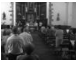
Leaburu. San Pedro patrioiaren omenez eginko meza nagusia. I. I.

San Pedro Eguna izan zuten atzo Asteasun, Leaburun eta Urkizun; hiruetan ere meza nagusiak, musika, kalejirak, haurrentzako jolasak eta herri kirolak izan ziren protagonista, besteak beste