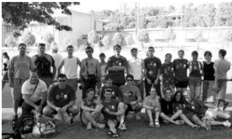
Tolosa CFko atletismo taldeko kirolariak eta entrenatzaileak, Donostian, Gipuzkoako Txapelketan.