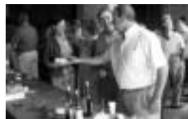
Asteasu. Hamaitzakoan bildu ziren elizatik irtezerakoan. I. TERRELLUS