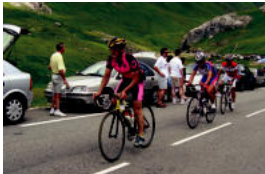
Marraskilo zikloturista taldeko (tropei buruan) kide asko izan ziren. L. M.