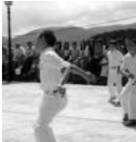
Asteasu. Gazteek pilota norgehiagoka jokatu zuten frontoian.

Asteasun, txistularien diadak esanarazi zituen herritarak, festen egun handiena izagarrri. San Pedro Eguna, hain zuzen, horien musikari meza nagusiak jarraitu zion Elizmendian auzotan. Amaitzerakoan, prest zuten herritarrek hamaitzako opariora, eliza atarian; eta horiek gutxi dastatzen zirela bitartean, herriko gazte-otoak pilota neurketak jokatu zituzten. Eguraldia lagun, norgehiagoka horiek ikusmiria handia sortu zuten goiko auzo-ara hurbildu zirengana. Bien bitartean, Asteasuko plazan bertan, haurrentzako zein gazte-otoak ederki asko igaro zuten goiza berarentzat prestatutako puzgarrari eta besteak haur-jokoekin. Arratsaldean ere izan zuten aukera jolasean aritzeko. Bestalde, herriko musikariek kaleak alaitzeko ardura izan zuten arratsaldean, herria barrena eginko kalejira. Musika eta dantza zuten Asteasun, izan ere, gasaldean, mezikar donuak nagusitu ziren, Mariachi Real Azteca taldearen eskutik.