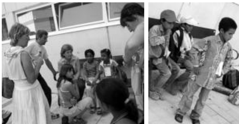
Nekatuta aillatu ziren. Hemengo familiak bertaratu ziren ahala, irrifartxoak ikusi ziren. JAIONE ASTIBIA

Beste behin ere, seigarren urtez, Saharako bost haur etorri dira kanpamenduetatik Leitzako familian uda igarotzera