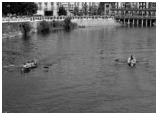
Sekulako giroa piztu du Tolosaldean arraun uholdeak. HITZA

KIROLA ▶ Arraun zaletasuna berpiztu eta indartu egin da azkenaldian. 17 batel ikusi ahal izan ziren aurreko igandean Orian eta gaur jokatuko dituzte finalak. Adin guztietako neska-mutilak ari dira. Ez Tolosan bakarrik. Ibarren hiru batel osatu dituzte. Gaur gosaria prestatu dute zaletuentzat. Gazteluk ere badu bere batela; onenetakoa, gainera.