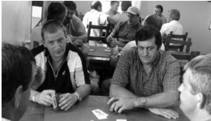
Muslariak fin aritu ziren jokoan, arerioaren enbiteei, hitzetik hortzera erantzunez. JAIONE ASTIBIA

Eguna bera astereguna izaki, atzokoan hasitako festetan giro ona eta herriko presoari oroimena ere egin diote