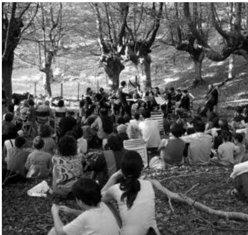
Emanaldi gogoangarria eskaini zuen Et Incarnatus orkestrak Iraola zuloko paraje ederrean.

Natura eta musika uztartu ditu Et Incarnatus hari orkestrak Urkizun, Iraolako zuloko, emandako solstizio kontzertuan