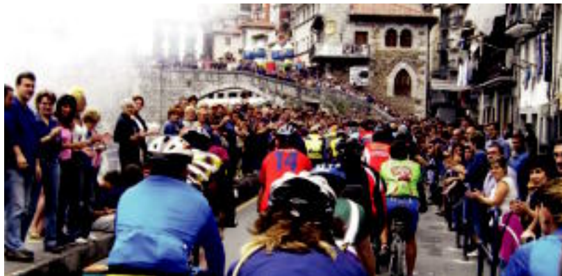
Goian, txirindulariak Tolosatik ateratzerakoan; behean, bizkaitarrekin batera Ondarrura iristen. A. ELDUAIEN