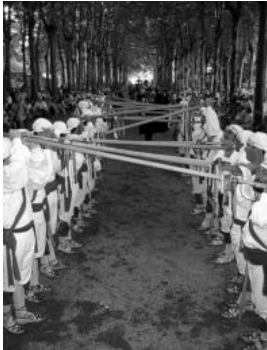
Bordondantzariak agintariei arkuak egiten Zumardi Handian. A. ELDUJAIN

San Joan zortzikoa dantzatuz. Egun osoan zehar entzun ahal izango da doinu hau behin eta berri. Apaizak, santuak darमतzaten kofradiak, kanpaijoleak erantsi behar zaizkie aipatutako guztiei.