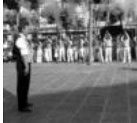
Eskopetariaren saioa Trianguloan arratsaldean. URTE MONTE

1980tik egiten da eskopetari konpainien Alardea, baina betidanik parte hartu izan dute eskopetariak egun berean horretan. XVII. mendetik 1876an galdutako arte egiten ziren zaindaria ren egunetan edo Korpus egunetan Gipuzkoako herrietan. Armatariak ez zegoenez, gerraren kasuan prest zeuden armak eta pertsonak zenbatzeko balio izaten zuten. Sanjoanen barruan, gara batean gotzako prozesioan eskopetari ziren pertsona berak bordon-dantzari ziren arratsaldean. Urte askotan konpainia bakarra izaten zen, 1979 bitarte. Gero elkarre modura hasi ziren ateratzen konpainiak eta Sukaldekoa da geiziduen den zaharrena. 1979tik ateratzen dena. Pixkanaka pixkanaka beste elkarre batzuk animatzen joan dira eta aurten ere izango da talde berri bat: Arco Iris-Ortzadar elkarteak. Arma bete, gora, begizta... su!