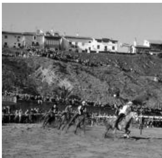
Getarian urtarrilaren 15ean izan zen zaldi lasterketa. HITZA

Puntuazioa honakoa izango da: lehenengo sailkatzen denak bost puntu lortuko ditu; bigarrenak, lau, hirugarrenak, hiru, laugarrenak, bostgarrenak eta seigarrenak bi eta zaz-