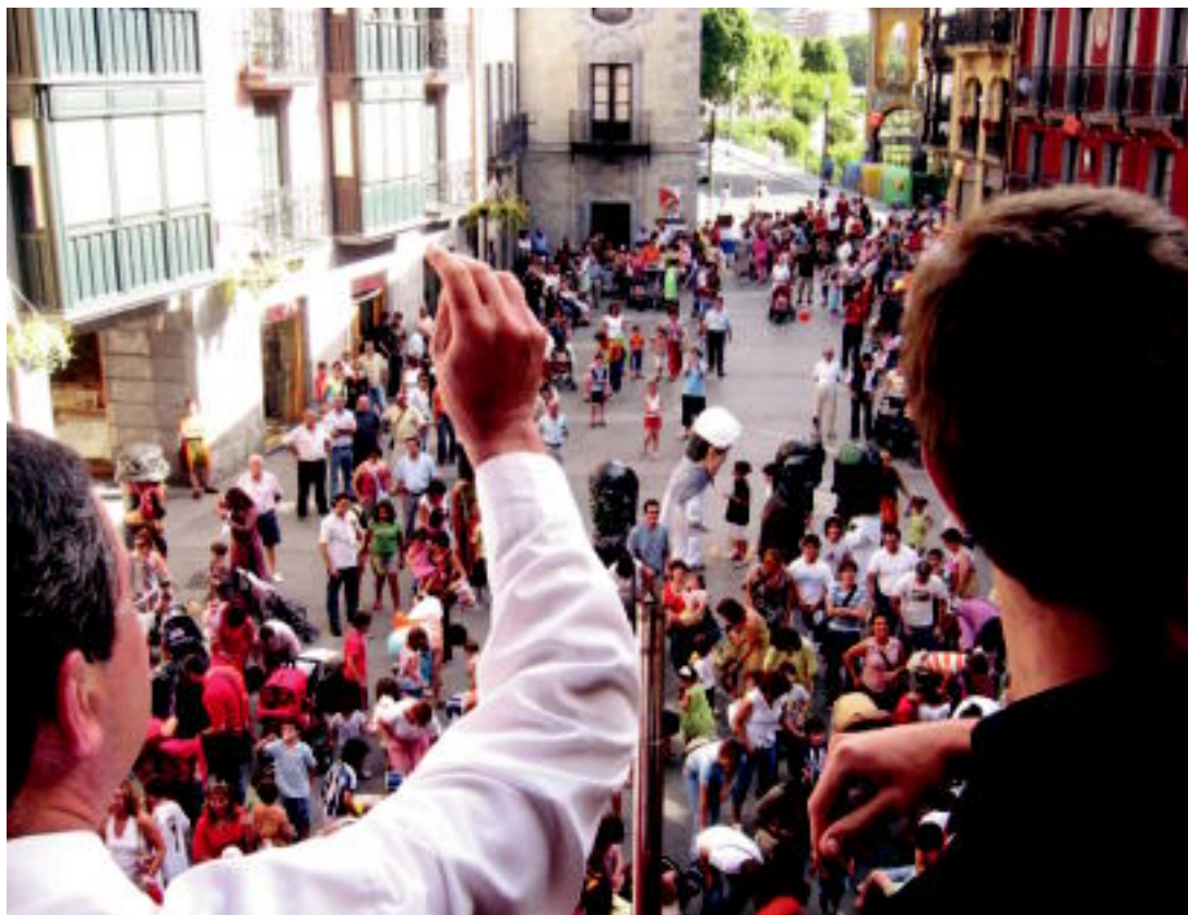
3. Mailara igo den Tolosa CFko ordezkariak eta udal ordezkariak izan ziren udaletxeko balkoian suziria botatzeko garaian. IRATXE ETXEBESTE

BANDAK ▶ Musika eta txistulari bandako zuzendariek «egun luzea» dela eta asko indartu dela diote ▶ 2-7