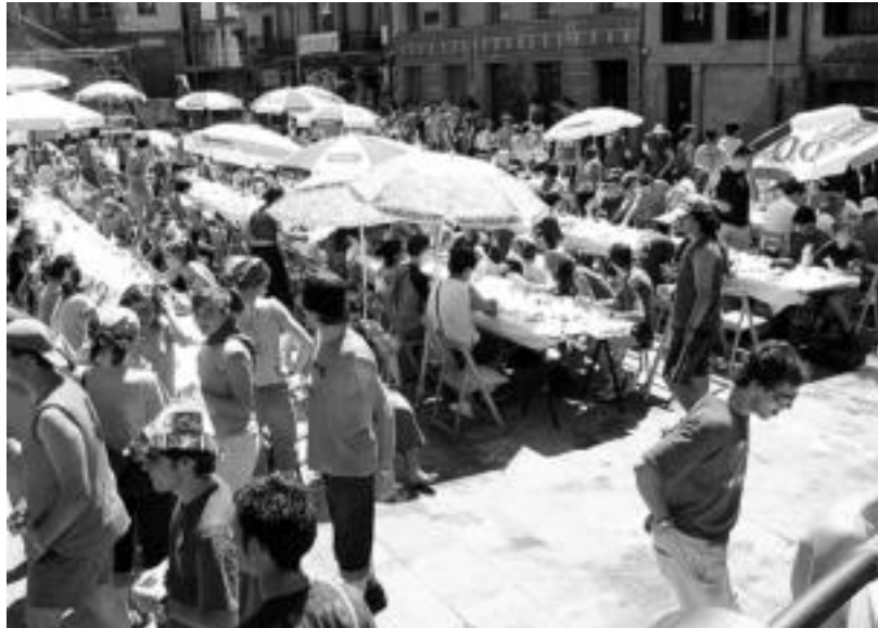
Hirurogehi koadrila inguru bilduko dira bihar bazkarian; argazkian, iaz egindako bazkaria. JAIONE ASTIBIA

eta Ekaitz ariko dira. Azken fasean, Goxua gozotegia taldeak bi partidutan penaltietara irabazi du. Hirugarren partida, berriz, erraz gainditu zuen 7-1 emaitzarekin. Aipatzekoa da talde hori iazko finala jokatu zuten bi taldeek osatu dutela. Ekaitz taldeak azken hiru partidak penaltietan irabazi ditu eta nahiko justu gainera. Emozioa behintzat ez zaio falta biharko finalari.