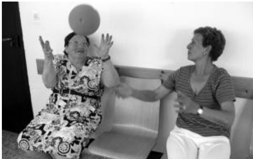
Gimnastika ikastaroan parte hartzen duten ikasle batzuk ariketa bat burutzen baloiarekin.

Asteazkenero 16:00etatik 17:00etara da Ugarte auzoko osasun zentroan; ostegunetan balioanitzeko gelan ordu berean