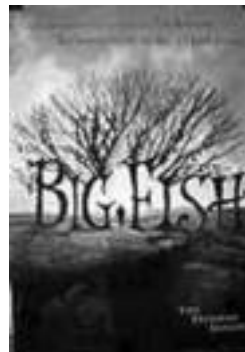
Big fish filmaren kartela.

Kritika onak jaso dituen film luze estatubatuar honen antzezle nagusiak Ewan McGregor, Albert Finney, Billy Crudup eta Jessica Lange dira. Kontatzen den istorioa, berriz, ondokoa da: Edwar Bloom irudimen handiko gizasemea izan zen: bere bizitzari buruzko istorio harrigarriak kontatzen zituen, eta inguruan zituen guztiak txunditzen zituen haiekin. Bestalde, Bloom-en kontakizun horiek guztiak