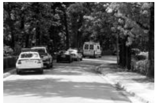
Miramonen aurkitu dute Apaolazaren gorpua.

Donostiako Miramon auzoan topatu zuten atzo arratsaldean, bularrean tiro bat zuela