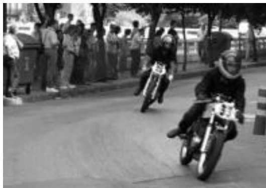
Jendetza bildu zen atzo kalean motorrak-eta ikusteko. I.TERRADILLOS

Bestalde, atzo bezala, gaur ere egun osoan zehar Ferialekuan ikusgai egongo direnez, haiez gozatu ahalko da. Izan ere, 1940ko Cadillac La Salle, Rolls Royce, Bugatti, 1961eko Ford Thunderbird Cabriolet, Chevrolet Doble Phaeton... bezalakoak ikusteaz gain, motor