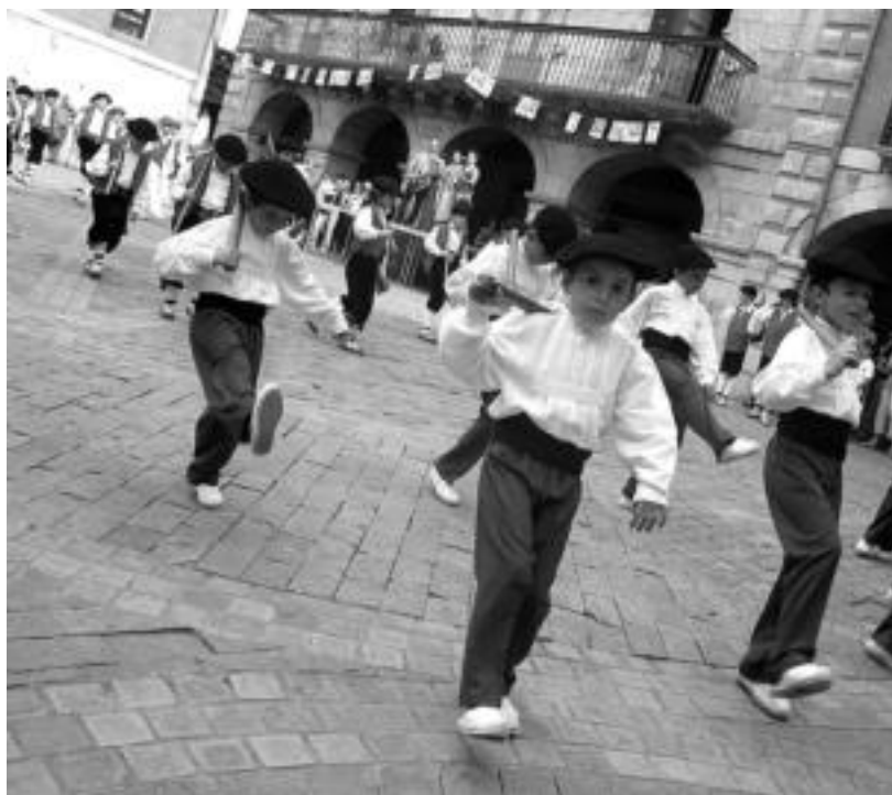
Haur ugari bildu ziren atzo arratsaldean Alegian Haur Dantzarien I. Topaketa ospatzeko. I. TERRADILLOS

egoera horri irtenbidea ematekotan egin nahi izan dutela ekimen hori lehendabizikoz. Bada aurrerantzean zer gertatuko den esaterik ez dago, baina atzokoan euskal dantzei indarra ematea lortu zutenik ezin da ukatu. Alegian bertan, Beasainen, Behobian, Irunen, Donostian edota Usurbilen ikasitakoak ederki erakutsi zituzten haurrek jendaurrean, norberak bere erara, eta topaketari elkarrekin eman zioten bukaera, gainera: guztiek batera, dantza eginez.