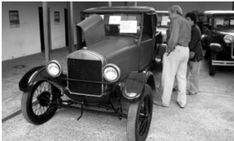
Auto klasikoen eta antigoalekoen aukera handia da ikusgai Ferialekuan; motoak ere badaude. I.TERRADILLOS

Karts eta motoak aritu ziren atzo Tolosako kaleetan; gaur amaituko da ibilgailu klasikoen eta produktuen erakusketa