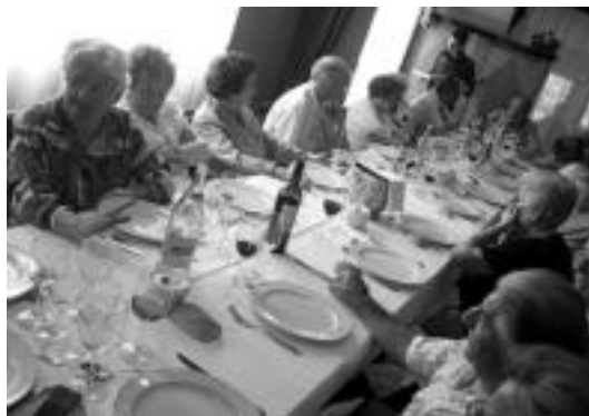
Omenaldia egiteko, Fronton kafetegian bildu ziren. I. TERRADILLOS

bazkari aparta egin ahal izan zuten ondoren, eta Iribarren taldekoek alaitu zuten bazkalostearen bertako giroa. Omenduek pozarren jaso zituzten jaira hurbildutako zozorion agurrak, eta, 88 urte bete-ta edo betetzear dituztenean, «zoriontsu» sentitzen direla esan zuten. Bejondeiala!