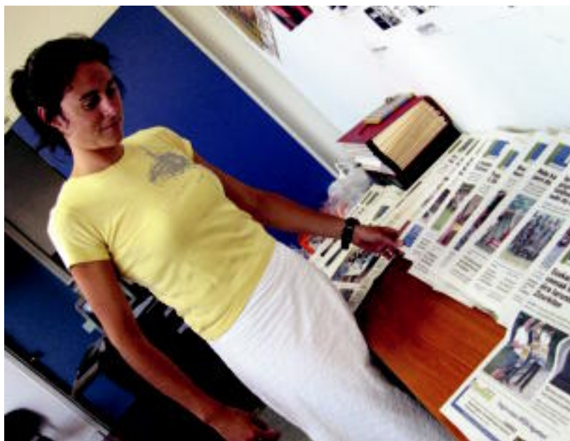
Hitzaren egoitzan aritu zen Edurne Pasaban mendizalea tolosarra erronka berriei buruz hizketan.

ZORTZIMILAKOAK ▶ Bi gailurren bila abiatu da: Nanga Parbat (8.125 m.) eta Broad Peak (8.047m.) OPORRAK ▶ Bizikletaz, Mongoliatik Pekinera joango da bi saiakera berri horien ostean ▶ 4-5