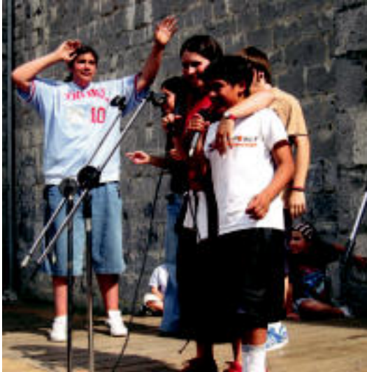
Ondo pasatu zuten atzo haurrek eta gaztetxoek herrian. I. TERRADILLOS

N ork uste du eskualdeko haurrek eta gaztetxoek ezin dutela herritik atera gabe ondo pasatu? Txikienekin bete-beteta egoten dira egunero haur parkeak —Foruen etorbideko berria da, ziu-rrenik, jende gehien erakar-tzen duena—, eta zaharragoek ere bilatzen dute astero-astero lagunekin elkartzeko lekua. Duela hilabete batzuetatik hona Topalekura joateko aukera dute horiek, gainera. Topalekua bideratzen duten Gazte Guneak eta Tolosako Udaleko Gazteria sailak, bada, Pako Eguna antolatzen zuten atzoko. Orokorrean bertara joaten diren 13 eta 17 urte-tarteko gaztetxoentzat baka-rrik ez; haurrentzat ere bai. Eki-