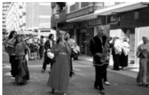
Bouhiak Basauriko kaleetan eskainitako emanaldi bat. HITZA