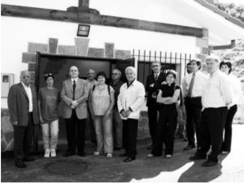
Foru Aldundiko, Udaleko, Ur Kontsorzioko eta enpresako ordezkariak ur biltegi berriaren aurrean. HITZA

Bost hilabetetan egin dute eta 317.000 euro kostatu da lana