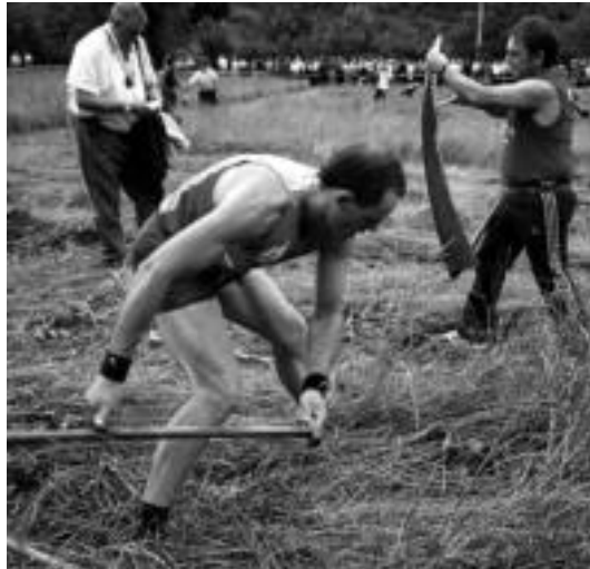
Urki orendaindarrak bost urte daramatza segan lehiatzen. HITZA

Sega kanporaketa dela-eta, Orendaingo Udaletik jakinarazi