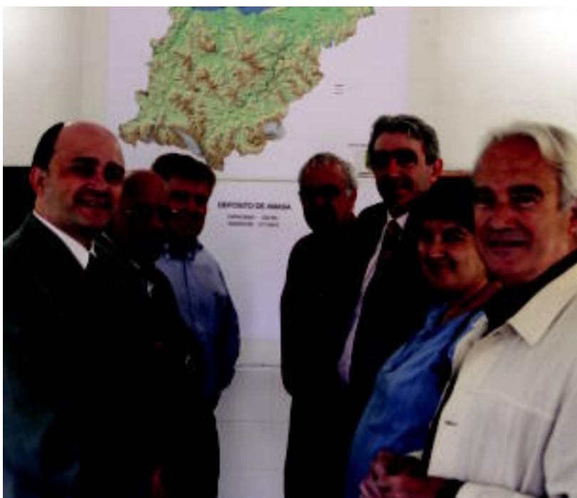
Aldundia, Udala, Ur Kontsorzioa eta enpresako ordezkariak atzo inauguratutako ur biltegi berria. HITZA

LANA ▶ Bost hilabetetan burutu dute lana eta 317.000 euro kostatu da lana; urte bukaeran, Villabonakoa ▶ 4