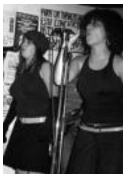
Foralettes taldekoek etzi eskainiko dute emanaldia. HITZA

Hilaren 17an Arrasateko gazte-txean joko dute, Brigada Criminal-ekin, eta 18an Durangoko Plateruenan, Zea Mays taldearekin. Foralettes taldeak itxiko du, etzi, Bonbereneako musika denboraldia. Laster arte.