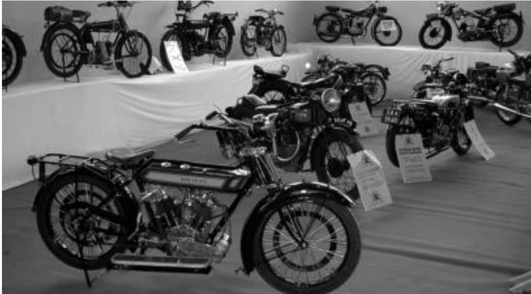
Ibilgailu Klasikoen XI. Nazioarteko erakusketa larunbatean eta igandean izango da, Ferialekuan; ekimen ugari antolatu dituzte. U. URREAGA

Asteburuan egingo dute Ibilgailu Klasikoen XI. Nazioarteko Erakusketa; besteak beste, motor produktuen azoka eta lehiaketako karts-en erakustaldia izango dira