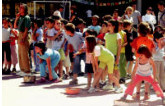
Laskorain Ikastolako jokuek jende asko bildu zuten Usabalen. HITZA

▶ HITZAK ez du bere gain hartzen egunkarian adierazitako esanen eta iritzien erantzukizunik.