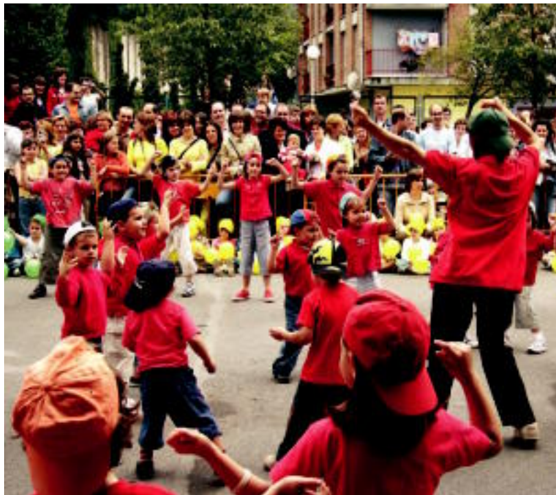
Jesusen Bihotza ikastolako ikasleek bere dantza emanaldia eskaini zuten larunbatean.