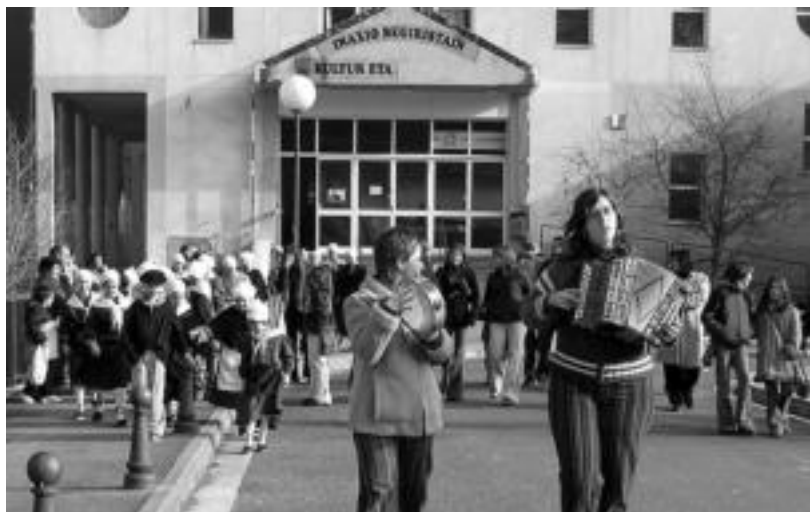
Haur dantzariak Alegian eskaini zuten azken emanaldian, iragan abenduko Eguberri egunean. O. ESKITSABEL