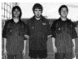
Peiremans+ hirukotea. HITZA