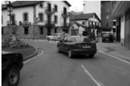
Herrigunea oinezkoentzat jarri nahi du Udalak. I. GARCIA

kaintza udalerriko bertako biztanleek, aurreikuspen guztien arabera, egingo duten eskaria aintzat hartuz eginda dago. Aurreikusita dauden etxebizitzak asko babes ofizialekoak eta tasatuak izango dira.