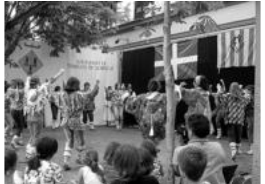
Irurako dantzari- rik egindako emanaldiaren une bat.