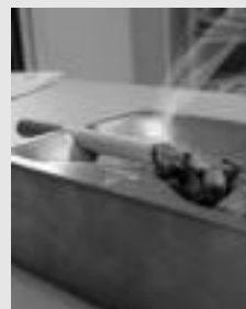
Asko erretzen da lantokietan.

Inketa. Zer iruditzen zaizu lantokietan erretzea debekatzea? Eta, bikote homosexualak ezkondu edota adoptatzeko eskubidea izatea?