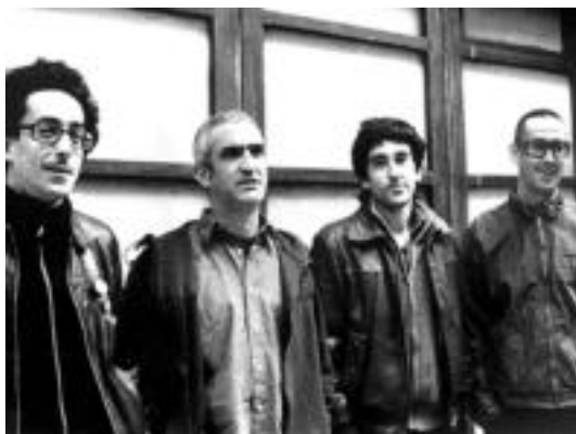
Inoren ero ni laukotea; bihar joko dute.