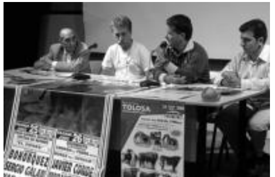
Udala eta enpresako ordezkariak herenegungo aurkezpenean.

Bukatzeko, 26koa izango da zezenketa nagusia. Javier Conde eta Jose Antonio Morante de la Puebla toreatzaileak eta Cayetano Rivera Ordoñez nobleiroa Nuñez del Cuvillo ganadu