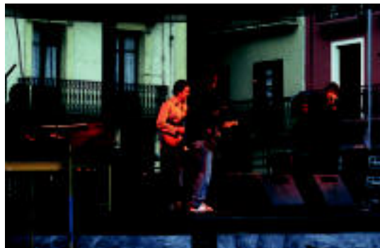
Maila handia erakutsi zuen The Blues Blaster'sek plaza Berrian.