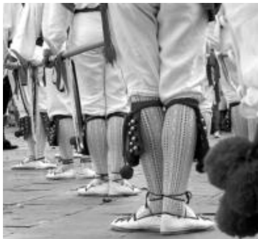
Hilaren 18an hasiko dira sanjoanak eta 26an bukatuko. L. MONTES

Izaskun Arriola. Izaskun Arriola dantza taldeak ikuskizuna eskainiko du hilaren 15ean, as-