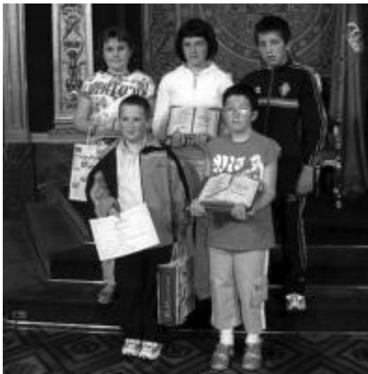
Erletako ikasleak, sariak eskutan zituztela, ostiralean.