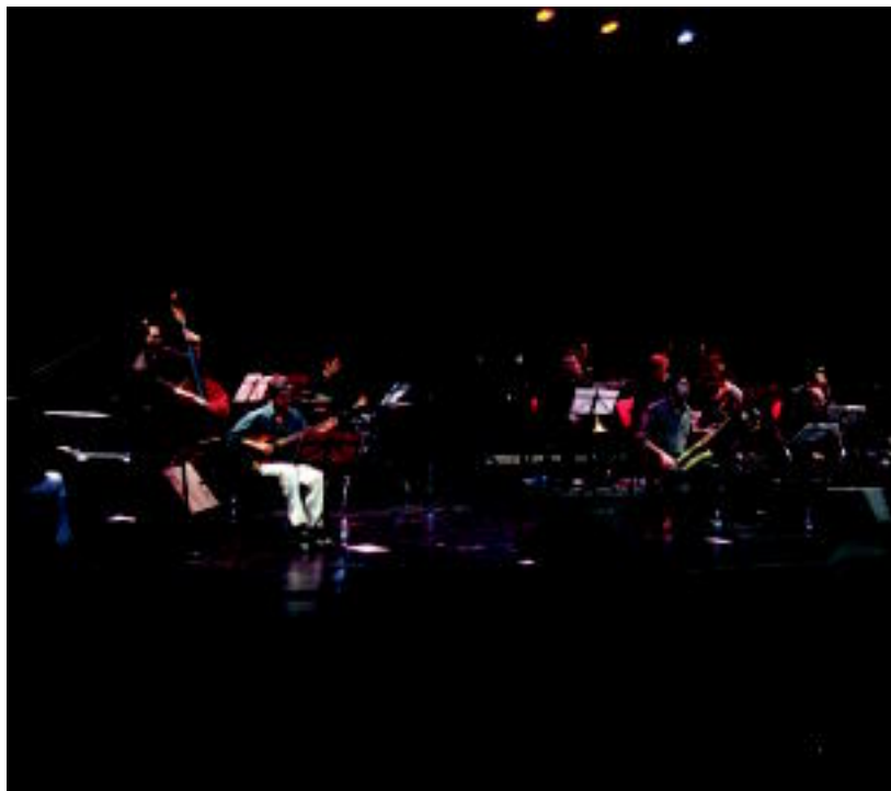
Pyreneos jazz orkestra Leidor zineman aritu zen bere emanaldia eskaintzen. JOXEMI SAIZAR

TOLOSA ▶ «Kalitate handiko» musika taldeekin «gustura» agertu da antolaketa, «ez hainbeste jendearen erantzunarekin», batez ere plaza Berriko saioetan