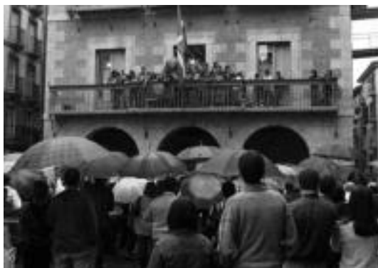
Tolosako jokalaria, udaletxeko balkoian, herritarren aurrean. J. SAIZAR