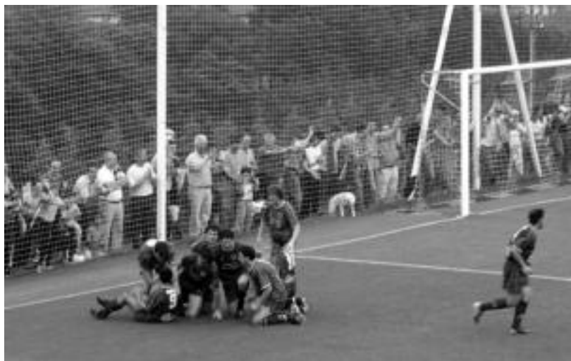
Tolosa CF-k jokalariek, herenegun, Zubietan, EHU-UPVren aurkako lehen gola ospatzen. ASIER ETXANIZ

«Buruari genuen igo egingo ginela. Jokalarien portaera zoragarria izan da; dena eman dute», esanez egin diote entrenatzaileek Hirtzari igandekoaren laburpena. Tentsio handiko partidua izan zen, haien hitzetan, Zubietakoa. Are gehiago 24. minutuan banako berdinketa heldu zenean. Hala ere, «beldurrez baino, zuhurtziaz» aritu zirela azaldu dute Luluagak eta Mendizabalek. «Denboraldi gogorra izan da hau