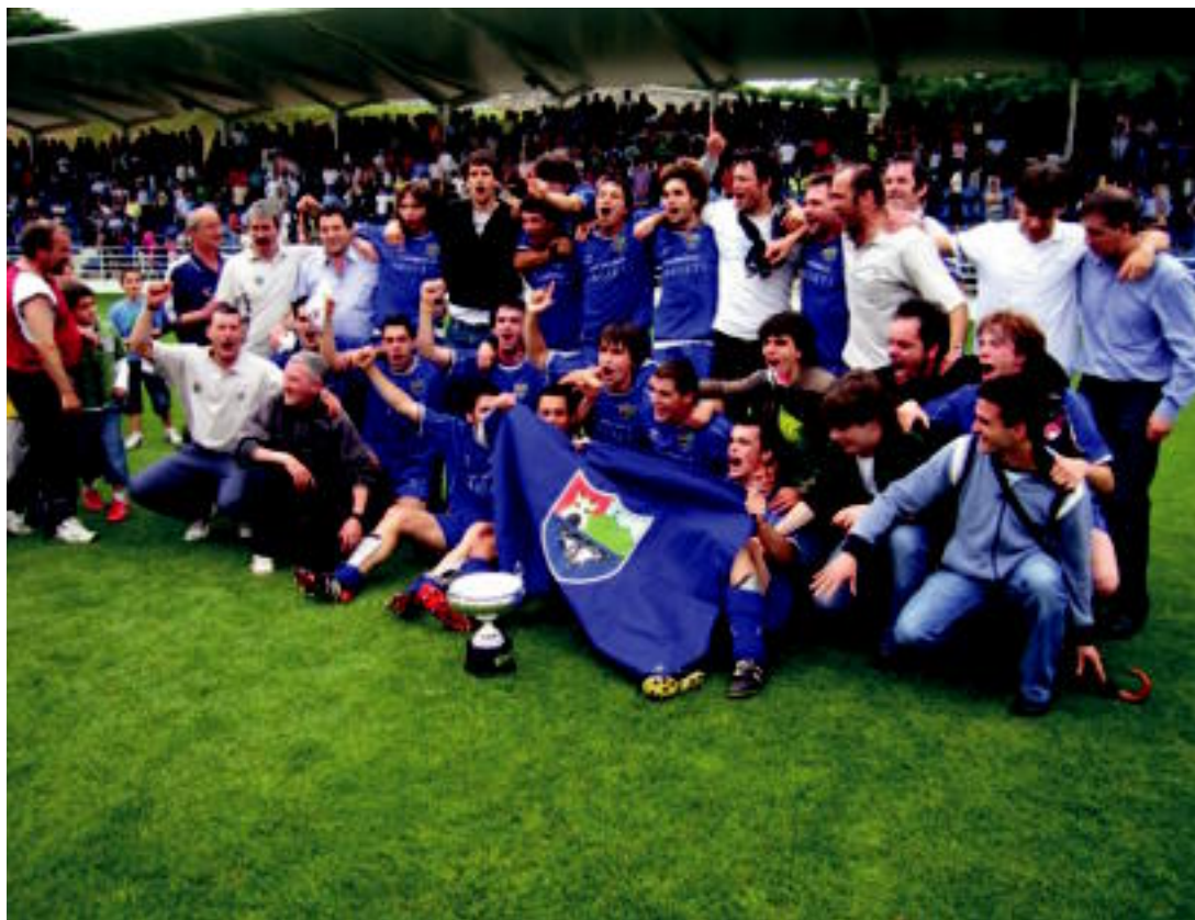
Jokalariak, entretzaileak eta zuzendaritzako kideak Zubietan igandean, EHU-UPVri 1-2 irabazi ondoren.

HARRERA ▶ Udalak eta herri osoak harrera beroa egin zien igande iluntzean ▶ 2,3