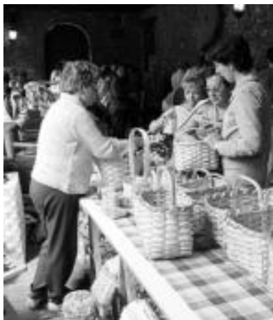
Saskigintza. Gaztainondo-zumitzekin egindakoak, tamaina, itxura eta erabilpen askotako saskiak izan ziren, igandean gehien saldu zirenak: egurra etxeratzeko, ontto biltzeko, apaingarri gisa... J. A.