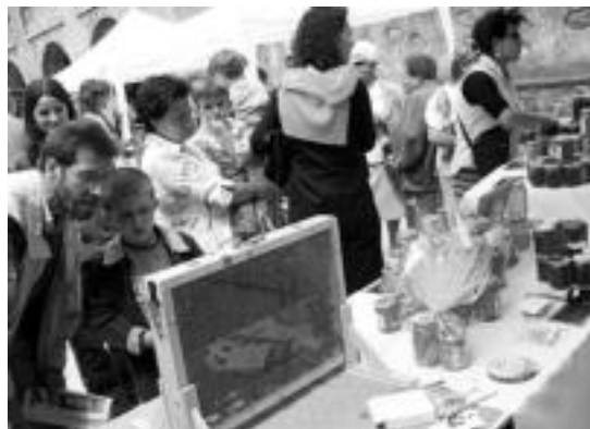
Erlezaintza. Azkaindik etorri zen, 200 erlauntz inguru dituen erlezaina, ezti mota askorekin. Egun guztian zehar hainbat azalpen eman zituen. Atentzio handiena, agian, erakusgarritako jarrita zuen erle-abaraskak eragin zuen bisitarien artean. J. ASTIBIA