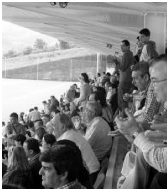
Tolosako 1.400 bat zaletu izan ziren Zubietan. ASIER ETXANIZ

«Segurtasuna bermatze aldera, eta Euskal Bizikleta inolako arazorik gabe Tolosara iritsi dadin, erdialdera sartu nahi duten gidari guztiak autobiatu, Usabaleko eta Benta Haundiko irteerak erabiltzea gomendatzen diegu», adierazi dute udaltzainek.