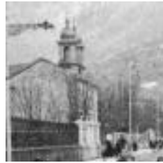
Elizan, antzina. 'ARGAZKIAK TOLOSA'

1888. Urriaren 12an zabaldu zuten San Jose ikastetxea.