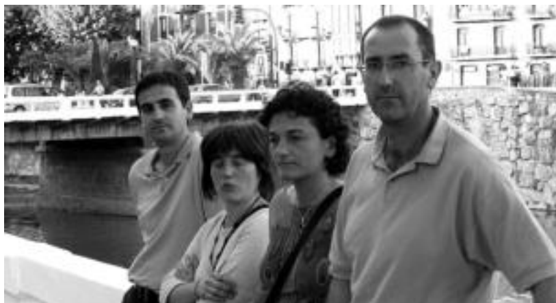
Bai Euskarari Akordioa Tolosaldean taldeko kideak, herenegun, bilerarako deia egiteko agerraldian.