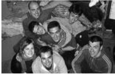
Trapatoni Circus Band taldea. HITZA

Musika da, festa orotan, ezinbesteko osagaia. Aurten ere, bai Jai Ofizialeko egitarauan eta baita Herri Borondatearen Aldeko Jaietan ere, kontzertu sorta itzela dago entzungai.