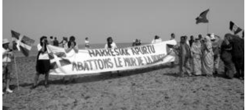
Ikurrinak zeramatzen euskaldunak ere batu ziren Saharakoei eta beste lurraldeetakoiei. HITZA

«Sahara iritsi eta bigarren egunean abiatu ginen harresi-rantza», azaltzen du leaburuarra; «Aldarrikapenerako uneak bizi izan genituen han: sahararrak soinean futbol jantziekin selekzio bat exijituz, NBERen aurkako oihuak, erreferenduma egiteko eskatuz...». Saharako Frente Polisarioko