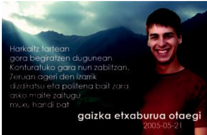
Mila esker Gaizkaren agurrera etorri zineten guztioi.

Urtebetetzea, agurrak... hemen argitaratzeko etorri HITZAREN egoitzara; ekarri argazkia