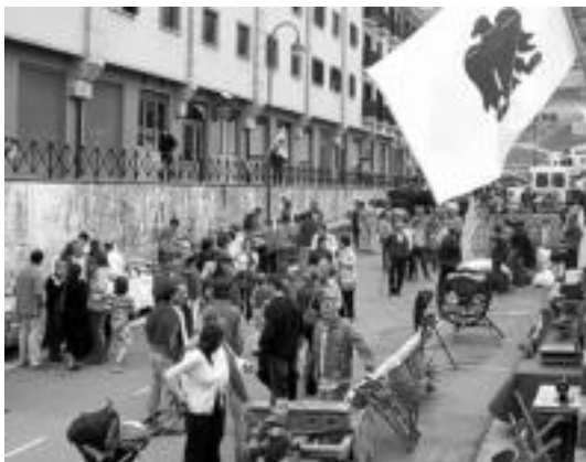
AHTren aurkako azoka, pasa den igandean. AHT GELDITU! ELKARLANEAN

Elkartekideek sinadurak bildu zituzten AHT-ren aurka.