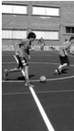
Aurreko asteburuko partida. N. L.

Xantoxen omenez antolatutako txapelketan norgehiagoka gehiago daude asteburu honetan Alegian: 15:00etan, Txurtzil Ospelaren aurka (arbitroak Aston Bila); 16:00etan, Aston Bila-Budweiser (arbitroak Uau Roberto); 17:00etan Etxale Kuyons-Kokox klan (arbitroak Uau Roberto); eta 18:00etan Uau Roberto-L (arbitro lanetan Aston Bila).