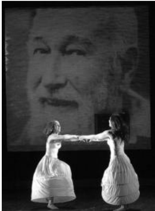
Bi dantzari, Oteitzaren irudia atzean, emanaldiaren une batean.