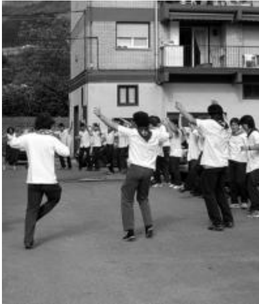
Gazteen Eguneko dantza saioa, iaz. GARAZI AZKUE

Kalejira, afaria eta dantza erakustaldia: gazteen eguna iritsi da Anoetara