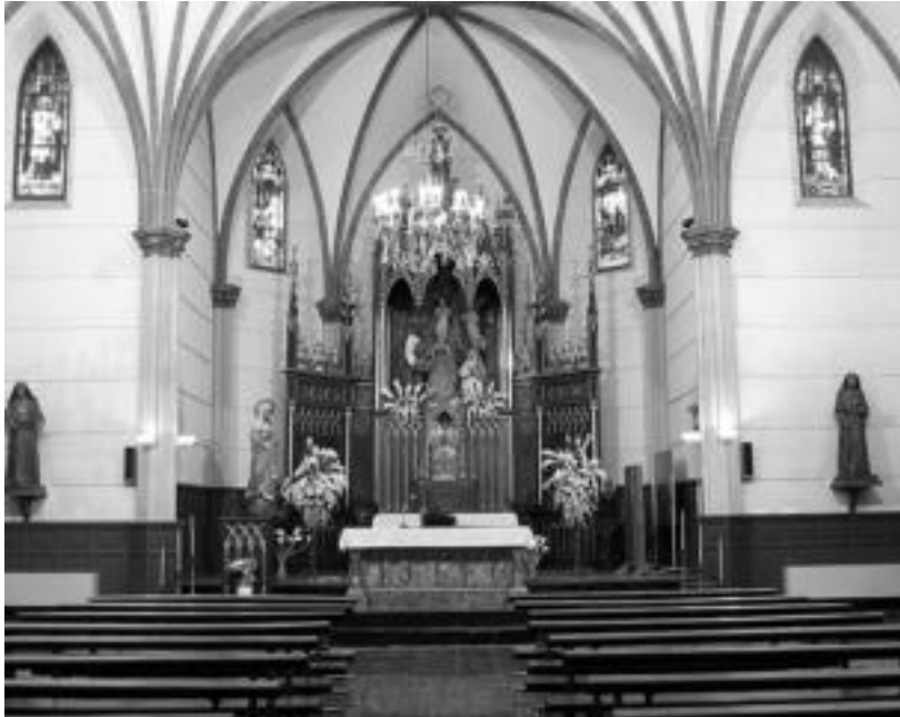
San Jose ikastetxeari itsasia dago Jesusen Alaben eliza; gaur meza berezia ospatuko dute bertan. L. MONTES

Jesusen Alaben elizak 100 urte beteko ditu astelehenean; «herriar guztientzako meza bereziarekin» ospatuko dute gaur