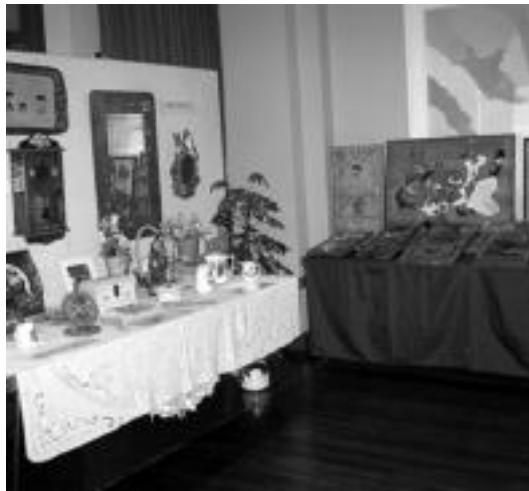
Asteburu honetan ere irekita egongo da erakusketa. GARAZI AZKUE

Pirograbatuak, oleoak edo argazkiak ikusteko aukera dute anoetarrek herritarrei eskainitako erakusketan