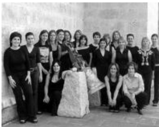
Ondarroako Unanue Kamara Koraleko partaideak.