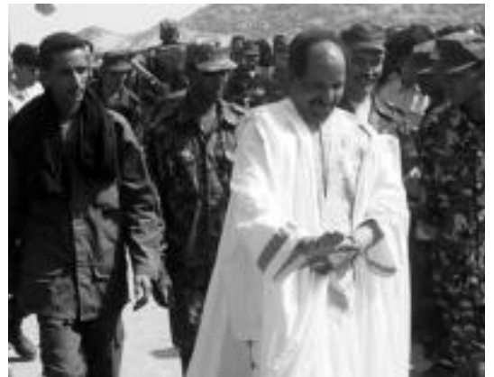
Mohamed Abdelaziz, Frente Polisarioko idazkari nagusia.

Saharatik kanporatuak izan zirela 32 urte igaro berri dira aurreko asteburua; hala ere, beraien lurretara bueltatuko direnaren esperantza eta indarra mantenduko dute.