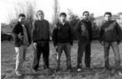
Silikonay taldea. SILIKONAY

Aste osoan izan dira musika emanaldiak jaietan; gaur berriz, Stupenda Jones, Silikonay, Izeba Pilarren Ilobak eta Trapatoni Circus Band taldeak izango dira