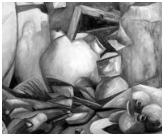
Bi kulturen artean izenekoa ikus daiteke pintura erakusketan. I.T.