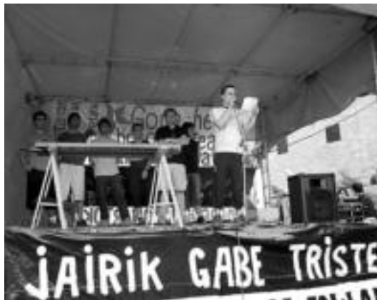
Festa alternatiboetako pregoia, txupinazoaren aurretik. I. GARCIA