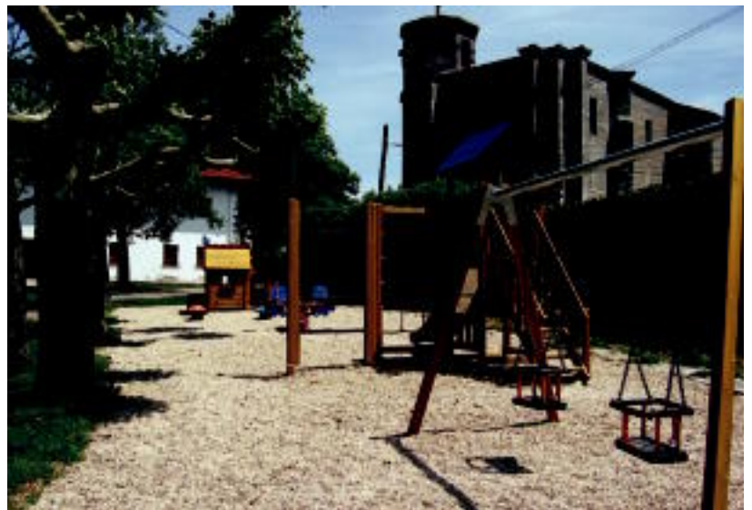
Amasa. Elizatik eta plazatik gertu, zuhaitz batzuen ondoan dago kokatuta jolasparkea. IMANOL GARCIA