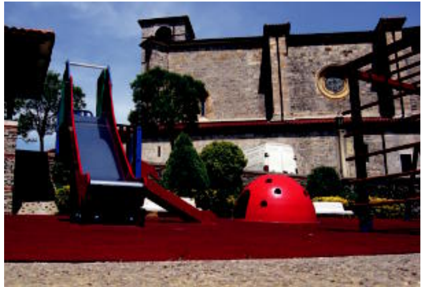
Alkiza. Elizaren ondoan, alkate zenaren omenezko eskulturaren ondoan jarri dute parke berria. IMANOL GARCIA

Bi herri horietako txikienek badute non ibili eta jolastu hemendik aurreko aisialdi tertetan: orain eskolatik atera ondoren edo sartu aurretik, eta laster, oporrak hartzen dituztenean San Joan aurretik, goiz eta arratsaldez, eguraldiak laguntzen badu behintzat. Eta haien ondoan, gurasoak, aitona-amonak, zaintzaileak... begira.