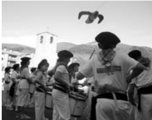
Kukuaren jaitsierarekin bat haurrek danborrak astindu zituzten. I. G.

Herri borondantearen aldeko festek ere bere txupinazoa izan zuten atzo arratsaldean. Txosnagunean egin zen, baina lehenengo txalapartarien saioa izan zen. Ondoren pregoia irakurri zen, «PNV-EARI herriaren borondatea errespetatzeko» eskatuz. Txupinazoa eta gero pankartak eskuan ziztuztela plazara inguratu ziren eta bertan kontzentrazioa egin zuten PNV-EA bi urte anoetarren eskubideak urratzen. Aski da lelopean.