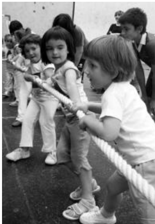
Gaztekoen helduen laguntza izan zuten proba guztietan. N. LATABURU

Oraindik balorazioekin has-teko goiz bada ere, orain arteko emaitzen balorazio «positiboak» egiten dute antolatzailerik.