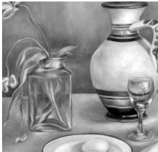
Tulipa lehorrak izena du Puerto Iglesiasen lan honek. I.TERRADILLOS