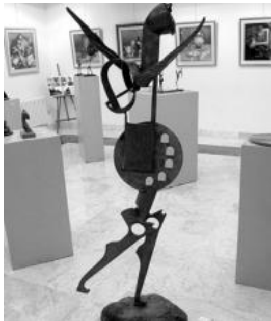
Mari da Manuel Iglesiasen eskultura honen izenburua. I.TERRADILLOS