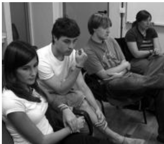
Aisialdi taldeetako begiraleak Pako Eguna aurkezten. N. LATABURU