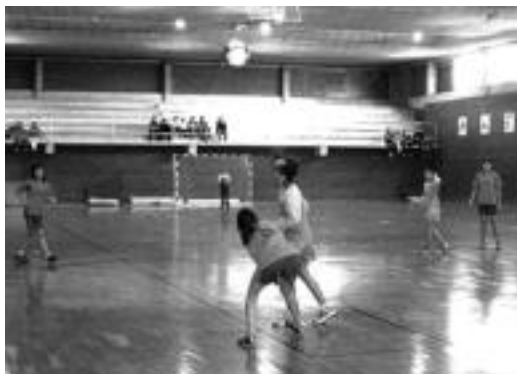
Jokalari gazteak, lehiari, Berazubini, artxiboko irudi batean.

Ekainaren 14a arte eman daiteke izena, Shanti Kirolak-en; Arsenal-ek antolatu du