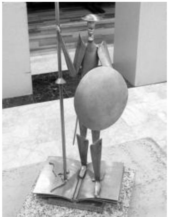
Kixoteak ere bere lekua du eskultura erakusketan. I.TERRADILLOS