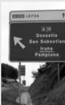
A-15 autobia. M. SOROA

Eztabaida. Orain hamar urte ireki zen A-15 autobia. Izan du eraginik zure eguneroko bizian? Tolosaldearentzat eta Leitzaldearentzat onuragarria ala kaltegarria izan da?