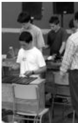
lazio saioan, ekinean. J. A.

bilakatu diren kontzertu erraldoiotan: guztira 519 ikasle ari dira parte hartzen, proiektuan. Eta, noski, hauen musika irakasleak, sei, dira «orkestra erraldoi» horren zuzendari aritzen direnak. «Leku faltagatik», ez omen dira denak batera aritzen, baina hala ere musikari franko biltzen dira lanera. Eta mota guztietako tresnekin, noski. Beraz, entzuteko ez ezik, ikustekoa ere izanen da emandakoa.