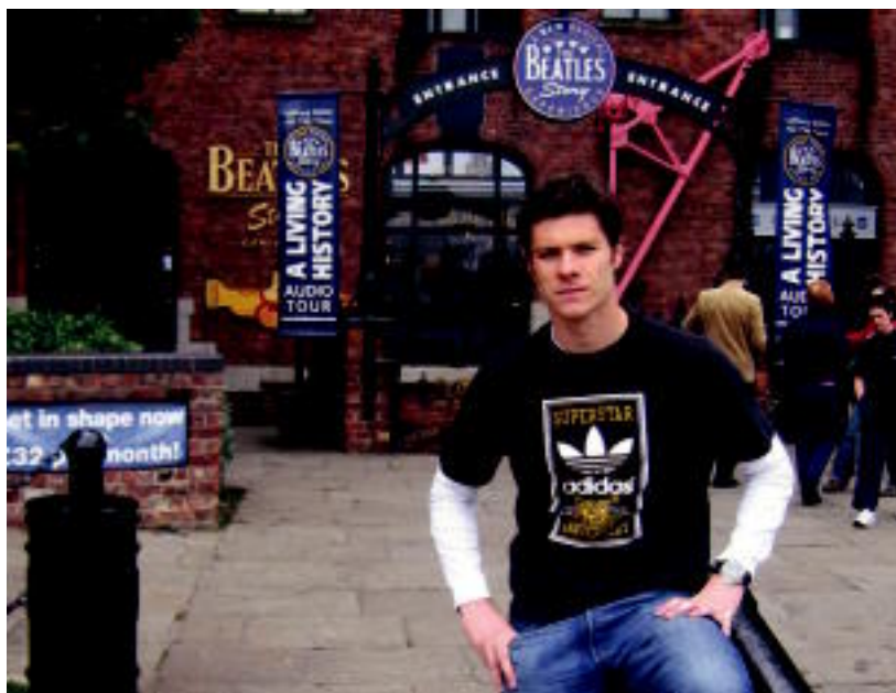
Xabi Alonso Liverpoolen, The Beatles-en museoaren aurrean, aingura baten gainean.

POZIK ▶ Tolosarra pozik dago abuztutik hona Ingalaterran egindako lanarekin ▶ 2-3