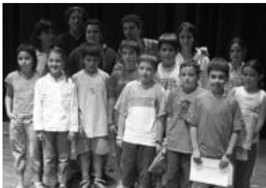
Lehen Hezuntzan sariak lortu zituzten neska-mutilak.