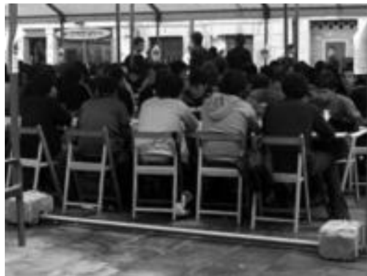
Joan den urteko festako herri bazkaria, Plaza Berrian. GARAZI AZKUE