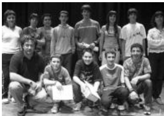
DBH mailan sariak lortu zituztenak. I. GARCIA