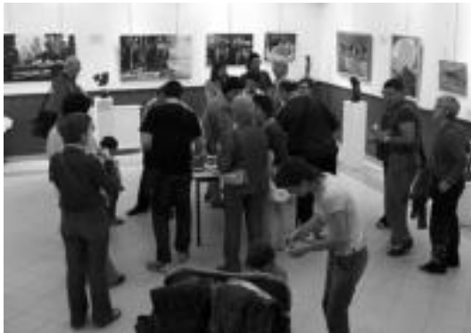
Inaugurazio ekitaldia egin zen astelehen arratsaldean. I. GARCIA

Maiatza Saltsan kultur egitarauaren baitan, bigarren arte erakusketa zabaldu dute Atxulondon kultur etxean. Lehenengo Nafarroa Oinezen erakusketa bazen, artista ezagunak utzitako obrek in osatua, oraingoan eskualdeko artisten lanak ikusi ahalko dira. «Maiatza Saltsanen helburua kultura guztiengana heleraztea da eta horregatik ikusi genuen egozia eskualdeko artistek beraien lanak erakustea», azaldu dio Ainhoa Larrea kultur tekni-