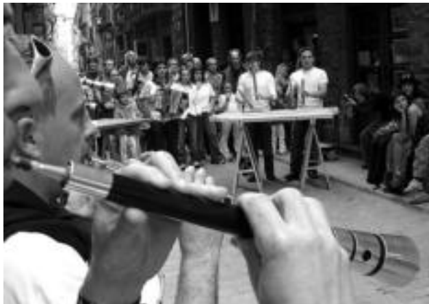
Baiona eta Lutxanatik etorri ziren gaita edo dultzaina jotzera; txalapartari eta trikitilariak, berriz, Ibarra eta Anoetatik. JAIONE ASTIBIA