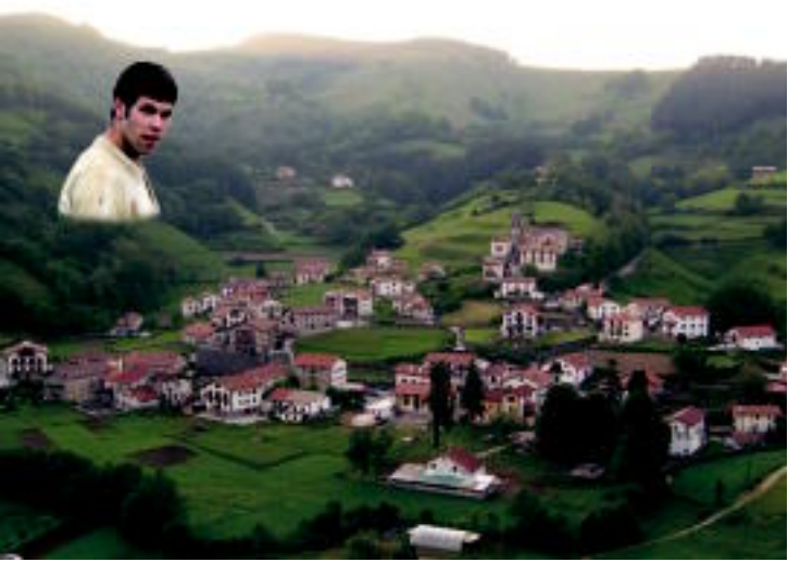
Bihotzean min dut, min etsia / negar ixilla danon mina / Lagunbo bat nun: gaur, / etorri-garaiez, aldegin./ «Agur (oihuka dio) / gorputza ximur maitel / Agur, lagunboa! / Egun haundi arte!» Zue launek.

Urtebetetzea, jaiotza, ezkontza, jaunartzea, urrezko etzeiak, agurrak... hemen argitaratzeko etorri HITZAren egoitzara; ekarri argazkia