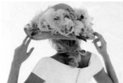
Soineko soilak eta itsura informala aukeratzen dituzte neskek. HITZA

Makillajea suabea izaten da orokorrean. Gainera, emaztegaiak beltzaranak etortzen dira jada. Manikurari dagokionez, frantsesa egiten da gehien. ◀