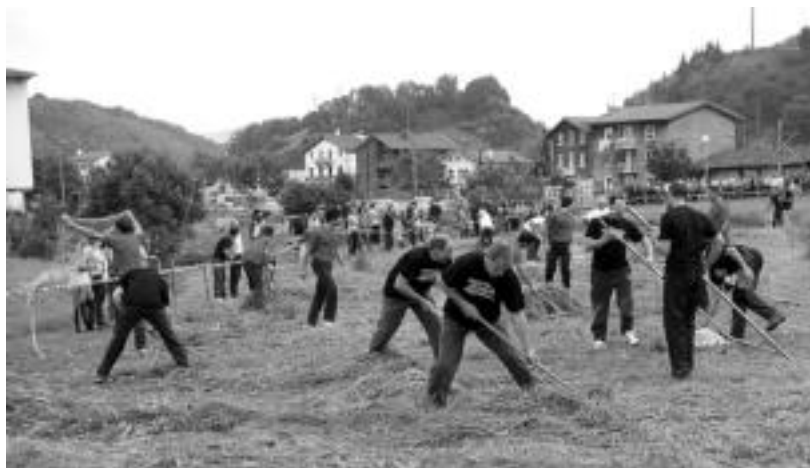
Sega apustua. Herritar zein kanpotar ugari bildu ziren atzo Herri borondatearen aldeko jaien egitarauaren baitan antolatutako sega apustuan. Hiru bikote lehiatu ziren; Igorrek eta Aitzolek irabazi zuten. Belarra jasotzen, pisatzen... ere laguntzaile ugari aritu ziren. O.ESKITXABEL

Gaurko beste hainbat ekitaldi antolatu dituzte.