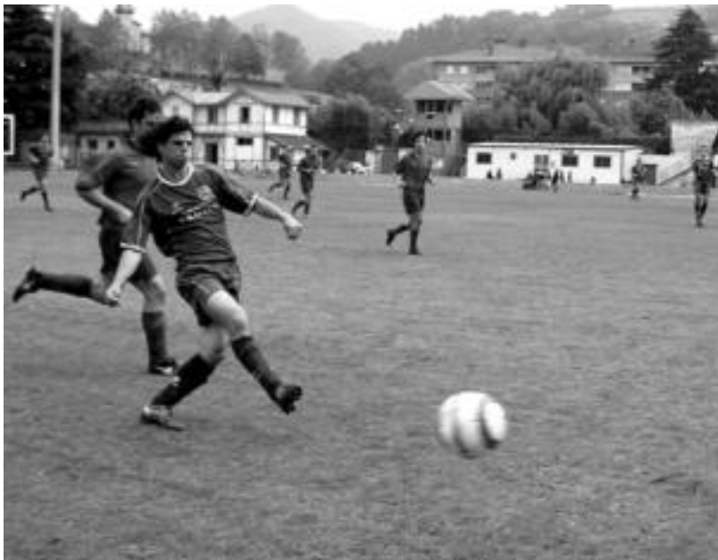
Partida ona burutu arren ez zuen garaipena lortzerik izan talde urdinak atzo Berazubín. N. LATABURU

Lehen zatian erasoan aritu ziren uneoro eta bi aukera garbi izan zituzten bisitarien atea zulatzen. Jokalari bat gehiagoz aritu ziren, gainera, urdina lehen zatia amaieratik, Anaitasuna taldeko Gonzalez aurrelariak bi txartel hori ikusi baitzituen, bi sarrera gogorren ondorioz. Bigarren zatian, aldiz, urduriago atera ziren jokalariek. Orduan burutu zen etxeko lehen aldaketa eta Regillaga sartu zen Artolaren orde. Askotan gerturatu ziren aurkariaren ate ingurura, hegaleatik zein erditik. Bigarren zati honetan bost txartel hori ikusi zituzten Anaitasunakoek. Ekaitz, Gorka, Aierbe eta Blan-