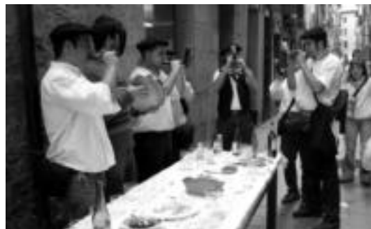
Barakaldoko albokariak mahi inguruan, jo ta su. JAIONE ASTIBIA

19:00. Haizearen orrazia haize boskotearen kontzertua, Musika Eskolan.