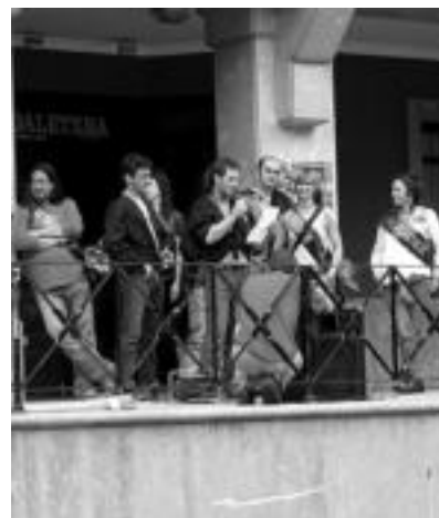
Koadrilen Eguna. Iazko jolasak irabazitako koadrilen pregoiaren ondoren, Koadrila Egunari hasiera emateko txupinazioa jaurtiki zuten. O.E.