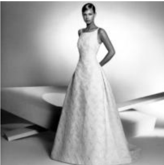
Emaztegiaren soinekoa da guztek ikusi nahi duten ezkontzako sekretua. »172

Udaberriarekin batera datoz zuriz jantzitako emazteak ere; ezkontzen urtaroen sartu gara eta ospakizunaren prestaketa lanak abian jarri dituzte bikoteak