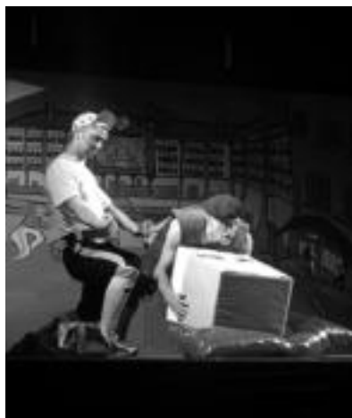
Antzerkia. Ama begira zazu antzezlanak eskaini zuten herenegun herriko gazteek; ikusleen barreak saio guztian zehar entzun ziren. J.SAIZAR