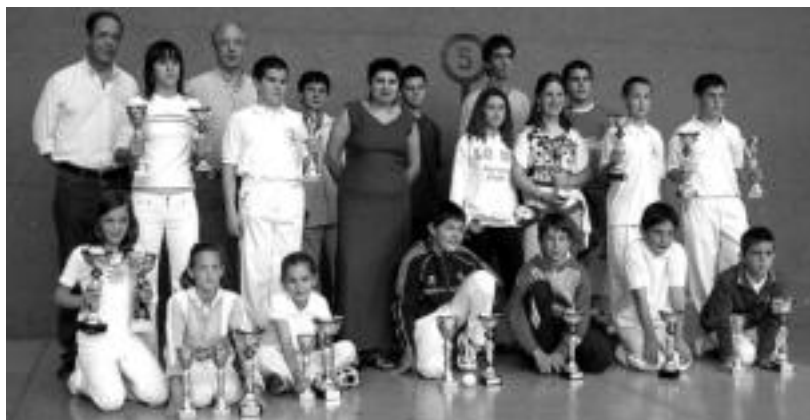
Pilota txapelketako finalak. Egitarau ofizialaren baitan VIII. Eskuzko Pilota Herri Txapelketako finalak jokatu zituzten atzo herriko gaztetxoek; txapelketan, guztira, 73 neska-mutiek hartu dute parte. O.ESKITXABEL

19:00. Kantaldia, Aran eta Estiren eskutik.