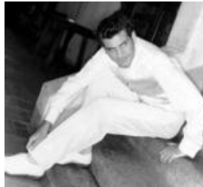
Serbiargiaren kasuan, gero erabili ahal izango duten trajea jantzi dute ezkontzan. »172

Guztietan kasua besteakoa da, «gaur egun ez dira txakak edota frak-ak erabiltzen, beraz, traje arruntak behin ezkontza ere asko erabiltzen dute».