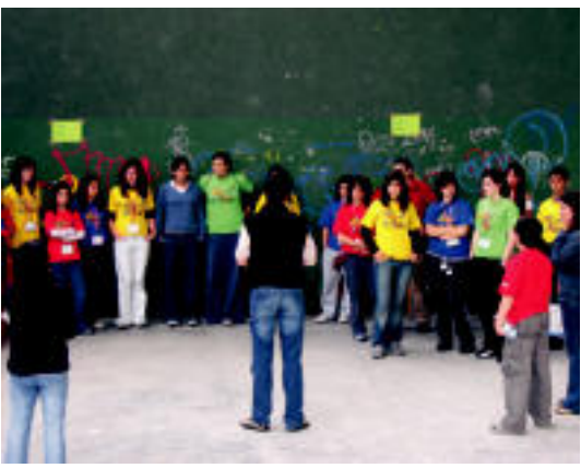
Kolore guztietako proiektuek hartu dute parte biltzarran.

TOLOSA ▶ Laskorain ikastolakoek eta Hirukide ikastetxeok herriko gazteak ordezkatu dituzte Ingurumenari Buruzko Mugaz Gaindiko Gazte Biltzarran