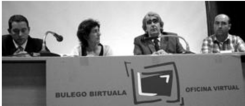
Gipuzkoako Urak enpresako ordezkariak Bulego Birtual berria aurkeztu zuten atzo Kultur Etxean. I. ETXEBESTE

Gipuzkoako Urak bere enpresa publikoarekin batera eman zuten atzo «abonatuiei zuzendutako» zerbitzu berriaren berri