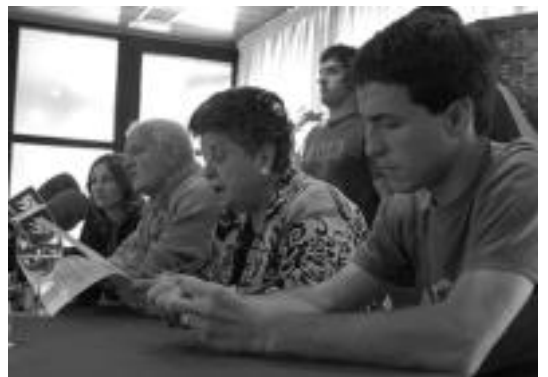
Bost udaletako ordezkarien prentsaurrekoa.

Gipuzkoako bost udalerrri hauetan jarduneko udalak ari dira lanean egun. Udal hauteskundeetan ezker abertzaleko plataforma ilegalizatuek jaso zituzten boto gehien. Hori dela eta PNV eta EAKo hautetsiek beren kargua utzi zuten eta ondorioz aurreko legegaldian zeuden Udal gobernua jarraitu zuen. 2003ko hauteskundeetan herriak «bere borondatea adierazi zuen eta plataforma osatu genuenok azken urteotako norabidean jarraitzeko konfiantza jaso genuen herritarrengatik», azaldu dute bost udaletako ordezkariak.