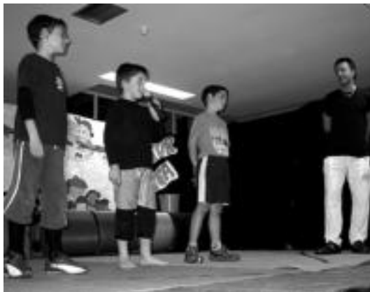
Bertsotan ere adituak direla erakutsi zuten. I.TERRADILLOS