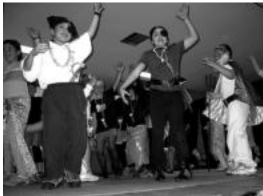
Eskolako ikasleek antzezlan eskaini zuten atzo Etxolan. I.TERRADILLOS

Gaurko egitarauari dagokionez, 17:00etan toka txapelketa ikusiko ahalko da, 17:30ean herriko pilotalekuan Pirritx eta Porrotxen Patata patata emanaldiaz gozatzeko dute txikiak euren gurasoekin, eta Berrobiko XV. Kultur Astearekin amaitzeko 19:15ean txakoli dastaketa egingo dute udaletxe aurrean.