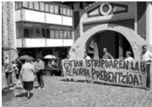
Delegatuek eskuorriak banatu zituzten jendartean atzokoan.

Helburu hori lortuko bada, «LAB-en lan ildoetan ezinbesteko tresna» modura jo zuten, «langileen mobilizazioa» lortzea eta horren harira egin zuten atzoko elkarretaratzea, adierazi zuten.