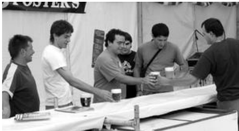
Lehenengo pittarrak zerbitzatu zizkieten Boli, Uranga, Gazte Asanbladako ordezkariak eta Xandadiori. I.T.