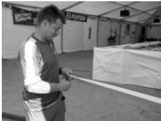
Boli mendizalea zinta mozketako unean, atzo. N.LATABURU

Igandea bitarte iraungo du festak Ibarrrako plazan 18:00-etatik aurrera. Zerbeza eta kalimotxo berezietz gain, ekitaldi ugari izango dira. Gaur 22:00-etan Limerick taldea izango da, eta atsedenaldian kalimotxo dastaketaren proba. Bihar arratsaldean ume jokoak izango dira eta gauean euskal makila borrokaren erakustaldia txalapartz lagundurik, eta igandean 19:00etan aizkolariaren apustua.