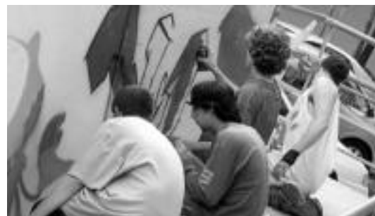
Grafiti erakustaldia izan da egindako ekitaldietako bat. ASIER ETXANIZ

Etorkizunera iluna ikusten dute Gaztetxeoek: «Ekaina al-