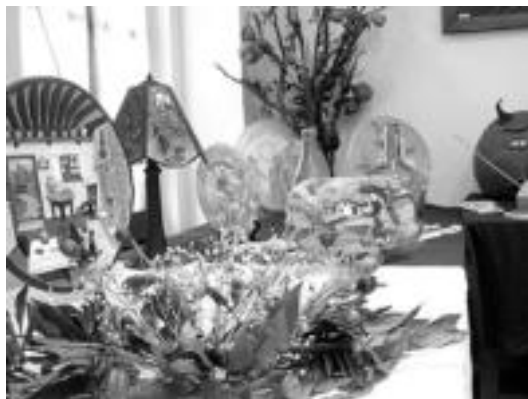
Eskulan erakusketa ikusgai izan zen atzo arratsaldean. I.TERRADILLOS

Bihar, berriz, Kultur Astearen azken eguna izango da. 17:00etan toka txapelketa, 17:30ean pilotalekuan Pirritx eta Porrotxen Patata patata emanaldia, eta 19:15ean uda-