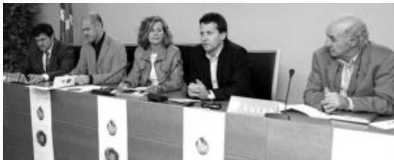
Natura asaldaturia jardunaldien antolatzaileak eta sustatzaileak, atzo, Donostian, ekimena aurkezten. HITZA

Hilaren 23tik 27ra bitartean, hitzaldiak eta mahai-inguruak eskainiko dituzte adituek udaletxean; 20:00etan hasiko dira