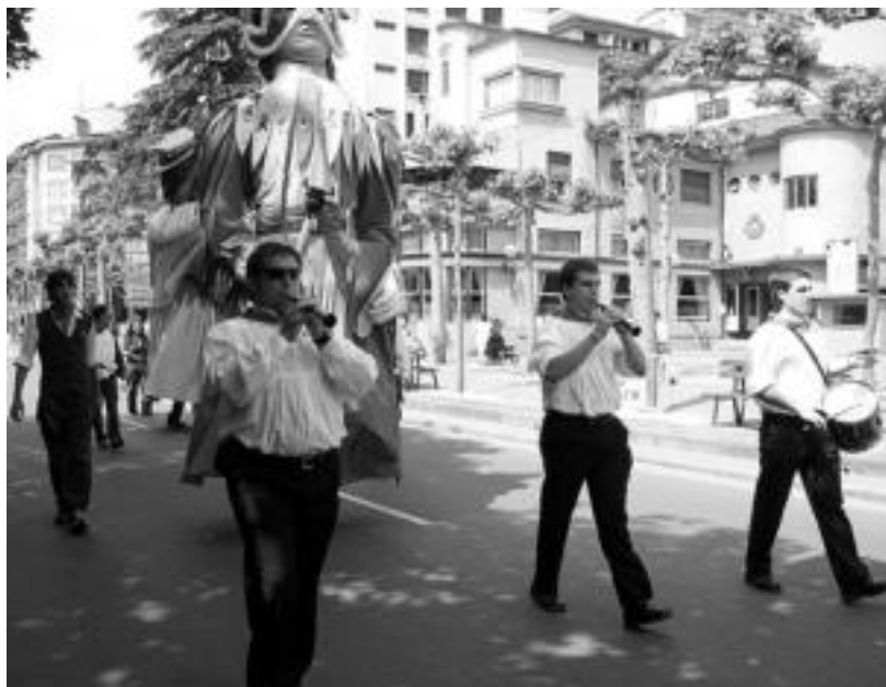
Dultzaineroak eta erraldoiak, San Frantziskotik igarotzean, iaz, X. Musikarian.