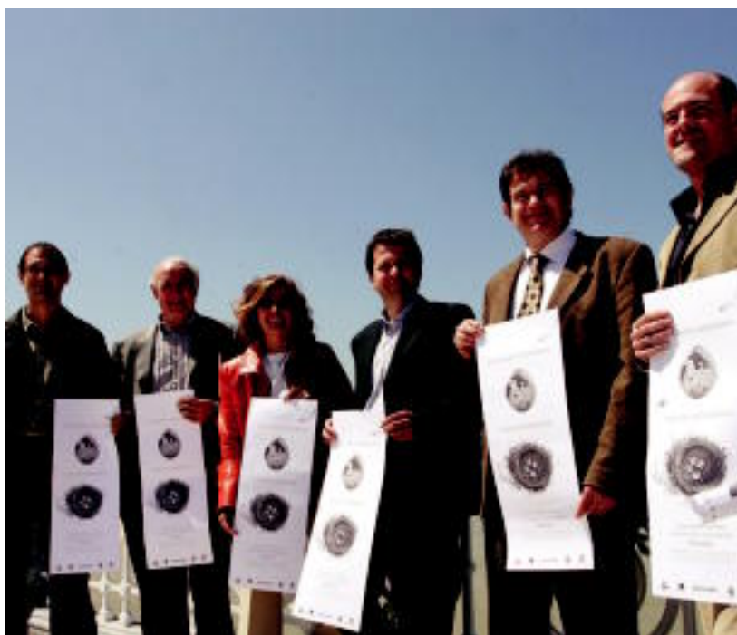
Natur jardunaldietako antolatzaileak eta erakundeen ordezkariak atzoko aurkezpenean Donostian. HITZA

SAIOAK ▶ Hitzaldiak eta mahai-inguruak izango dira, goi mailako adituen eskutik, tartean Miguel Delibes ▶ 2