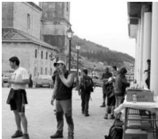
Aurten herriko plazatik abiatuko da maiatzaren 29ko ibilaldia. Argazkian iazko Erniopeko martxako parte-hartzaileak ikus daitezke Albizturko plazan jarri zuten janari postuan. JOXEMI SAIZAR

Aurreko ostiralean hasi eta ekainaren 5a bitarte iraungo dute Udalak eta Arkaitz elkarteak antolatutako ekitaldiek