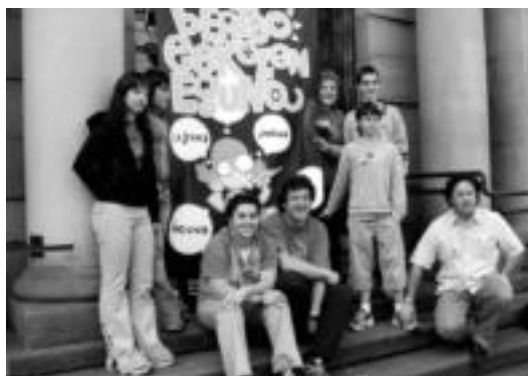
Prentsaurrekoan bertso eskolan eguna aurkeztu zutenak. HITZA

Gipuzkoako bertso eskolen eta Bertsozale Elkartearen arteko lanaren emaitza da ekitaldia, eta «Gipuzkoako bertso eskolen bilgune eta festa ederra izateko» helburuarekin sortu da. Antolatzaileek zortzi eta hemezortzi urte arteko berrehun ikasle biltzea dute xede, Gipuzkoako lurraldean dauden 35 bertso eskolakoak, hain zuzen «Beraien artean hobeto ezagutzeko bidea jarri nahi du bertso eskolen festa honek»