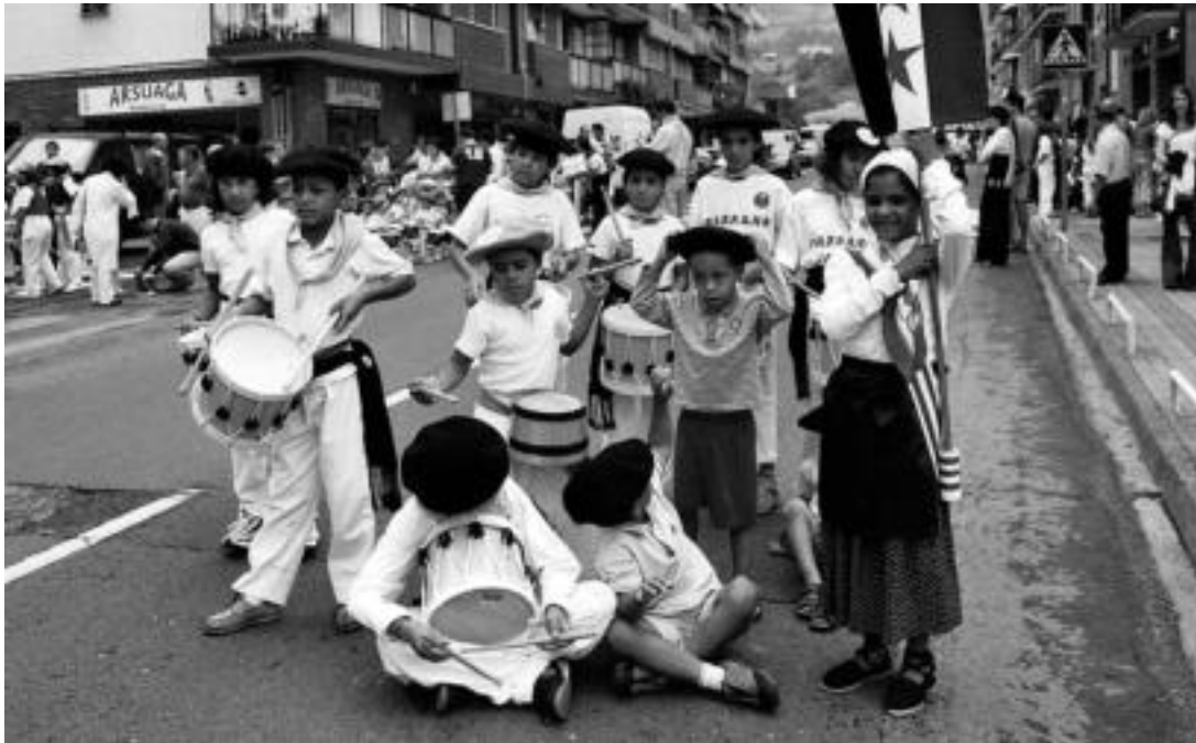
Saharako umeak, iazko abuztuan, Ibarra San Bartolome jaietan, danborrarietz jantzita eta Saharako banderarekin. HITZA