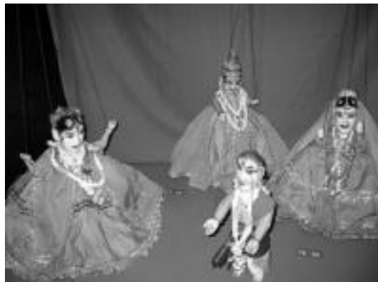
Saria jasotzen duen idazlana eszenaratu egingo dute. I. ETXEBESTE

TEE-k eta Tolosa 750. Urteurrena Fundazioak abiarazi dute; irailaren 1a baino lehen aurkeztu behar dira sormen lanak