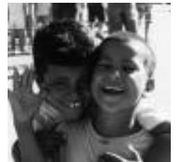
Saharako bi haur. HITZA

Tolosaldea Sahararekin elkarrekin. Edozein zalantza argitu edo informazioa jaso nahi duenak 645 71 07 89ra dei dezake.