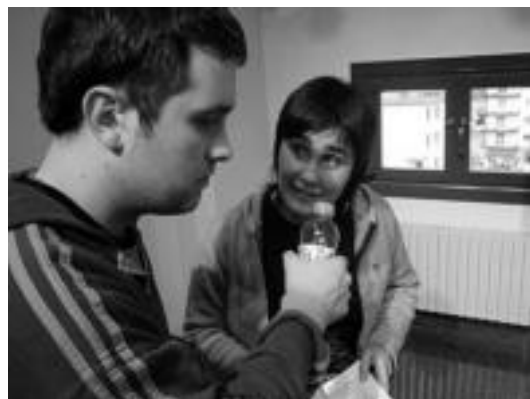
Antzerkian ariko diren bi herritar entseguaren une batean. I. GARCIA

Ama begira zazu antzezlanaren ezagunaren esketx batzuk egingo dituzte, istorioak Anoetara hurbilduz. Jende asko espero dute, frontoia betetzera. «Festetako lehen ekitaldia da eta ikusmina sortzen du», azaldu du Gorka Otxoa-Aizpuruak, antolatzaileetako batek. Aipatzekoa da ere Loatzo musika eskolako ikasleek ere parte hartuko dutela, esketx batzue-