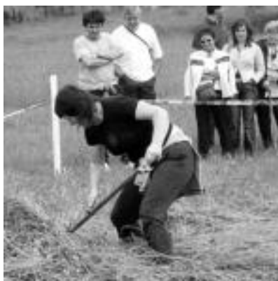
Jende asko izan zen herri kirolak ikusten. I.T.