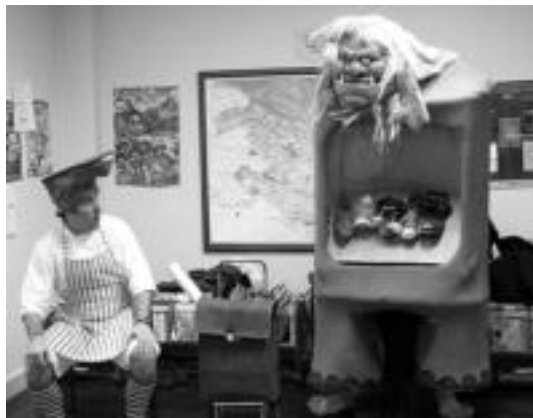
Liburutegian gustura egon ziren Antoninoren kontuekin. I. TERRADILLOS

Sukaldaritza, ikuskizunak, kirola... askotariko emanaldiak eskuragarri