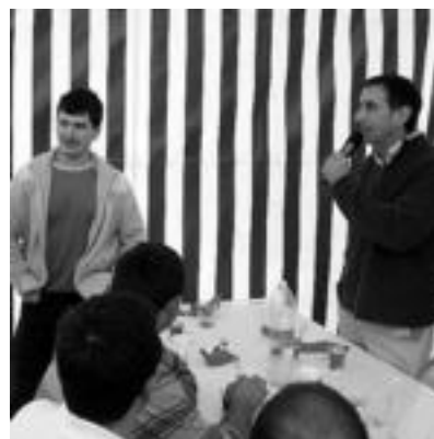
Peñagarikano eta Irazu aritu ziren bertsoetan. HITZA