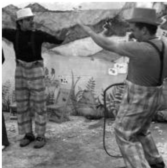
Potxin eta Patxin pailazoan saioan gustura egon ziren bikiak. I.T.