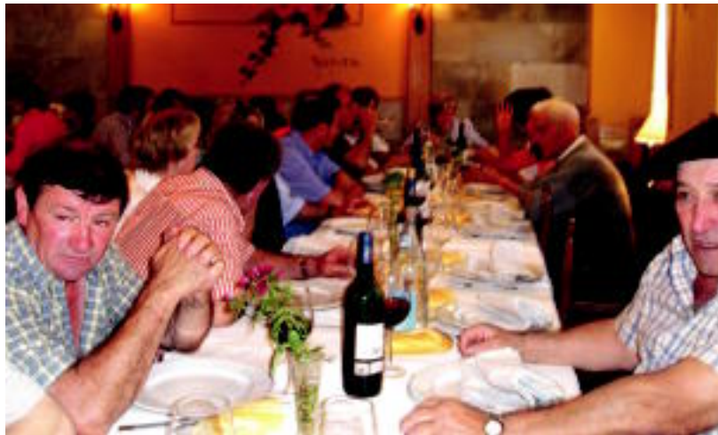
Belauntzako Bentan ederki bazkaldu zuten igandean herriko baserritarrek. HITZA

TOLOSALDEA ▶ Eskualdeko hamabi herritan era batera edo bestera ospatu zuten San Isidro eguna; bazkariak eta hamaiketakoak izan ziren gehienetan