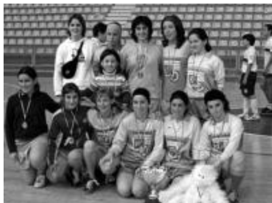
Laskorain ikastolako infantil mailako jokariak, garaiurrarekin. HITZA

keta dute hurrengo erronka. Oraindik ez dakite noiz, non eta noren kontra jokatu duten txapelketako neurketa; hala adierazi dute Laskoraingo Guraso Taldekoek, baina, orain arteko norgehiagoka guztietan bezala, maila bikaina erakutsiko dute, ziur.