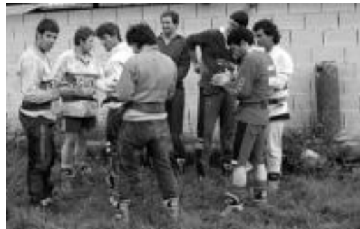
Aresoko taldeko kide batzuk, prestaketa saio batean.