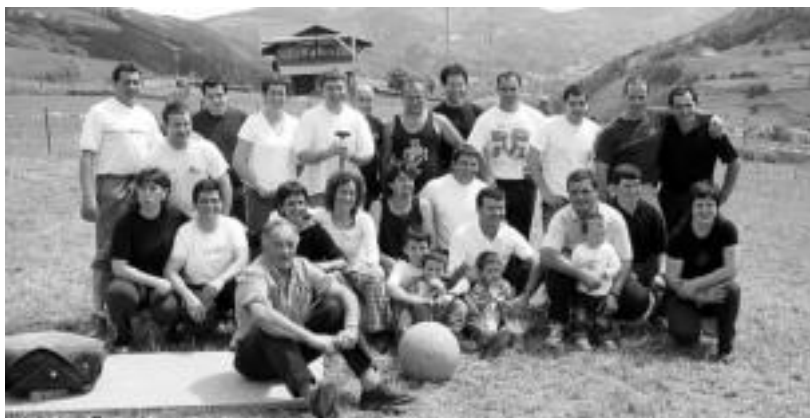
Igandean herri kirolean aritu ziren izaskundarrak bi taldetan banaturik. Txuriek irabazi zuten.

Haurrentzako ekitaldiak izan ziren nagusi atzo arratsaldeko egitarauan. Potxin eta Patxin pailazoan ikuskizunaz gozatu ahal izan zuten, eta baita berarentzat prestaturiko askariak ere. Tartean, euriaren zalan-tzak medio Ibarako Alurr dantza taldeko gazteboen saioa izan zen. Jende asko erakarri zuen dantza saioa amaitu eta Peñagarikano eta Lizasoren bertsoak izan ziren entzungai, eta iluntzeko erromeriak eman zion aurtengo jaiiei amaiera.