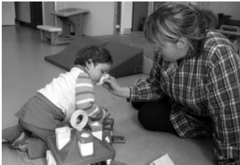
Eriak primeran igaro zuen atzoko goiza Orendaingo haurreskolako jolasgelako jostailuekin. NOELIA LATABURU

Tolosaldeko hainbat herritan daude haurreskolak; hezkuntza 'zuzenaren' aldeko apustua egiten dute denek