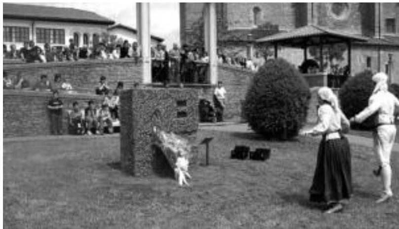
Dantzariak aureskua dantzatu zuten alkate ohiaren omenez jarritako eskulturaren aurrean.