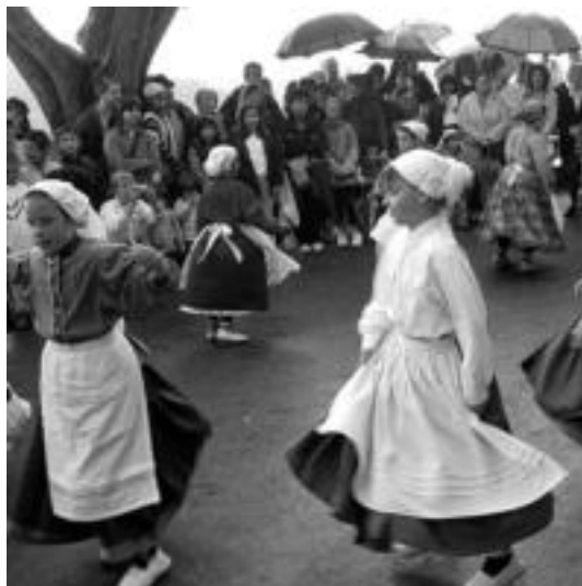
Alurr dantza taldeko gazteboak aritu ziren atzo. I.TERRADILLOS