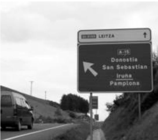
Andoain eta Irurtzun batzen dituen A-15 erreperiako sarrera, Berastegi pareran. MADDI SOREA