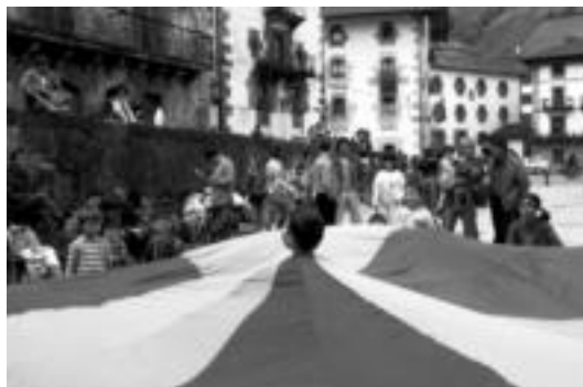
Txikienek oihal handi batekin aritu ziren jolasean gurasoekin. I.T.