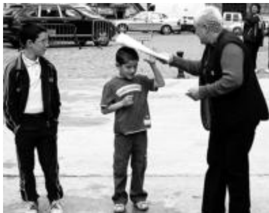
Elkarren izena ezagutzeko jokoak egin zituzten. I. TERRADILLOS

Behin jokoak amaituta kalejira izan zuten Goizuetako Zagi-dantza eta Leitzako trikitilariekin, eta ondoren, Aresoko dantzari txikiak aritu ziren. Aurrera elkartean bapo jan ondoren, umeen saioak izan ziren udal txean. Goizuetako eskolako kantariak eta Leitzako Asketa Txiki abesbatza aritu ziren eta Bizi alai antzerkia izan zen ikusgai. Txokolatea hartzeko aukera izan zuten ondoren, eta Leitzako Ingurutxo a dantzatzuz eman zioten amaiera egunari.