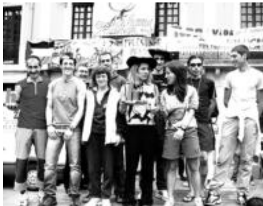
Lehen postuetan sailkatu diren korrikalariak.