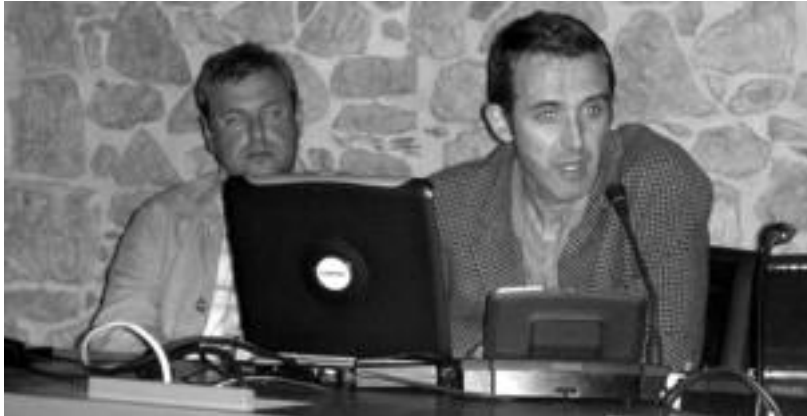
Siadecoren egindako diagnosiaren aurkezpena, herenegun, udaletxean, I. Turismo Jardunaldietan.

▶ Enplegua. 2003an %7,5eko pisua zuen ostalaritzak, Gipuzkoaren parean eta EAEko mailaren azpitik (%8,6). Sortutako enplegua %4,4 zen, Gipuzkoakoaren (%5,3) eta EAEkoaren (%5,2) azpitik. ▶ Ostatuak eta okupazioa.