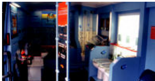
Etxeko tresnetan ura nola aurreztu erakusten dute.

Etxetik kanpora, ur gutxiago gastatuz lore eta landareak orain bezain eder nola eduki erakusten dute: tantakako