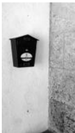
Albizturaren dagoen buzoia. N. L.

Albiztur, Alkiza, Bidegoian eta Larraularen buzoiak jarri dira, Agenda 21 prozesuaren barruan, herritarren proposamenak eta ekarpenak bilatzeko. Albizturaren eta Bidanien udaltxe sarreraren, Alkizan herriko postontzi guztiak dauden udaltxeko gelan, Goiatzen plazan eta Larraularen herriko postontziak dauden elizako horman jarri dira buzoiak.