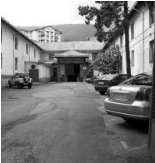
Sarrioko enpresan, 17. moilaren atariko aparkalekuan gertatu zen. J.A.

Gertaera, lantoki horretako 17. karga-deskargako moilaren aurrean gertatu zen, aparkalekuan, 13:50 inguruan, dirudienez bere kotxea utzi eta fitxatzeraz zihoala, han inguruan omen zegoen banaketa enpresa bateko furgoneta bat atzeraka maniobra bat egiten hasi eta azpian harrapatu zuelarik. Berehalakoan, lantokian bertako eta herriko osasun zerbitzuko mediku eta anbulantziak ere etorri eta, bere horretan berpizten ahaleginak egin omen zituzten, «14:40 arte aritu dira», zioen lekuko batek, baina bertan hilik gelditu zen, zerraldor. Dirudienez, «barren-go zauri oso larriak» izaki, ia berehalakoan eragin zioten heriotza.