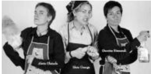
Lakrikun taldekoen antzezlan iksui ahaliko da etzi Trinketean. I. GARCIA

Hilaren 15ean, igandean, San Isidro eguna ospatuko dute. 10:30ean meza egingo da parrokiaren. Ondoren, 11:15ean, Irurako dantzarien emanaldia