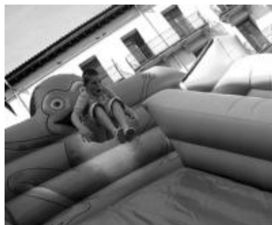
Haurrek eta gaztekoek ederki pasatu zuten puzgarrietan. N. LATABURU