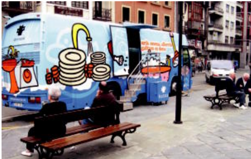
Trianguloan kokatua dago aste osoan urari buruzko informazioa ematen duen autobusa. JOXEMI SAIZAR

Sukaldean erabiltzen da etxe bateko uraren %40. Hona aholkuak: ontzi-garbigailuak eskuz garbituta baino askoz ere gu-