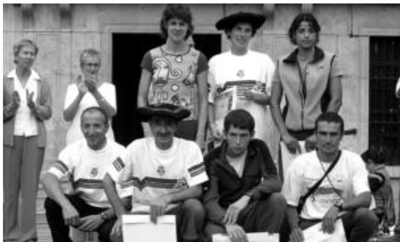
Aurreko Ernioko mendi lasterketako edizioko irabazleak bere sariekin Trianguloan. DAN GIBELALDE

Sari ederrak jarri dituzte antolatzaileek: 500 euro eta txapela irabazleentzat gizonezkoetan eta emakumezkoetan, 300 euro bigarrenentzat, 200 euro hirugarrenentzat, 100 euro laugarrenentzat eta 50 euro bosgarrenentzat. Tolosaldeko lehenak HITZA garaikurra jasoko du. Dutxa zerbitzua Igarondo udal igerilekuan izango da.