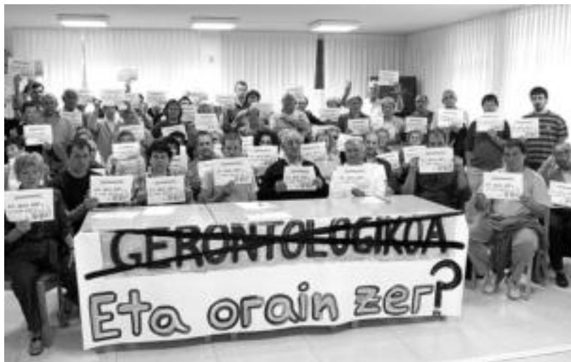
Gerontologikoaren Aldeko Plataforma, abekimena eman dieten eragileen ordezkariekin agertu ziren. J. A.

Banatu zuten informazioaren arabera, zerbitzu gerontologikoa eskatzen dutenen zerrendari ez omen zaio erantzunik eman oraindik: «Defizita 50 lekukoa da», adierazi zuten, Tolosan —26 lagun— eta inguruetako herrietan itxoi ten dau-