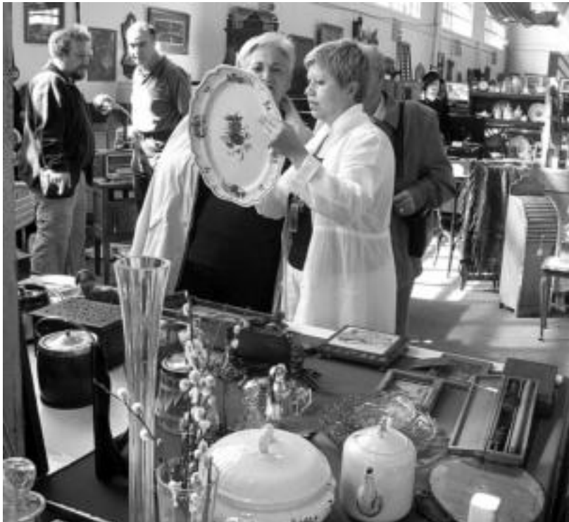
Azokara gerturatutako jendeak xehetasun guztiak begiratzen ditu produkturen bat erosi aurretik. N. LATABURU

11:00etatik 14:00etara eta 16:00etatik 21:00etara irekiko da; guztira 15 erakusmahai daude ikusgai Ferialekuan