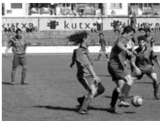
Tolosarrak izan ziren baloiaren jabe, denborarik gehienean. J. ASTIBIA

zatia, 1-0ko emaitzarekin bukatu bazuten ere, bigarren zatian sartu zituzten gainerako tantokak (Lasak, 2, Pradosek beste 2, eta Errastik 1). Tolosa taldeko arduradunek jakinarazi zuten, «oso gustura, pozik gaude egindako lanarekin», zioten. «Gol asko sartu ditugu eta emaitza ziurtatu egin dugu. Baina, gainera, batez ere biga-