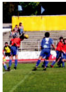
Trintxerpe defentsan atzo.

GOLAK ▶ Lasak (2), Pradosek (2) eta Errastik sartu zituzten golak ▶ 7