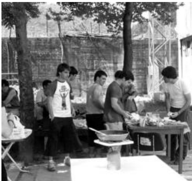
Bazkaria prestatzea izan zen anoetarrentzat eguneko lehen lana. GARAZI AZKUE