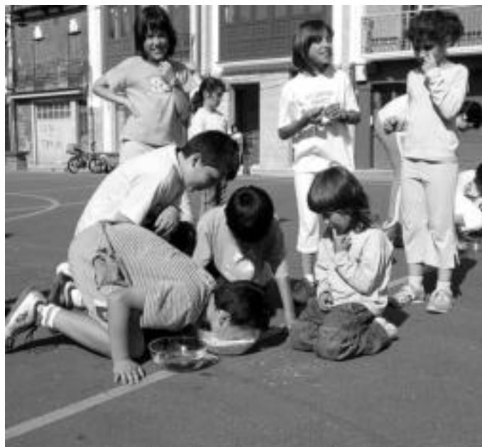
Errebote plazan bildu ziren haurrak, gazteek antolatutako jokoetan parte hartzeko. G.AZKUE