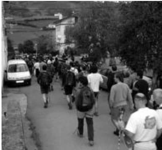
Igandean egingo dute 13. Berastegiko Ibilaldi Neurtua. J. SAIZAR

Berastegiko plazatik aterata, honako puntuak igaroko ditu ibilaldi neurtuak: Erroizpe (Larte), Boketea, Ulizar, Urto, Plazaola, Ipuliño, Gorosmendi eta San Lorentzo. Azken puntu horretatik, hau da, San Lorentzotik Berastegirantz jarraituko du bideak bertako plazan amaitzeko. Ibilaldiko unerik gogorrena eta garaiena Ipuliñoko punta igotzea izango da, baina kontuan hartu beharko dira