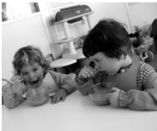
Bazkaria ere haurreskolan bertan egiten dute haurtxoek. N. LATABURU

Matrikulazio kanpaina ere aste honetan jarri dute mar-