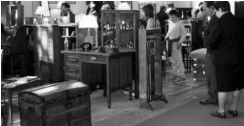
Almoneda eta Altzari Zaharren Azoka gaur hasiko da Ferialekuan, eta igandean amaituko. J. SAIZAR

Ferialekuan izango da erakusketa eta salmenta; Gipuzkoa, Bizkaia eta Madrilgo 15 erakusmahai daude, igandera arte