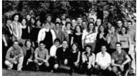
Hodeiertz Abesbatza osatzen duten kideak. HITZA

Hodeiertz 1983. urtean sortu zen eta eskaini dituen kontzertuen kalitateagatik, bere soinu zainduagatik eta programen originaltasunagatik nabarmendu da. Nazioarteko lehiaketetan lehenengo sariak lortu ditu abesbatzak. Horien artean aipagarri dira: Lehenengo Saria Nazioarteko Lehiaketan Varnan (Bulgaria) 1991n;