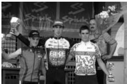
Telleria (erdian), Obanoseko podiumean, 23 urte azpikoetan. HITZA