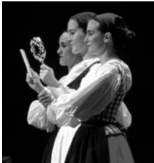
Bihar eskainiko dute Pas de Basque ikuskizuna Leidorren. HITZA

Ospakizunetan zinta-dantza-rekin dantzatzeko dira maiz dantza tradizionalak; patuaren dantzak. Zinta-dantza, bada, patuaren alegoria bat da. «Er-diko zutoinak zintak eusten di-tu gainean, eta txirikordatu egingo dira patuaren irudi gi-sa. Erdiko zutoina Bizitzaren Zuhaitza bezalakoa da, zinten bidez, dantzariak bertara lo-zen diren ardatza; azken hori-erik zilborrestea besterik ez dira». Aldizkako gurutzatze-kin beren patua osatzen dute