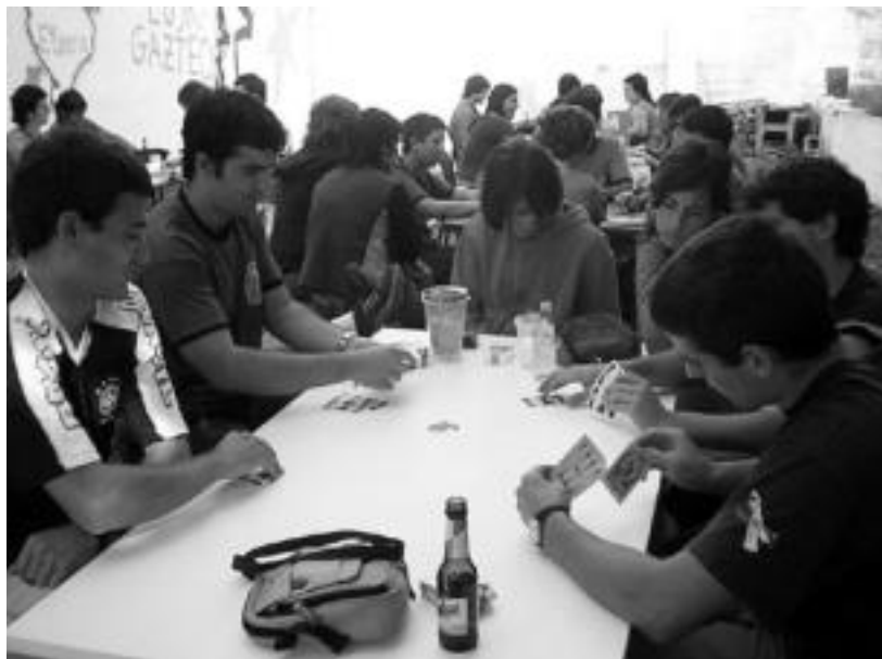
Iaz bezala aurten ere ariko dira Izeba Pilaren Ilobak taldekoak Gaztetxean urteurrena ospatzen. HITZA

Diapositiba eta DVD emanaldia, afariak, kontzertuak, mus jokia, txirrisklas festa eta antzerkia beteko dute agenda