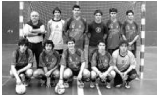
Aralar-Boxnatura taldea osatzen duten jubencil mailako jokalariek.

Bada liga irabazita, Probin-tzien Arteko Txapelketan har-tuko dute parte aurrerantzean Bizkaiko, Arabako eta Nafarro-ako jubencil mailako txapeldu-nen kontra. Lan ona eginez ge-ro, baliteke Aralar-Boxnatura-ko jokalariek gazteek ekainean Pontevedran (Galizia) izango den Espainiako Txapelketan aritzea. Kontuak kontu, gustura