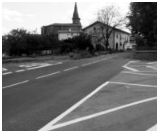
Bi biribilketa berri egingo dira: udaletxeko ondoko bideak eta Amalkor kaleak bat egiten duten lekuan —ezkerrean— eta Amalkorren hasieran. i.g.

Galtzada-harriez gain, itxura aldatzea nagusia egingo diren bi biribilketa beharriak