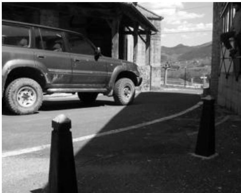
Uztartza eta elizaren arteko bihurgunean ibilgailuek ez dituzte arazorik izango obrak amaitu eta gero. i.g.

Aurrekontu handia dute obra hauek. Udalarentzat «asko suposatuko du ekonomikoki», adierazi du Adunako alkateak. Lehiaketan zehaztutako kopurua 240.000 eurokoa (BEZa aparte) da, hots, lehengo 40 milioi pezetan.