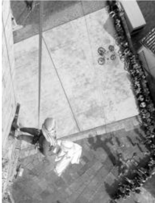
Ximonen jaitsiera ikusteko jende ugari bildu zen eliza atarian. I. GARCIA

Ximonen jaitsierarekin eman zieten hasiera Asteasuko Elizmendi auzoko festei atzo. Elizako Ximon izeneko gargola bizidun bihurtu zen une batez eta paretatik jaitsi zen atarian zain zeuden haurrei gozokiak jaurtikiz. Atzoko jai giroak gaur izango du jarraipena. Goizeko mezaren eta hamaiketakoaren