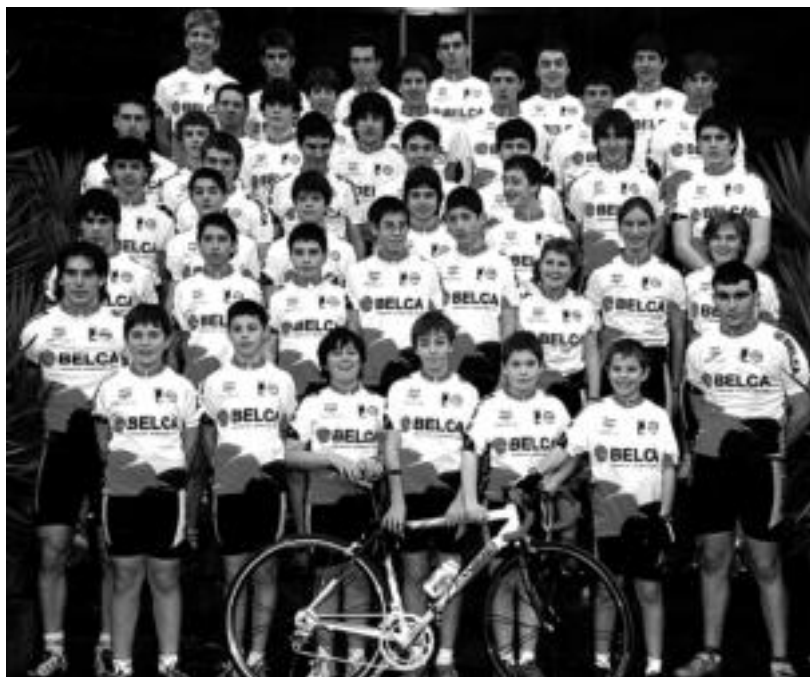
Oriako Txirrindulari Eskolako ziklista guztiak, taldearen aurkezpenean, Belca-ko mailotarekin.