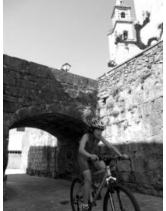
Elizmendiko kaskoan aritu ziren korrika eta bizikletan haurrak. I. GARCIA

ondoren, arratsaldean herri kirolak eta Laja eta taldearen musika emanaldia izango dira.