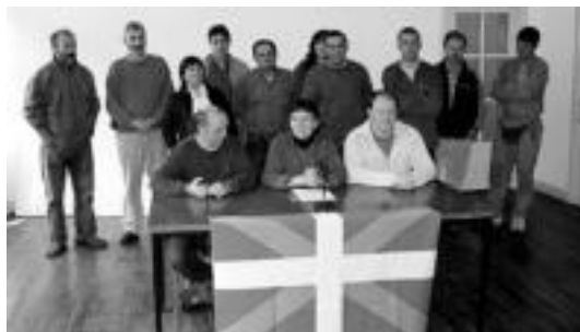
Zinegotzi eta alkate ohiek babestuta egin zuten deialdia. HITZA

Erabaki hori «batzar batean eztabaidatu gabe» eta «herria-