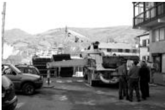
Istripuko lekuan, datuak jasotzen aritu ziren foruzainak. J. ASTIBIA

Denbora gutxian Leitzan gertatzen den bigarrena da atzokoa, hain justu, Lanerako