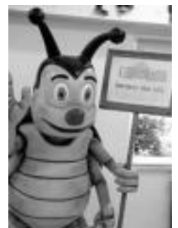
Mantto maskota berrituta. HITZA

Itxuraz berrituta. Ikasleek aski ondo ezagutzen dute Mantto maskota, eta Literatur Astearen 5. ediziorako itxuraz berrituta agertu da, hiru dimentsiotako papin erraldoi bihurtuta. Ikastetxeko pasiloan jarri dute, ikasleei Literatur Astearen barruan zeudela gogorarazteko. Hemendik aurrera eskolan egiten dituzten ekimenak girotzeko baliatuko dute maskota, eta horrekin lotutako zerbait eramango du Mantto soinean. «Oso harrera ona izan du maskota berrituta ikasleen aldetik».