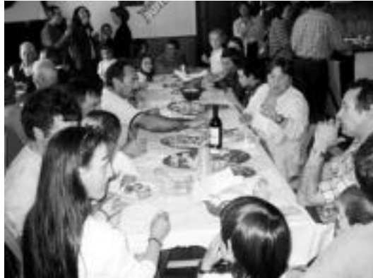
laz Orexako Santa Kruz jaietan egindako herri bazkaria. D.GIBELALDE

Jai giroaz gozatzeko aukera izango da beraz gaurtik eta bihartik aurrera Orexan eta Asteasuko Elizmendi auzoan ospatzen diren santakruzetan.