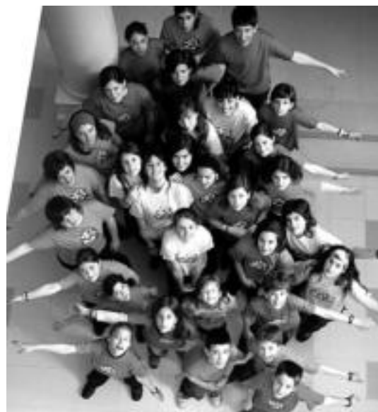
Hodeitruk abesbatzako haurrak eta gaztetxoak.

Orduan lortutako emaitzak eta arrakasta ikusiz, Hodeitruke antolakuntzak gonbidatuta hartuko du parte aurten haur abesbatzen modalitatean. Ospe eta maila handiko koruekin lehiatuko da: Gernikako Gaudeamus korala, Irungo Coro Infantil Ametsa, Gasteizko Coro Luis Dorado Unamuno, eta Errusiako Armonia abesbatza, besteak beste.