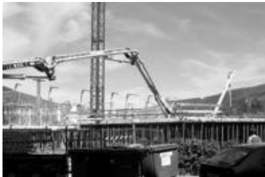
Garabi ponparen besoa eroritakoan zauritu ziren bi langileak. J. ASTIBIA

Segurtasuna eta Osasunaren Nazioarteko Eguna ospatzen zen egunean. Nafarroan aur-