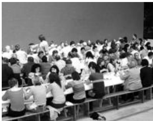
Atari-Soro pilotalekuan izango da aurten ere txekor-jatea. M. JAUREGI

14:00etan hasiko da Atari-Soro pilotalekuan herriko gazteek antolatu duten bazkaria