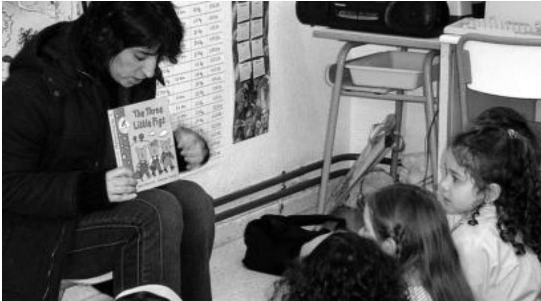
Samaniego ikastetxeko ikasleetako baten ama, ikastetxean haurrei ipuin bat irakurtzen, V. Literatur Astearen harira. HITZA

V. Literatur Astea egin berri dute Samaniego ikastetxeak, eta «pozarren» dira ekimenak izan duen erantzunarekin, gero eta jende gehiago inplikatzeko ari baita