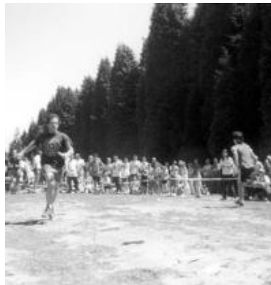
Herri kirolek bere lekua izango dute Andatza Egunean. HITZA

Bazkaria norberak ekartzea aurreikusten da, eta kafea eta