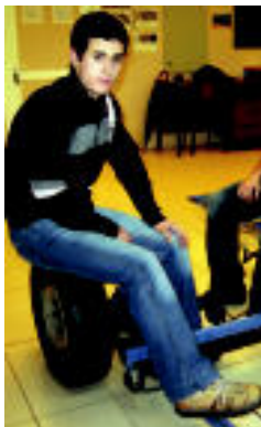
I. IZA / OARSOALDEKO HITZA