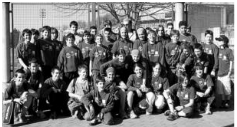
Tolosa CF atletismo eskolako infantilak, Donostiako Belodromoaren aurrean, artxiboko irudian.

Tolosa CFko beste atleta guztien lana ere goraiatu dute taldeko ordezkariak: «Azpima-