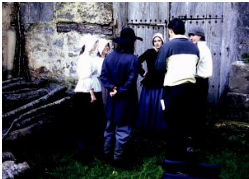
Aktore tolosarrak filmaren irudi batzuk grabatzen Araitz bailaran aurreko asteburuan. HITZA

TOLOSA ▶ Suediako telebista baterako film bat grabatzen aritu dira asteburuan Araitz bailaran tolosar gazte eta heldu batzuk