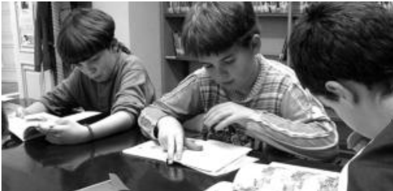
Gaztetxoek euren liburu gustukoena irakurtzeko aprobetxatu zuten Liburuaren Eguna.

Maileguen truke opari bana jaso zuten gerturatu ziren herritar guztiek