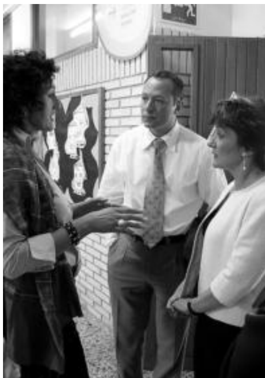
Uzturpeko zuzendariak ikastola erakutsi zien hiru ordezkariek. N. L.

Eskema honek etengabeko hobekuntza irudikatzen du eta egin beharreko edozein egitasmoren oinarri bilakatu da. Hauek dira bikaintsunaren oinarriak: berriztatzea, kalitatea, ezagutzaren kudeaketa, etengabeko hobekuntza, prozesuak eta benchmarking —besteak beste egaitu eta egokitu—. ◀