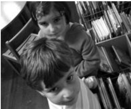
Gogotsu joan ziren txikiak oparia jasotzera maileguaren truke. I.T.