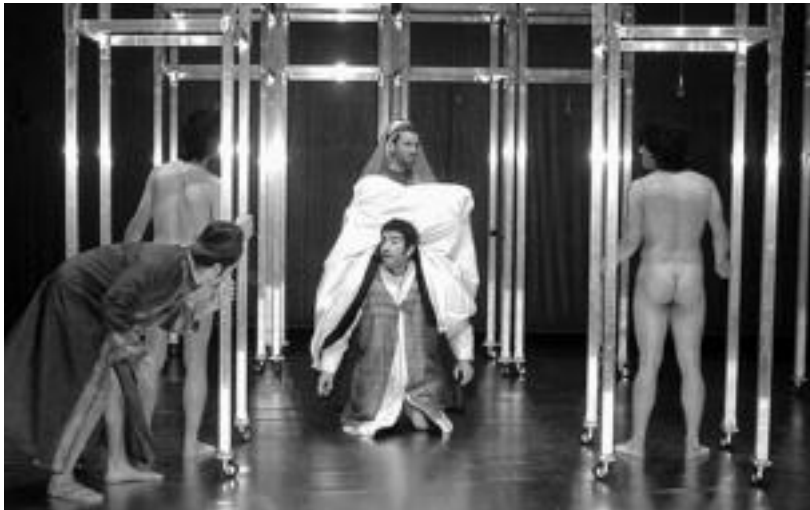
Boccaccio-ren El decameron lana antzetzuko du Ados Teatroak ostiral gauean Leidor zinema aretoan. HITZA

'El decameron' antzezlanaren eskainiko du Ados Teatroak bihar gauean Leidorren, Boccaccio-ren maisulana interpretatuz