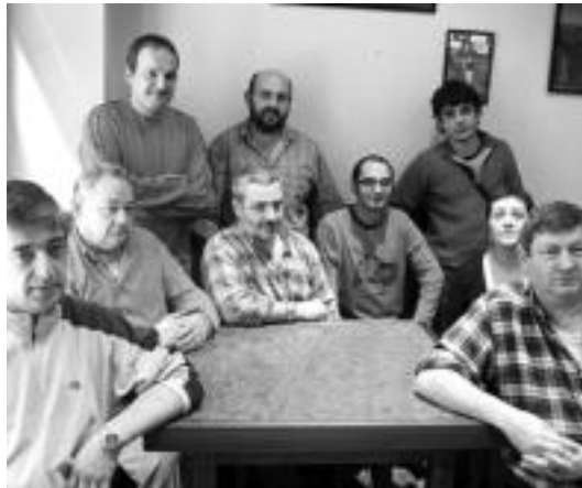
Hainbat tabernari, Elurrako jabeak elkartzara erakusten. J. SAIZAR

Herriko tabernari batzuk «oso kezkatuta» agertu dira Elurra tabernako jabeak, pe-gatinen argazki bat izateagatik «terrorismoaren apologia» leporatuta, Madrilerak deklaratzera deitu dituztelako. «Horrelako kasurik ez da inoiz gertatu», Gipuzkoako Ostalaritza Elkartetik azaldu dietenez. Zitazioa biharko atzeratu dute funtzionarioen greba batengatik.