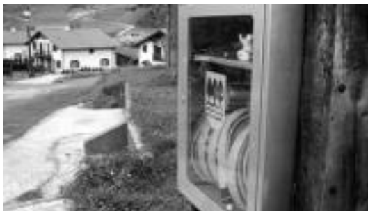
Herriko 5 gunetan jarri dituzte mangeradun armairuak. I. TERRADILLOS

Argindarrarekin izan diren arazoak ere konpondu dituzte jarri berri duten transformagailuarekin.