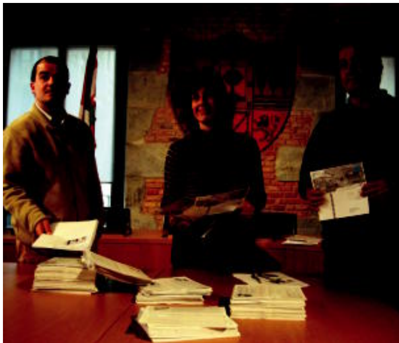
Tolargiko, Tolosa Gasako eta Udaleko ordezkariak bezeroen arteko zozketa egiten. IMANOL GARCIA

ERANTZUNAK ▶ 1.300 iradokizun jaso dituzte; zozketako irabazleak ezagutzera eman dituzte ▶ 2