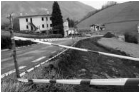
Ekainerako bukatu nahi dituzte errepideko obrak. I. TERRADILLOS

Egingo diren beste lanen artean laster hasiko diren frontoien berrikuntza dago. «Dena itxi eta margotuko dugu eta San Pedro jaietarako amaituta egotea nahi dugun», dio alkateak. Halaber, Leaburuko baserriarrei bereziki eta herritar orori zuzenduta, Foru Aldundiarekin harremanetan jarri ondoren, «180 metroko mangerak dituzten bost armairu jarri ditugu herriko hainbat puntutan, suteekin dauden arazoei aurre egiteko». Hauek nola erabili jakiteko irakatsi egingo zaie leaburuar guztiei.