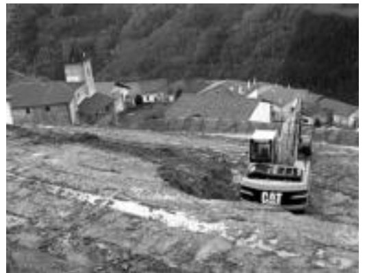
Bi familientzako etxeak eraikitze lanetan ari dira. I. TERRADILLOS

Obrek 18 hilabete inguru iraungo dute; lau etxe geratzen dira oraindik erosteke