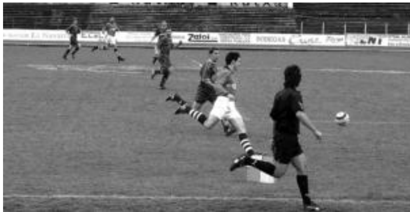
Goren goen mailako Tolosa eta Mutriku taldeen arteko partida, Berazubini, artxiboko irudian.

Datorren asteburuan Hondarribia tadea izango dute aurkari urdinek. Tolosa CF-k, Udalarekin elkarlanean, autobusa antolatu du Hondarribiara joan nahi duten zale guztientzat. Izen-ematea zabalik da dagoeneko, Shanti Kirolak dendan.