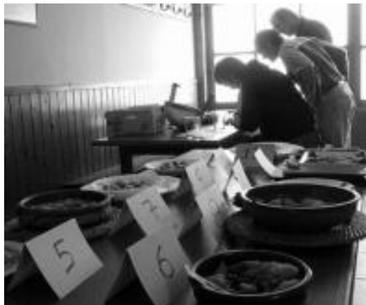
Epaileak, errioxar erara prestatutako patatei puntuazioa ematen. I.T.