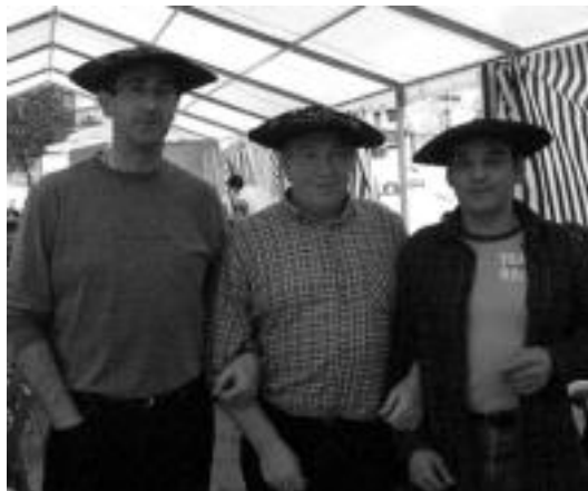
Ibarako XII. Olinpiada Txikiak hiru talde irabazleen ordezkariak. HITZA

Elkartek bat eginda eta adin guztietako jendea elkarrekin izan dela, lagunarteko giro herrikoia nagusitu da bi asteburuetan zehar Ibarren.