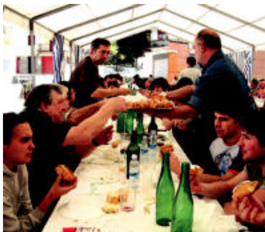
Bazkariak eman zien amaiera igandean Olinpiada Txikiei. HITZA

IRABAZLEAK ▶ Xepila A taldea izan da nagusi; haren atzetik sailkatu dira Sendi Ekintza B eta I.K.E. B. ▶ 6