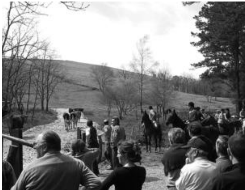
Ikusle ugari bildu ziren larunbatean lehenengo larre irekieraren lekuko izateko.

Batez ere, baserriarrak bildu ziren larunbatean lehenengo abelburuak Eskaltzugainen nola larreratzen ziren ikustera