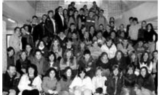
Laskorain ikastolako ikasleak, atzeritrik etorritako lagunekin.

Eleanitz proiektuaren baitan kokatzen diren bi truke antolatuta ditu ikastolak: Erresuma Batuko Howard School of Effingham-ekoekin eta Breizh-ko (Breitainia) Brest herriko Dywan Releg ikastetxearekin. Tolosakoak urtarrilean izan ziren Erresuma Batuan, eta Bresten, berriz, martxoan. Bada, orain gutxi, joan den astean, hangoen bisita izan dute. «Gazteok ekarri duten eskola-lana gure lurraldearen ezaugarriak islatzea denez, irteera sail bat antolatu zaie gure herriari buruzko ezagutza ahalik eta zabalean izan dezaten», esan dute ikastolakoek. Donostia, Hon-