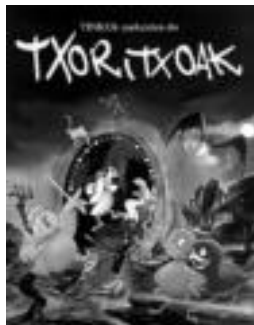
Txoritxoak filma. J. ASTIBIA

Horrela, bihar Jannik Hasstrup-ek zuzendutako marrazki bizidunezko filma izanen da ikusgai. 68 minutuko iraupena du eta Oliver izeneko txori tiki