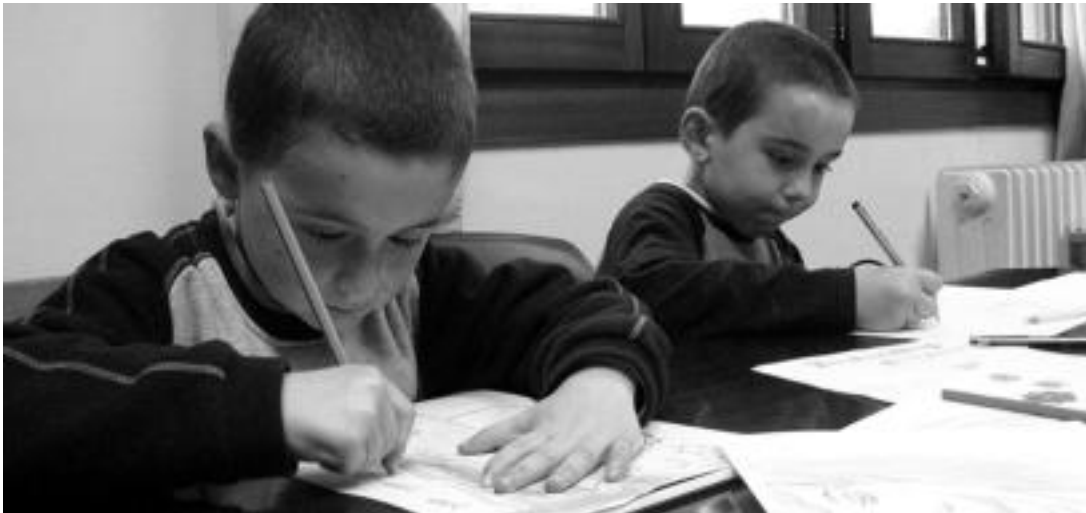
6 urte inguruko gaztetxo ugari ari da marrazkigintza ikastaroan parte hartzen. Gorderik duten artista sena ari dira azaleratzen. I. TERRADILLOS