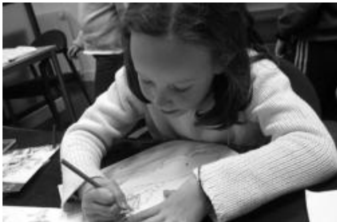
Marrazkiak margotzeko ematen dizkie ikastaroko arduradunak txikiei, eta horretarako koloreak elkarrekin nahastuz kolore berriak sortzen erakusten die. IÑIGO TERRADILLOS