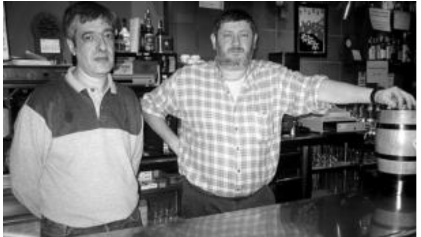
Elurra tabernako bi jabeak barraren atzean; «oso kezkatuta» daude tokatu zaien egoera honegatik.

Abokatuarekin harremanetan jarri eta kasu honek hartu duen bidearekin «harrituta» agertu omen dira «zuzenean Madrilera eraman dutelako eta ez Tolosako Ertzaintzaren ba- sara edo Donostiako epaitegi- ra, normalean egiten duten be- zala; horien kompetentzia ez bada, orduan pasatzen dute Madrilera, baina ez zuzenean, errekurritzeko aukerarik eman gabe». Abokatuak azaldu die- nez, argazkia kentzera joan baino egun batzuk lehenago ertzainek kanpotik ikusi zuten.