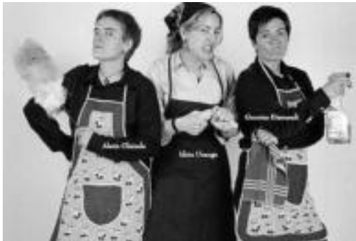
Antzezlan ariko diren hiru garbitzaileak. HITZA

Lakrikun taldeak III. Antzerki Astearen azken emanaldia eskainiko du 20:00etan