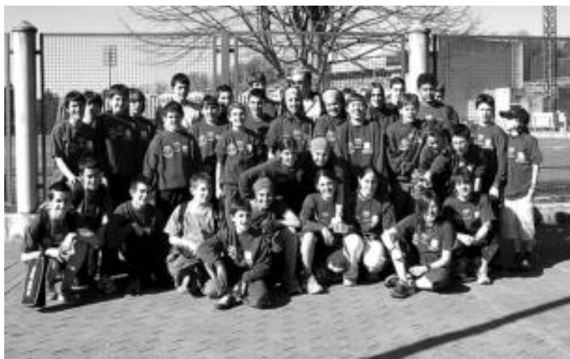
Tolosa CF atletismo eskolako neska-mutilak, Donostiako Belodromoaren inguruan. HITZA

Infantil mailako Elkarteen Arteko Pista Estaliko II. Kopan aritu dira berriki eskolakoak, eta emaitza bikainak lortu