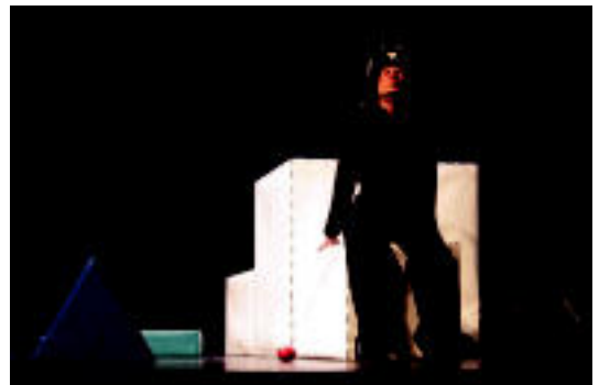
Mitxi, urdaiazpiko pusketa baten usain erakargarriari ezin eutsirik. i.g.