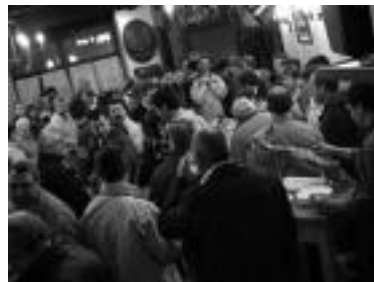
Hamaiketako egin zuten atzo hildako bazkideen aldeko mezaren ostean elkartearen. IRATXE ETXEBESTE

ren 75. urteurren ospakizun sortari hasiera emateko kalitate handiko ekitaldia eskaini zuten, hara joandakoek esan dutenez. Bertaratutakoaren artean