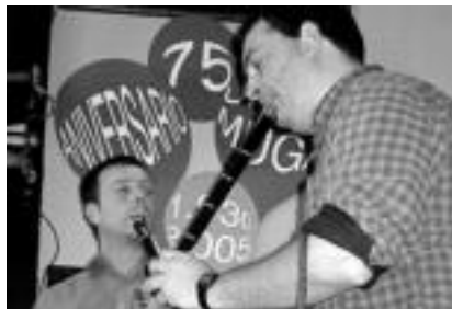
Mendizabal eta Arozena (ezker-eskuin) txistulariek jardun zuten ostiralean Gure Txokoa. AITOR ELDUAIEN