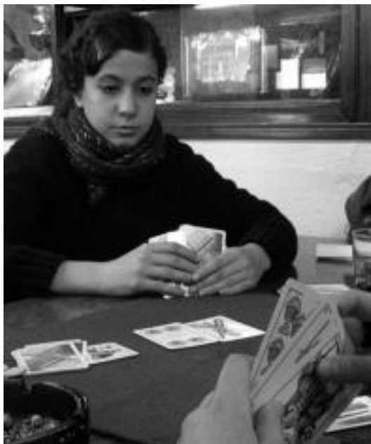
Xepla elkartean eskoba jokoan aritu ziren atzo. I.TERRADILLOS

Xepla elkartean eta I.K.E. an zen atzokoan hitzordua, kartak prest baitzeuden bertan musean eta eskoban lehiatzeko. Taldeka banatu eta partida gehien irabazi zituenak batu zituzten sailkapen orokorrerako puntuak. Horrela, bi asteburuetan zehar burutuko dituzten probetan puntu gehien baten dituenak irabaziko du.