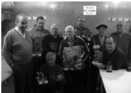
Jokoetako txapeldunak, beren sariekin.