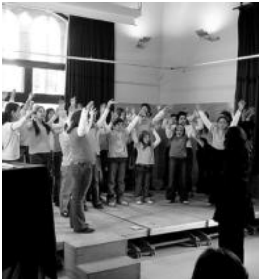
Txalo artean agurtu zituzten Txintxarriko umeak Beguesen. HITZA

Kontzertuari amaiera emateko bi abesbatzak elkarrekin aritu ziren; hala, Xarmengarria kantatu zuten euskaraz eta Joan del riu katalanez. Honen