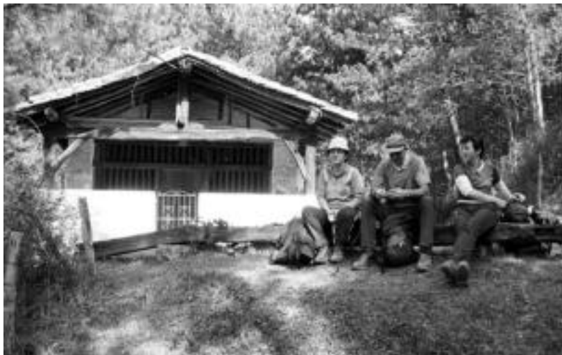
Igorren aurkitzen den San Antolin baselizatik igaroko dira mendizaleak. HITZA

'Euskal Herriko hiriburuak uztartuz' egitasmoaren baitan antolatu dute ibilaldia; izena emateko azken eguna, bihar