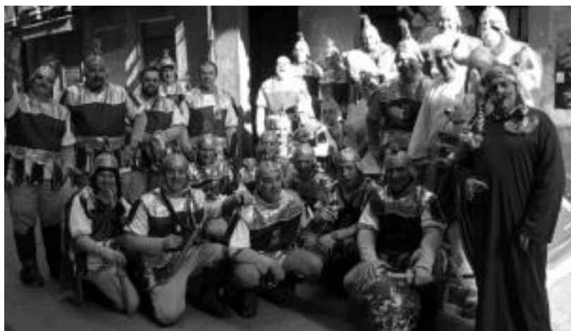
Gure Txokoa elkarteak erromatarrez mozorrotu ziren Inauterietan, Astelenita egunean.