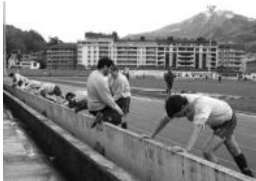
Tolosako futbolariak partidu aurretik berotzen; beharra bazen.

Bigarren zatian berriro agertu zen zorritzara Berazubín tolosarrentzat: kornere batean, 47. minutuan, langa jo zuen berriz Aimarrek botatako baloiak; 50. ean Pradosek berriro langa jo zuen; eta 70. ean Lasak zutoinean jo zuen. Baloiak ez zuten sartu nahi mutrikuarren atean. Tarte horretan, kon-