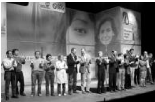
EA-EAJ koalizioako hautetsiak, atzo, Leidorreko eszenatokian.