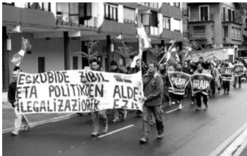
Tolosako Belate auzotik abiatuta manifestaldia egin zuten eskubide zibil eta politikoen alde. I. GARCIA

Euskal Herriarentzat eszenatoki berria sortzekotan, «botoz indartu behar da hauteskundeotan» alderdi politiko hori