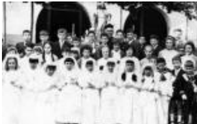
Ohikoa izaten da jaunartzearen ondoren taldeko argazkia ateratzea, 1.950ko argazki honetan bezala. »II»

Lehen jaunartzea egin ondoren, mahaiaren inguruan bildu ohi dira haurren familiak; batzuk elkartetan edo etxetan biltzen dira, gehienak, berriz, jatetxeetan