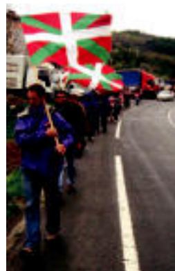
Giza-katea egin zuten. I. GARCIA

ILEGALIZAZIOA ▶ Horren aurrean, «denok erantzun behar dugu mezu berarekin: 'ilegalizazioari ez!'» ▶ 6