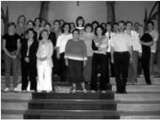
Villabonako haurrei jaunartzerako prestatzen eta katekesia ematen aritzen diren boluntarioen taldeko argazkia. »II»

Lehen jaunartze egunerako prestatzeko lan ugari eginen dute boluntarioek katekesia eskolatan; besteak beste, haurrak fedearen bidean heitzea eta Jesusen bizitzaren berri ematea dute helburu