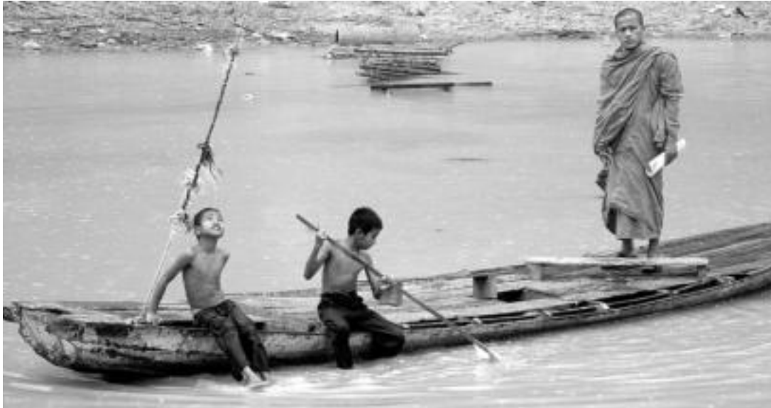
Paisaien edertasunaz gozatzeko aukeraz gain, ibai ertzean bizi direnen abegikortasunaz gozatzeko aukera eman die Mekong ibaiak. FABIOLA JUBIN

Mekong ibaiari jarraitzen hiru hilabetez ibili ondoren, iritsi gara ibai ahora; azken hilabete honetan Laosen, Kanputxean eta Vietnamen ibili gara eta deltarra heldu