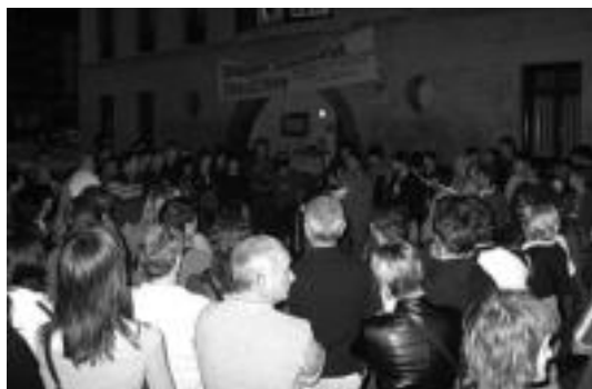
Presaka egin behar izan zuten elkarretaratzea Ibarren. J. ASTIBIA

Gertaeraren berri jakin be- zain laister, gazte hauen seni- deak abokatuekin harreman- tan jarri eta euren egoeraren berri zuzenean («jakiteko beha- rrez», arratsalde partean, Montpellier aldera abiatu zi- ren. Bertan geratutako senide- ek adierazi zuten, atxilotuek «inkomunikazio egoera» zuten ezarrita, eta «beren egoeraren berri eta non zeuden ere ziur- tasunez jakin ez arren», harun- tza abiatu ziren, uestez behinik behin, «inkomunikazioak irau- ten duen lau egunetatik hiru- garrenean, atxilotuek beren abokatuarekin egoteko aukera