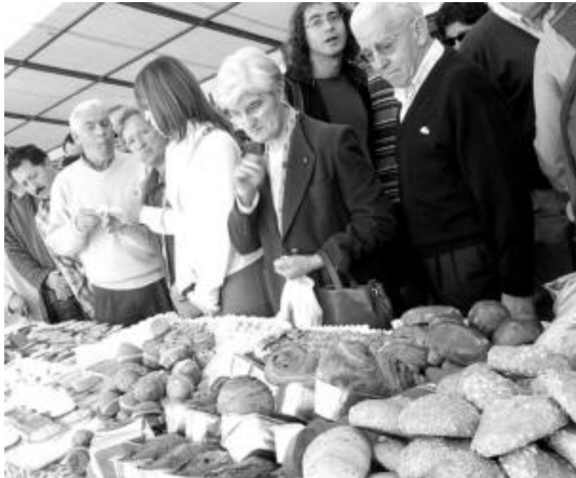
Mota eta zapore guztietako gozoak dastatzeko aukera izan zen atzo Goxua Azokan. NOELIA LATABURU

IX. Tolosa Goxua azokak jende andana bildu zuen goiz guztian zehar; herriko eta kanpoko 15 gozotegik euren produktuak aurkeztu zituzten jendaurrean