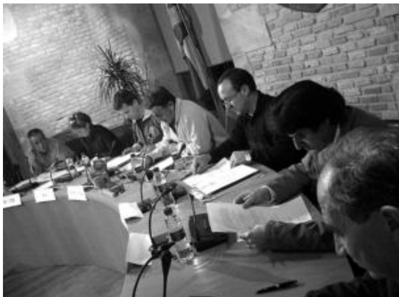
Mahai-inguruko partaideak herenegun udaldebeko batzar aretoan. NOELIA LABURU

«Informazioa langileen aldetik jaso dugu, ez Udaletik. Udal gobernuan ginenean zentro eredu zela esan ziguten Aldundiak arduradunek. Obrak egin behar ziren. Handitzeako ondoko egoitza —euskaltegikoa— eskaini genien. Erabaki antisozial honen aurka egiteko gida-