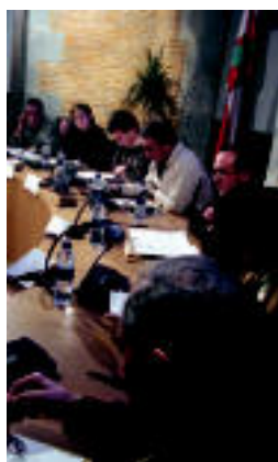
Maha-inguruko kideak. N.LATABURU