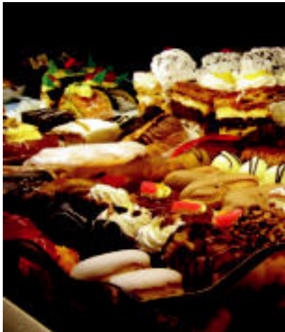
Askotariko pastelak, tartak, goxokiak... erakutsiko dituzte gaur Trianguloan gozogleek.