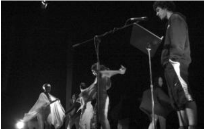
Kuskizun bikaina eskaini zuten atzo Leidor aretoan poesia errezitatzeko jardun zuten ikasleek. L. MONTES

Tolosako Laskorain, Orixe eta Hirukide ikastetxeetako eta Baionako Bernat Etxepare Lizeoko ikasleek poesia errezitaldia egin zuten atzo, Leidor aretoan