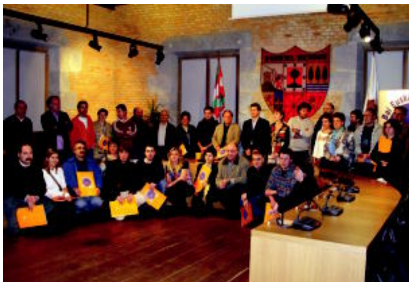
Ziurtagiria jaso zuten gizarte eragileen ordezkariak, agintariak eta Jarraipen Batzordekoak atzo. I. ETXEBESTE

LANA ▶ «Euskararen normalizazio bidean egindako lanagatik» zorionak eman zizkieten sustatzaileek ▶ 2