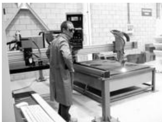
Irakasle bat, makina baten funtzionamendua erakusten. L. MONTES

Bildarratzek formakuntza «gizartearen oinarri nagusietako bat» dela esan zuen agerraldian, eta Hezkuntza sailak 2004-2007rako aurkeztutako plana izan zuen hizpide: «Elkarlanean jardun behar dugu, plana ardatz hartuta. Formazio zentro hauek denon artean indartu behar dugu. Guztiok honetan inplikatzera animatu nahi zaituztet».