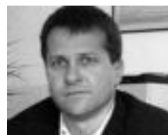
JOKIN BILDARRATZ TOLOSAKO ALKATEA

«Konpromisoari eutsi egin behar zaio, denon artean lortu behar dugulako Tolosaldean euskaraz bizitzea»