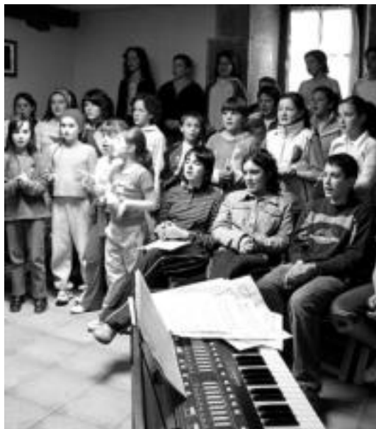
Atzo Asketa Txikikoek prestaketa-sasioa egin zuten. JAIONE ASTIBIA

«Elkarretaratzea aberatsa» izanen dela iritzi zioten, bestalde, hain zuzen ere, egonaldia Asketa Txikiko kideen familien etxeetan egingen dute eta egingadako bidaia, «herrian bertako txoko, famili eta kultura ezagutzeko» baliatuko baitute. Horretarako agenda bete jarduerara