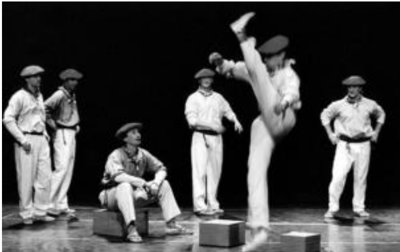
Garai bateko herri dantzak berraurkitu nahi dituen proposamena da Pas de basque ikuskizuna.