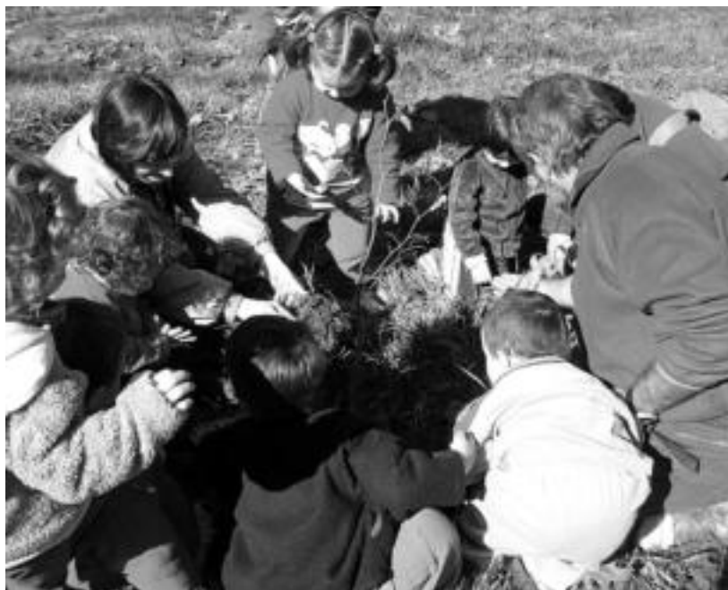
Umeek jardunaldi polita igaro zuten aurreko urteko Zuhaitz Egunean, pagoak landatuz. O. ESKITXABEL

San Joan eskolako eta Aralar institutuko ikasle, irakasle eta gurasoak Langaurren egingo dituzte eguneko ekitaldiak