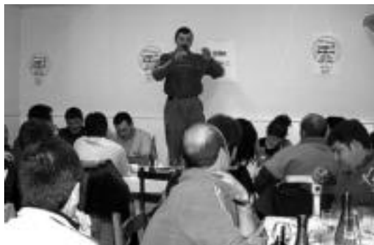
Muxkil elkarteak antolatuta, afari txistosoa egin zuten Adunan. HITZA