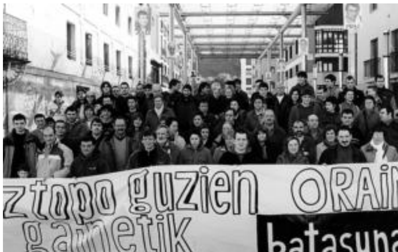
Herritar ugari elkartu ziren larunbat goizean Batasunaren idatziari abikimendua emateko. HITZA