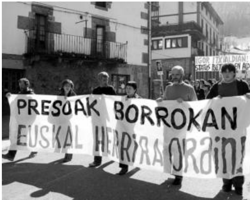
Manifestazio isila burutu zuten herrian barrena, EPPK-ak daraman borrokaldiarekin bat eginez.

Manifestazioa egin zuten igande eguerdian, preso en izaera politikoa aldarrikatu eta beren Euskal Herriratzea eskatuz; Herriko presoak gogoan izan zuten