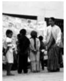
Indiako irudi bat. HITZA