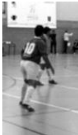
1-legin zuen Ibarrak. I.TERRADILLOS

Bigarren zatian ezer gutxi aldatu zen. 5. minutuan Ultzamak berdinketa lortu zuen; epailleak zalantza izan zuen gola ontzat emateko, baina bigarren epaileari galdetu eta honek baiezkoa eman ondoren berdinketa-