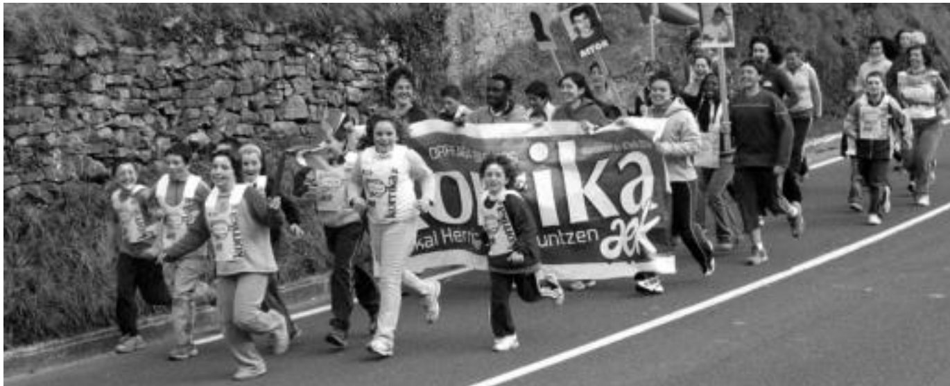
Bi herritan aurreratu egin ziren eta horrela ostiralean Lizartzan —argazkian korrikan aritu zirenetako batzuk— eta Anoetan egin zituzten Korrika Txikiak. IÑIGO TERRADILLOS