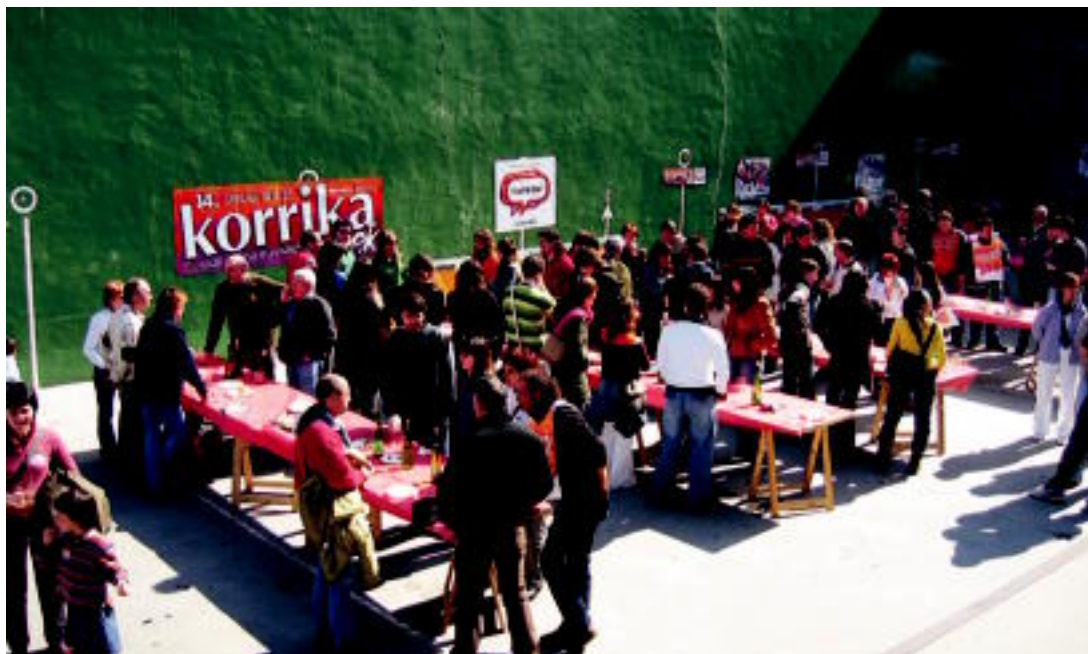
Amezketan hamaiketakoa egin zuten igande eguerdian, Korrika Batzordeak antolatuta. NOELIA LATABURU

Manifestazio isila izan zuten igandean, itxialdiarekin bat ▶ 7