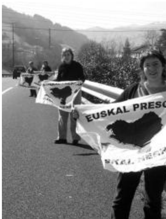
Euskal presoen Euskal Herriratzearen alde, atzo, errepidean. I. GARCIA

Urtarrilaren 3tik ari dira euskal presoak borrokaldi berri hori egiten, «Euskal Herrian abian den prozesu politikoan parte hartzeko dugun eskubidea aldarrikatzeko». Zazpi txandak bukatuta, hilaren 15ean amaituko duten itxialdiari beste protesta ekintza batekin emango diote jarraipena euskal preso politikoek. Asteazkenetik aurrera hamabi eguneko gose grebari ekingo diote denek. Hortaz, EPPK osoak, 700 presok baino gehiagok, baraualdia egingo dute martxoaren 16a eta 27a bitartean.