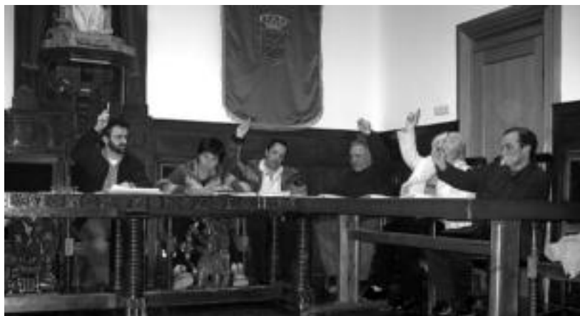
Aralar eta EA-ko zinegotziek emandako botoekin onartu zen euren proposamena. HITZA