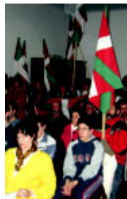
Ikurrin asko eraman zituzten.

BALKOIAN ▶ Zenbait herritarrek ikurrina jarri zuten udaletxean bilkura egiten ari zen bitartean ▶ 7