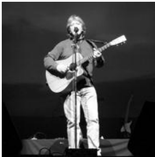
Benito Lertxundi ostiral gaueko kontzertuan, Leidorren.

Horien artean, Jon Maiak Lertxundik abestuak izateko egin zituen bertsoak eta gai bezala itsasoa dutenak bereziak izan ziren. Abeslariak azaldu zuenez, itsasoari begira egoten den horietakoa da bera, eta, beraz, gaia ere bat zetorren berarekin. Era berean, Itoitz-ko urtegia buruan zuela idatzitako