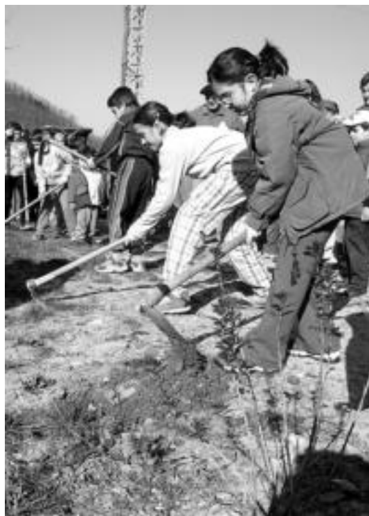
Ahaleginean aritu ziren haurrak atxurra eskuan zutela. I. GARCIA

Leaburun ere Zuhaitz Eguna antolatu zuten atzarako, baina zuhaitz landaketa egiteko deialdira ez zen jenderik azaldu. Horregatik, Udaleko langileek bihar landatuko dituzte prestatuta zituzten 50 urkiak. Depositu bidean landatuko dituzte. Aurretik, horretarako dauden diru laguntzez baliatuz, koadrila batek mendi zati hori garbitu zuen.