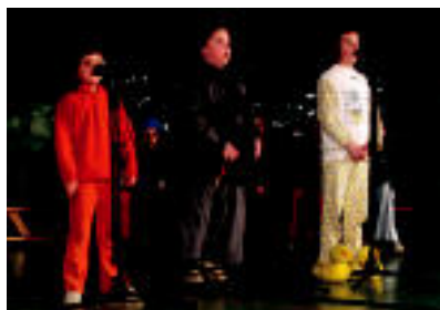
Bertso saio xelebreak izan ziren entzungai eta ezohiko egoerak ikusi ahal izan ziren, besteak beste. I.T.