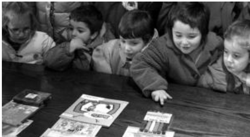
Ikastolako haur batzuk udaletxeko areto nagusian, zozketatu behar ziren opariei begira I. GARCIA.

Lehen Hezkuntzako lehenengo eta bigarren mailakoei —sei eta zazpi urtekoak— jantzi kolore gustukoenei eta ez gustukoenei buruz galdetu zieten. «Nesken artean arrox