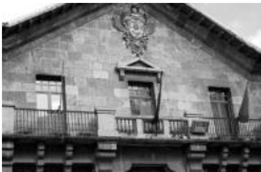
Lehenengo 24az gerotzik, udaletxeko balkoitik ikurrina falta da. J. ASTIBIA