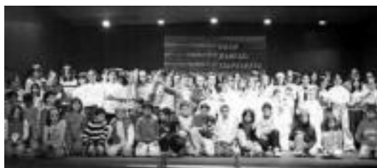
Iazko Nafarroako Haur Kantari Txapelketako partaideak.

Larunbatean eginen dute Nafarroako Kantu Txapelketako bigarren saioa Donezteben