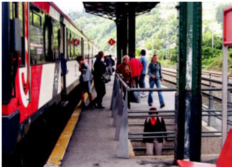
Tolosako geltokia erabiltzen dute eskualdeko bidairi gehienek. J.SAIZAR

TOLOSALDEA ▶ Aldiriko tren zerbitzuak erabiltzen ditu jende askok Tolosa eta Villabona-Zizurkilgo geltokietan; %99ko puntualitatea du zerbitzuak