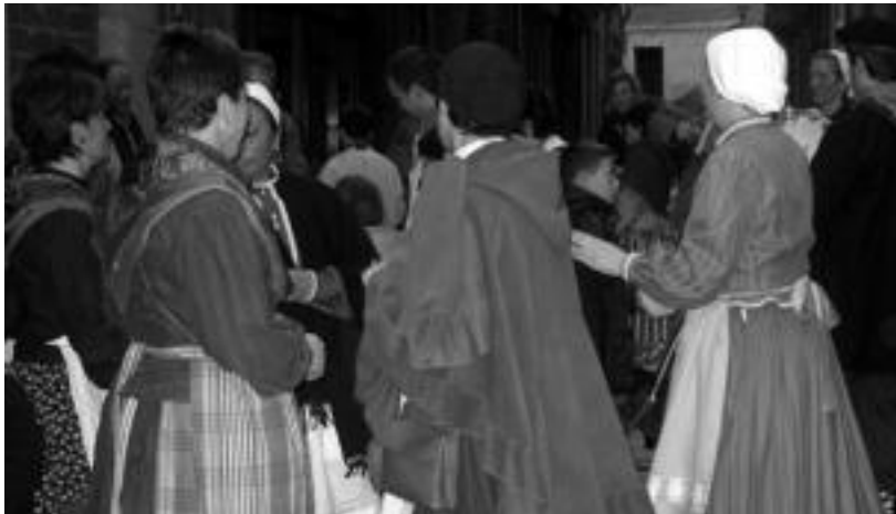
Udaberri taldekoek bigarrenenez antolatuko dute aurten erromeria herrikoia; argazkian, iazkoa. G.AZKUE

Datorren asteko larunbatean, hilak 19, egingo dute herrian zehar; afarirako txartelak salgai jarri dituzte hoge eurotan