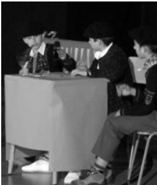
Pasa den urtean Uzturpek antolatutako jaialdiko une bat. DANI GIBELALDE

Haur Hezkuntza, Lehen Hezkuntza, DBHko Lehen Zikloko eta antzerki tailerreko ikasleak izango dira hain zuzen emanaldia eskainiko duten artista txikiak. Dantza, antzerki, bertso eta zenbait xelebreek izango dira ikusgai bihar. Aurtengo izenburuak dioten bezala aldre-