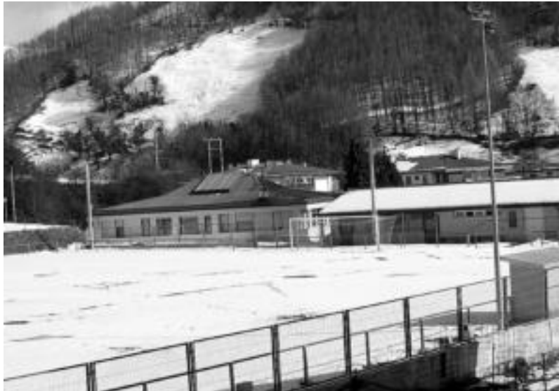
Atzo arratsaldean, oraindik ere elurtuta jarraitzen zuten Arkixkil futbol zelaiak. JAIONE ASTIBIA

Igandean berriz ere jokatzetik gabe gelditu ziren Aurrerakoak, lehengo elurraren gainean, beste aldi bat ere egin zuen eta. Asteazken zehar, ura botaz eta saiatsu izan dira elurra urtzen, baina asko gogortuta zegoen, koilatuta, eta nekez kendu zitekeen. Lehengoak aski ez zirela, gainera elur berria egin zuten. Horrela bada, duela bi jardunalditako partidua bertan behera gelditu zen moduan, kasu hartan Aralar Mendiren aurkakoa, asteburu honetan Gazte Berriarekin jokatzekoa zuten. Uhartearakildarrena hilaren 24ean berreskuratuko dutela eman dute jakitera. Baina azken honetakoari dagokionez, ez dute data zehatzik oraindik. Hiru partidu ditu berreskuratuta beharrak Aurrerak.