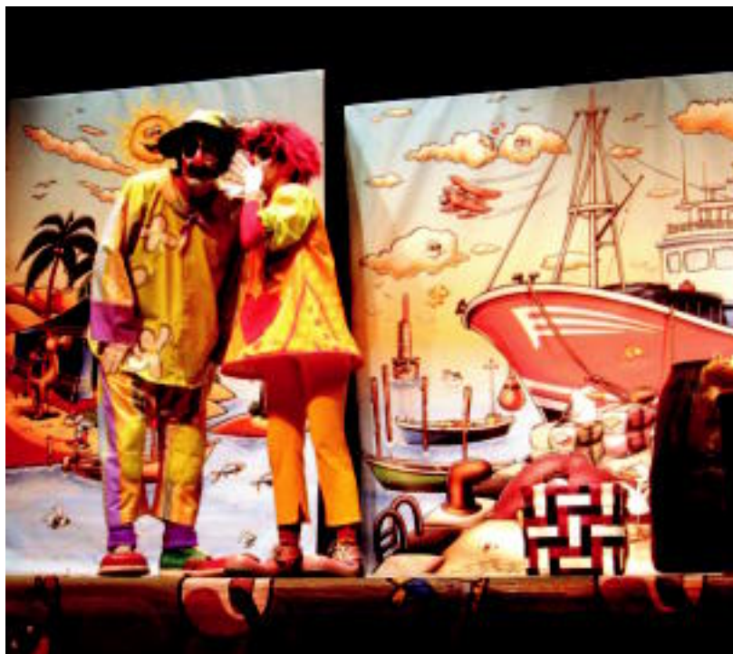
Arrantzan aritu ziren Pirritx eta Porrotx itsasertzeko kai batean. JAIONE ASTIBIA

TOLOSA ▶ Hurrez eta gurasoez bete zen larunbatean Leidor zinema Pirritx eta Porrotx pailazoaren gorabeherak, kantak eta dantzak ikusteko