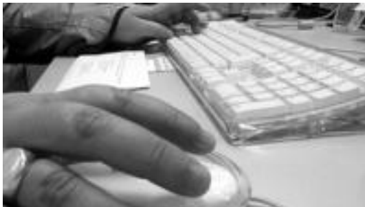
Ekainaren 30a arte egin daitezke eskaerak, udaltxean. L. MONTES

▶ Edukiak oso-osorik euskaraz izango dira gutxiarik; honek ez du eragozten beste hizkuntzetan ere izatea.