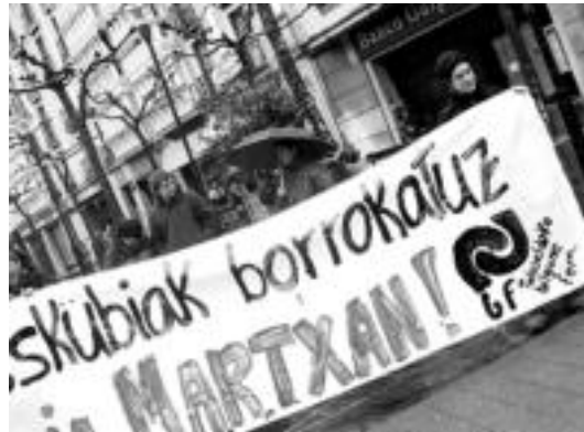
Larunbatean emakumeen aldeko bilkura egin zuten Tolosan. N.LATABURU

Alto. Gaur afaria Zuloaga Txikin. 20:30ean Altzoko plazatik irtengo dira. Larunbatean Teresa Lopez de Munianen baka-