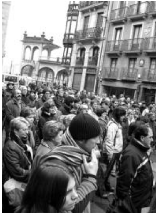
Gerontologikoaren aldeko aldarrikapenak adi entzun zituzten. J. ASTIBIA

Gerontologikoaren Aldeko Plataformakoei dei egin diete partidu politikoei, arazoari benetako irtenbidea emateko soluzioak bilatzen has daitezen