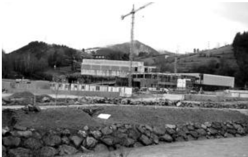
Usabalgo kiroldegiko lanen egoera atzo; hau bezalako ekipamenduak lagunduko ditu Aldundiak. J.SAIZAR

Oria ibaia, errepideak, bidegorriak, kultur, kirol eta gizarte ekipamenduak, adinekoak, ezinduak... lagunduko ditu