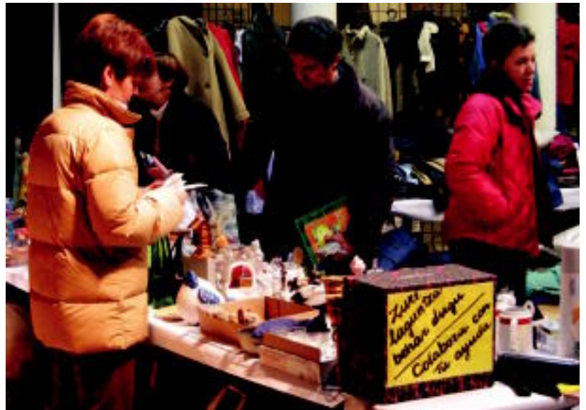
Denetatik aurki daitezke Elkartasun Azokan; gaur da ikusteko eta erosteko azken eguna. JAIONE ASTIBIA

«Herri horretan emakumeak bakarri bizi dira, bere umeekin. Beraiek atara behar dute herria aurrera. Horregatik zentro bat eraiki nahi dute: oinarriko eskola, sexologia eta lan batzuk ikasi —soldadura, ura ekartzen, baratza—...Ura ekarrita daukate eta orain lan batzuk egin behar dituzte», azal-