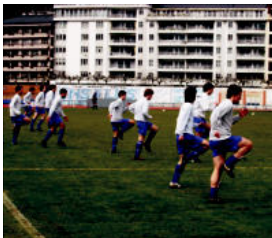
Tolosako futbolariak atzo partidua hasi aurretik berotzen. JOXEMI SAIZAR

LIDER ▶ Goren Mailako lidergoan bakarrik jarri da, Ordiziak ez zuelako irabazi Trintxerpen ▶ 5