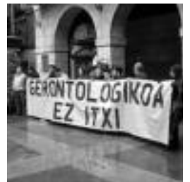
Manifestazio buruko lema. J. A.

Bestalde, argi utzi nahi izan zuten, eta honetakoan ere udal buruari zuzendu zitzaizkion, beren senideak lurramendira eramanez, ez dela bere merituz izan, «Tolosalderako ho-