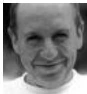
AUPA EMILIO! Eutsi goian! Bota bertsoa... borrokalari. Villabonako ezker abertzalea.