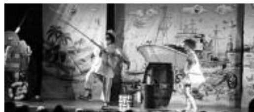
Pirritx eta Porrotx pailazoaren beste emanaldi bat. HITZA

Pirritx eta Porrotx pailazo ezagunek emanaldia eskainiko dute gaur, etxeko gaztetxoenen gozagarriarako. Pirritx eta Porrotx pailazoekin hitzordua Leidor zinema aretoan izango da, arratsaldeko 17:00etan.