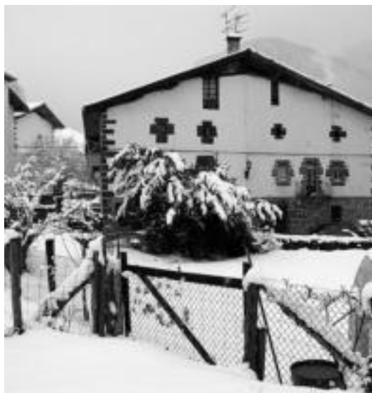
Herriko txokoak, zuhaitzak, atariak, zuri agertu ziren atzokoan. J. A.

Ez zuen hala hartuko, ordea, Leitzatik Goizuetara doan errepedean, kamioia tratatuta gel-