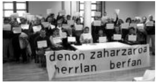
Plataformaren aurkezpena, otsailaren 19an, Kultur Etxean.

go direla jasotzen du mapak. Ez da inondik inora agertzen Gerontologikoaren itxiera: bertan dauden plazak zenbatuz gero 253 izango litzateke guztira; zentroa itxita, 191 gelditzen dira. Beraz, 75 falta dira. Aurreikuspenak Tolosaldeko egoiliarrentzat dira soilik, eta ez autonomoentzat, minusbaliatuentzat baizik. Gainera, mapan zera esaten da hitzez hitz: 'Erresidencia plazen eskaintza egokia da epe luzean'. Datu horien aurrean, «Gerontologi-