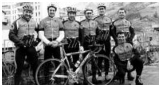
Marraskilo taldeko zikloturista batzuk, abiatu aurretik. MARRASKILO

Bihar ekingo dio denboraldiari Marraskilo zikloturista taldeak; Tolosa-Tolosa irteera egingo du, 60 kilometroko ibilbidea osatuz