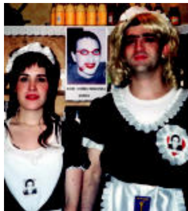
AUPA AITOR ETA KOLDO! Oztopo eta ilegalizazioen gainetik, aurrera Bolie! Batasuna.