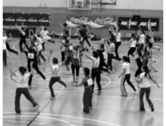
3 ordu inguru iraungo du Aerobik Maratoiak. HITZA

Aurtengoak badu berrikun- tzarik; orain arte, lehiaketatik t