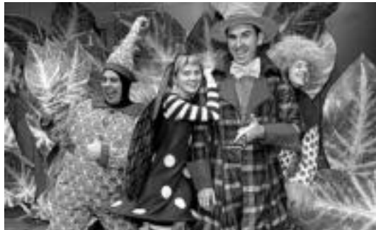
'Xomorroak' antzezlanaren une bat. I. TERRADILLOS

prestatzen ari dela, galdurik dagoen arraultza batetik Eulitxo jaioko da eta pentsatuko du Kike bere ama dela. Kikek astirik ez badauka ere, eulitxoari amatxo aurkitzeko bidaia hasiako du. Haurrentzako zuzenduta